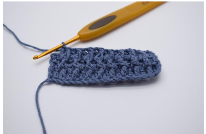
12. Gentag skiftevis Brstgm og Frstgm rækken ud.