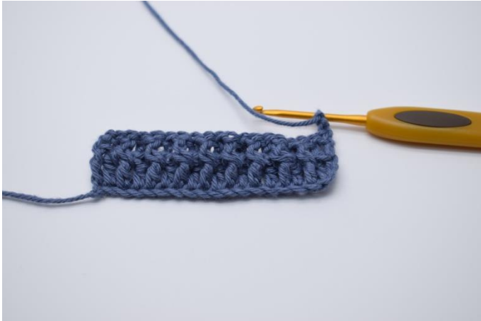
9. Vend arbejdet med 2 lm. De erstatter den første alm. stgm.