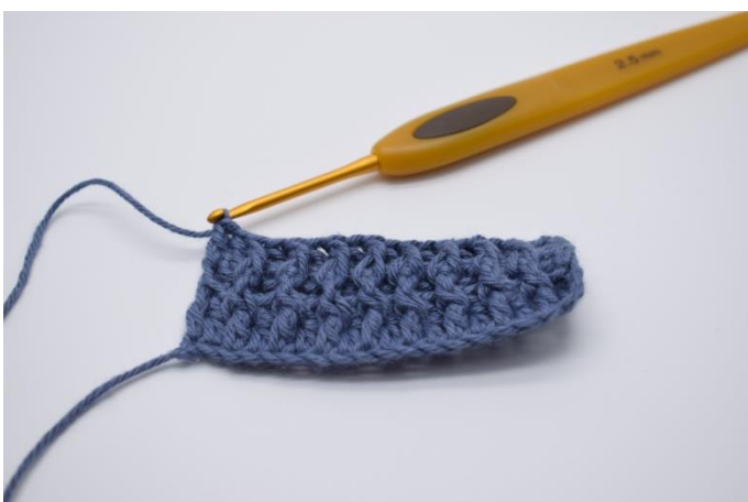
13. I vendemasken hækles en alm. stgm. Sådan gentages rækkerne til du har den ønskede størrelse.