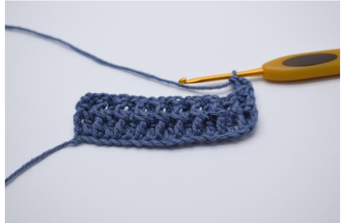
10. Nu hækles der 1 Brstgm om stolpen på forrige række.