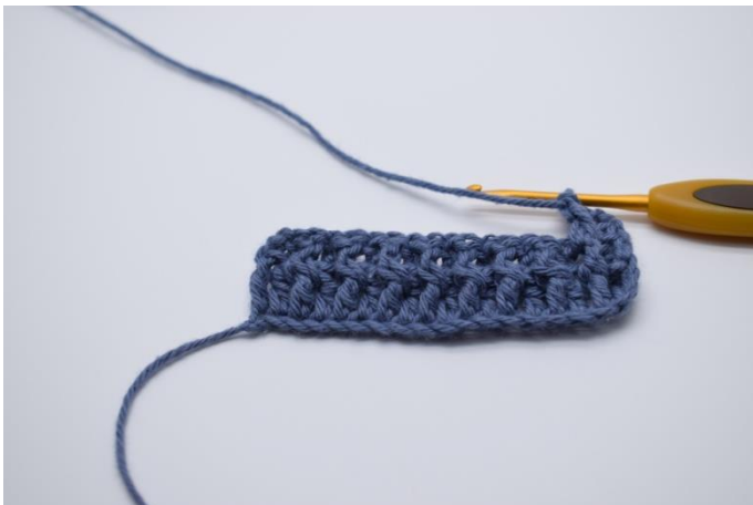
11. Om næste stolpe hækles 1 Frstgm.