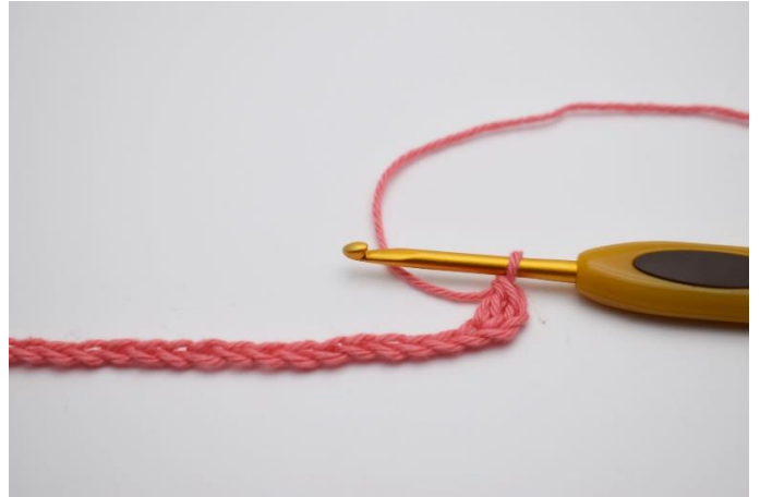
2. Hækl 1 stgm i 3. lm fra nålen.