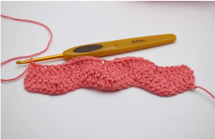
15. "Hækl 1 stgm i de næste 3 lm. Nu hækles der 3 stgm sammen. Hækl 1 stgm i de næste 3 lm, og i den efterfølgende lm hækles 3 stgm i samme lm." Gentag "til" rækken ud indtil du har 4 lm tilbage. Hækl 1 stgm i de næste 3 lm.