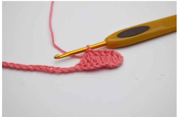
4. Nu hækles der 3 stgm sammen.