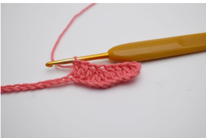
5. Hækl 1 stgm i de næste 3 lm.