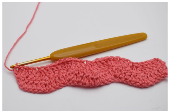
18. Sådan gentages rækkerne.