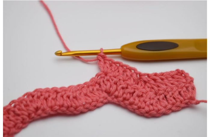
14. I Den efterfølgende m hækles 3 stgm i samme m.