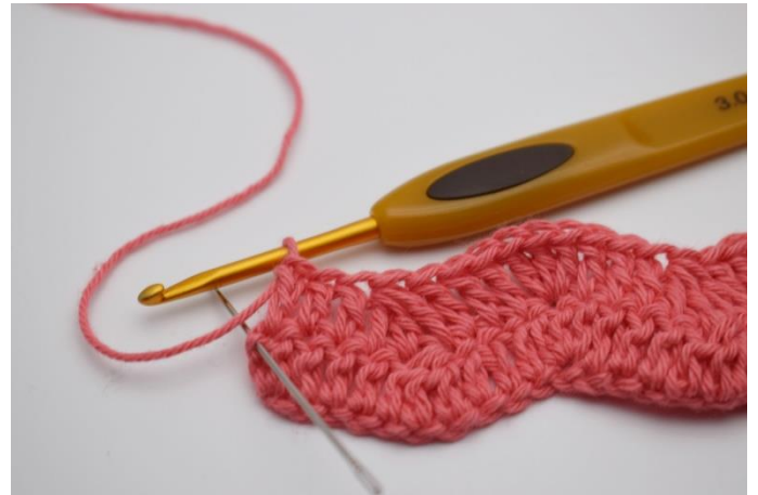
16. I vendemasken hækles 2 stgm.