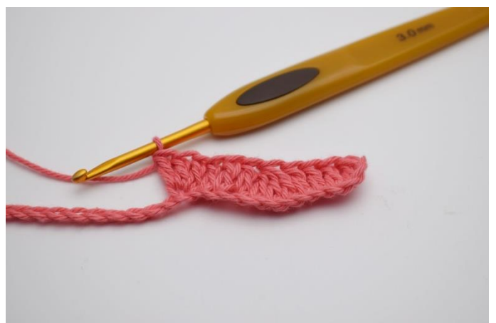
6. I den efterfølgende lm, hækles 3 stgm i samme lm.