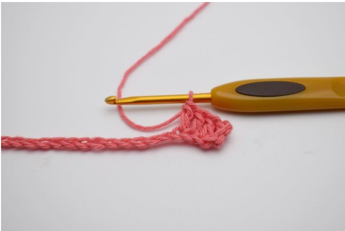
3. Hækl 1 stgm i de næste 3 lm.