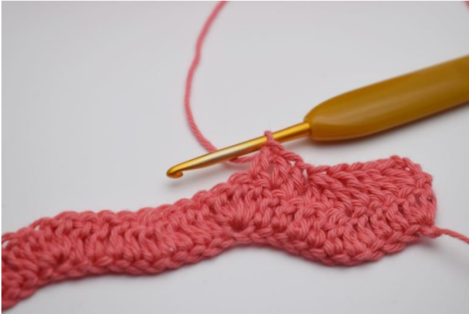
13. Hækl 1 stgm i de næste 3 m.