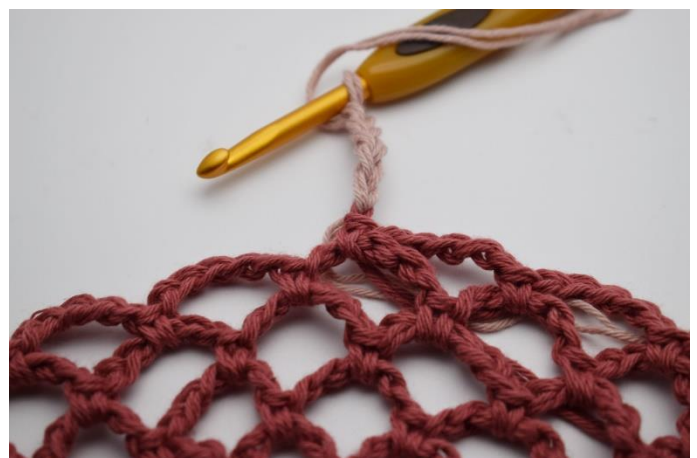
18. Skift til Gammelrosa, ved at lave dine næste 5 lm med den nye farve.