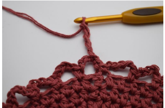
8. Lav 5 lm.