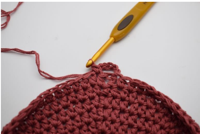
3. Spring 1 m over, og hæk 1 fm i næste.