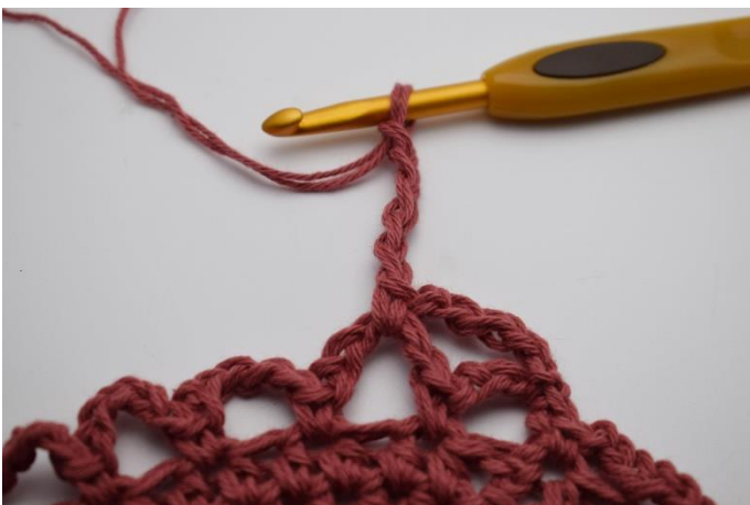
11. Lav 5 lm.