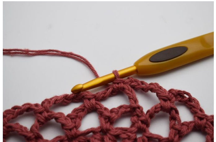
16. Hækl 1 fm i næste lm-bue. Sådan gentages omgangen til du har i alt 5 omgange med Mørk gammelrosa.