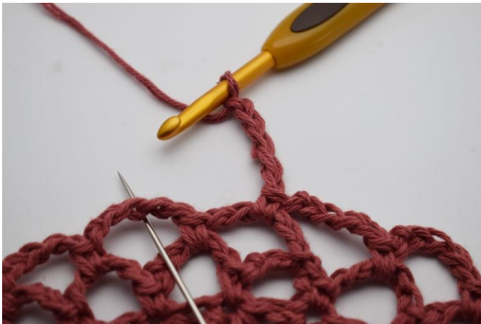
15. Så er du klar til at hækles endnu en omgang. Lav 5 lm.