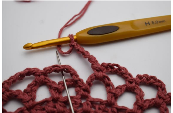
14. Sådan gentagen omgangen rundt. Omgangen afsluttes med 1 fm i den første lm-bue som blev dannet på denne omgang.