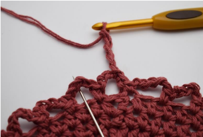
9. I næste lm- bue. (Nålen markere den her)