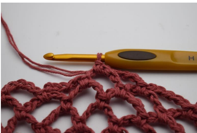
17. Den 5. omgang med Mørk gammelrosa er netop afsluttet her.