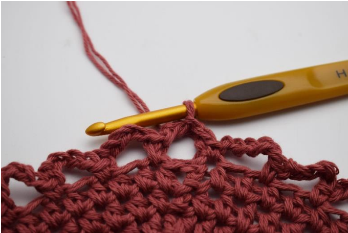
7. Lav 3 km op langs den første lm-bue, så du starter i midten af den.