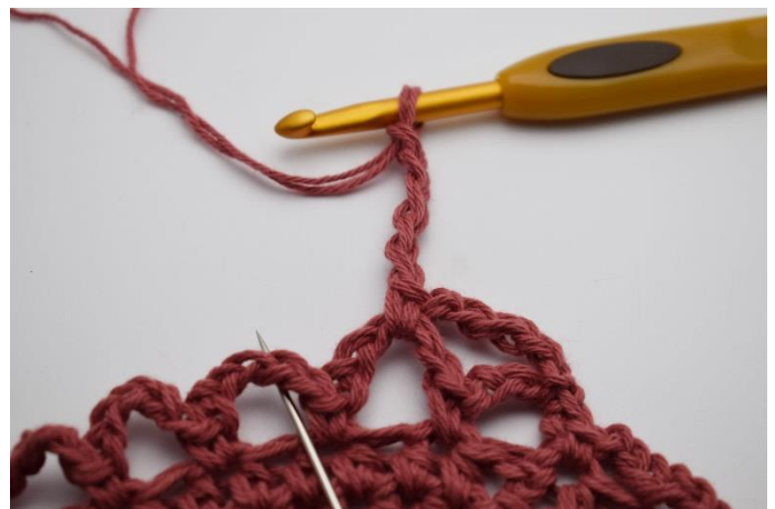
12. I næste lm- bue. (Nålen markere den her)