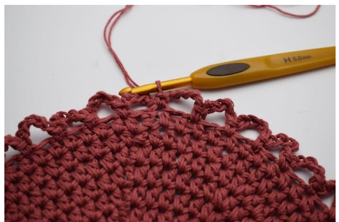
6. Sådan gentages omgangen rundt, så du har 36 lm-buer rundt om din bund.