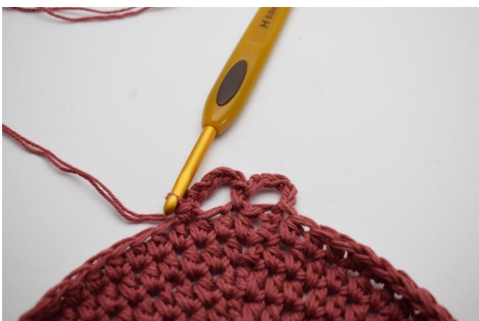
5. Spring 1 m over, og hæk 1 fm i næste.