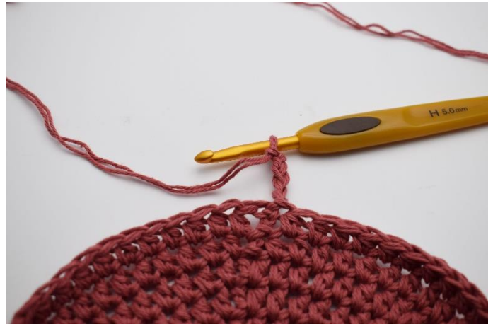
2. Lav 5 lm.