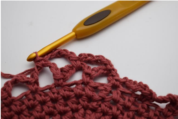
13. Hækles 1 fm.