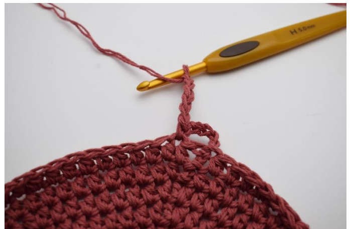
4. Lav 5 lm.