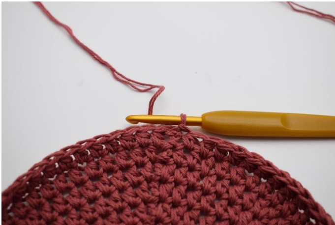
1. Her er bunden netop afsluttet med 1 km.