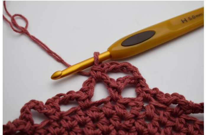
10. Hækles 1 fm.