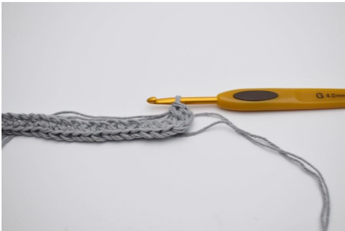
5. Hækles 4 fm. Nu hækles der på modsatte side af din lm række.