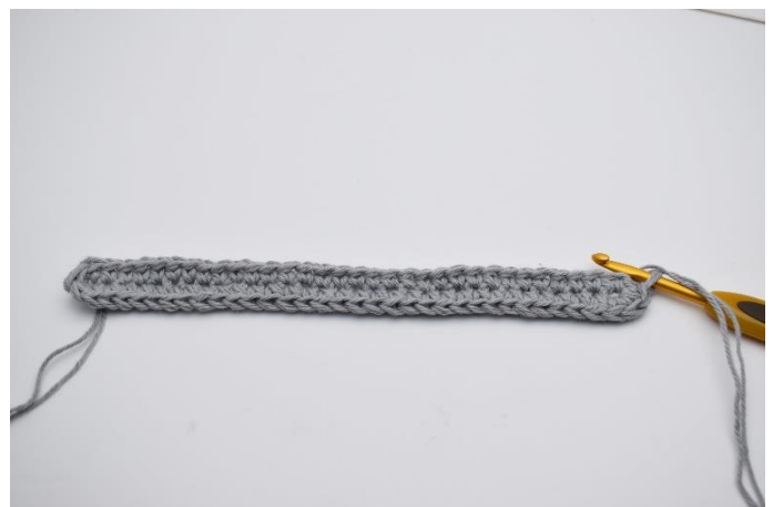
8. hækles 1 fm. (67)