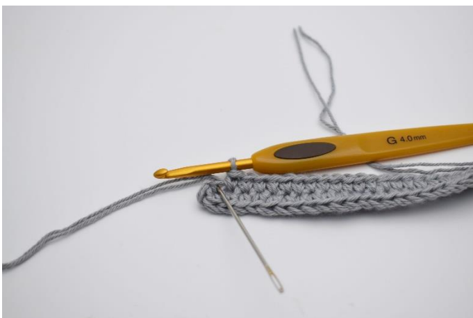
7. I den sidste lm (Nålen markere den her)