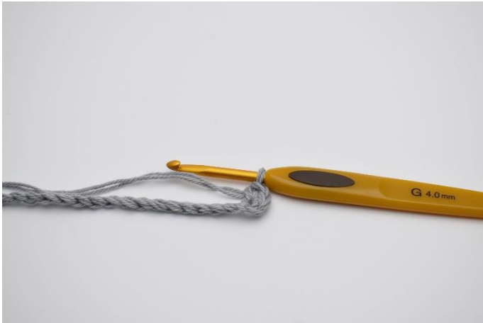
3. Hækles 2 fm.