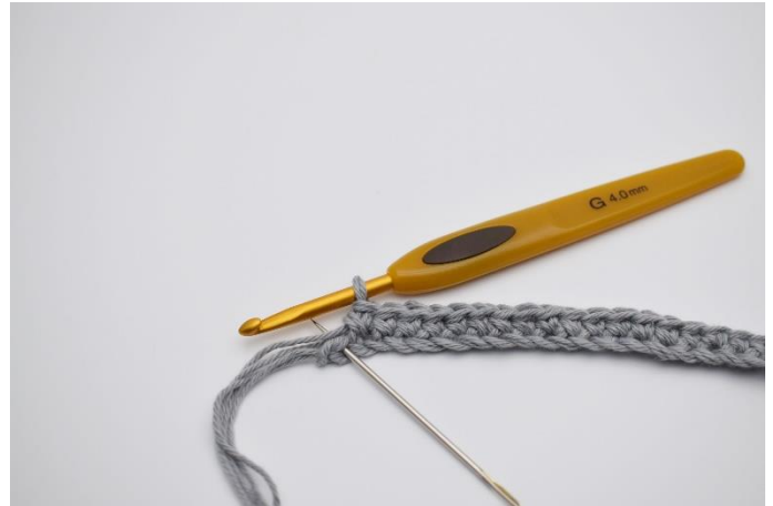
4. Hækl nu 1 fm i de næste 30 lm. I sidste lm (Nålen markere den her)