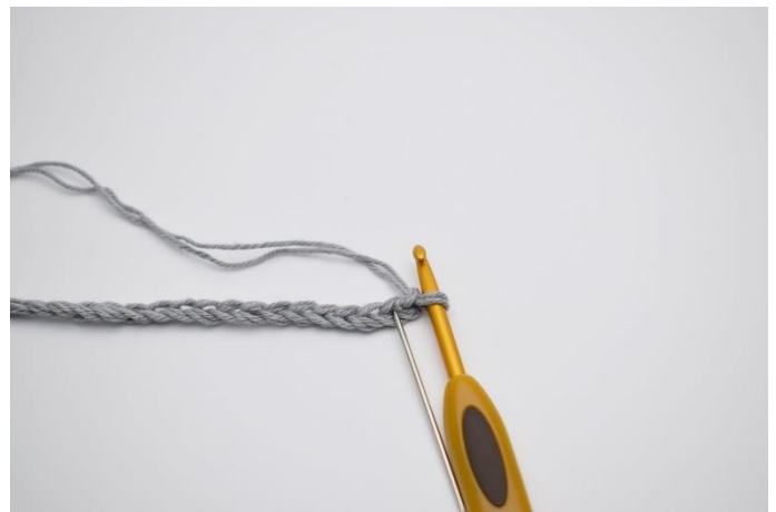
2. I 2. lm fra nålen (Nålen markerer den her)