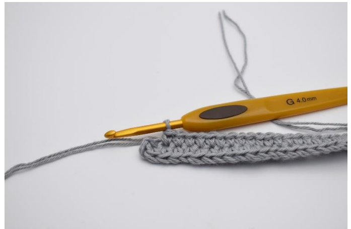
6. Hækl 1 fm i de næste 30 lm.