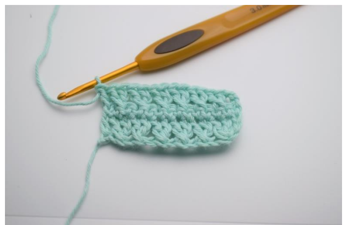
14. Der er nu hæklet endnu en række med krydset stgm. Sådan gentages rækkerne med krydset stgm og fm til du har den ønskede størrelse.