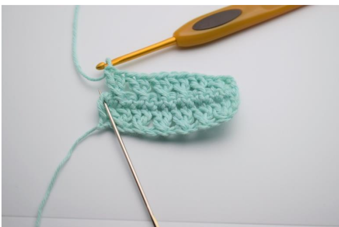
13. I sidste maske, hækles 1 stgm.