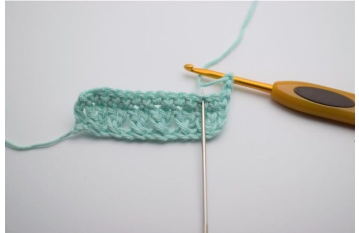
10. Vend arbejdet med 2lm. (De erstatter 1 stgm). Spring 1 m over, og hæk 1 stgm.