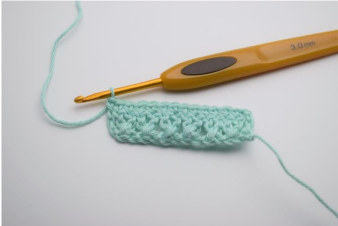
9. Nu er der hæklet 1 række med fastmasker.