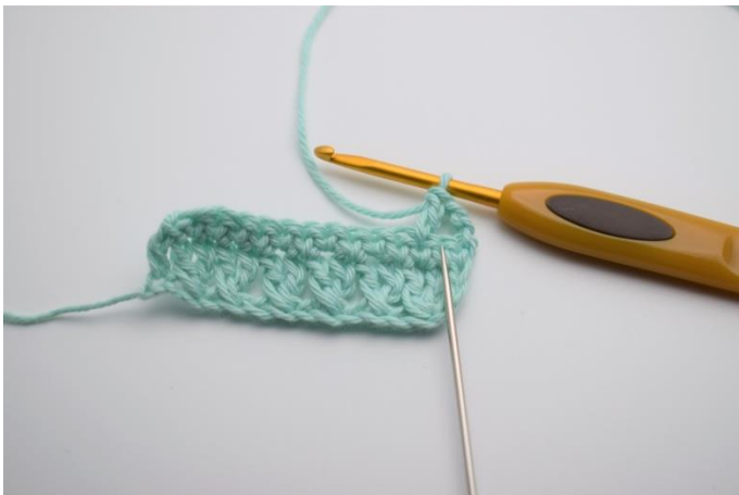
11. Nu hækles der 1 stgm i masken du netop har sprunget over. Så den krydser den anden stgm.