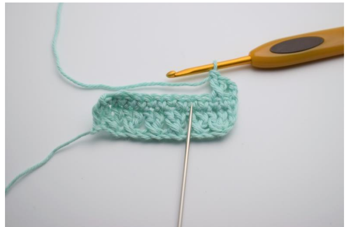
12. Spring 1 m over, hæk 1 stgm, efterfulgt af en stgm i masken der blev sprunget over. Så de igen krydser hinanden. Sådan gentages rækken ud.