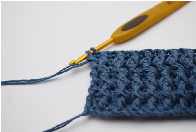
1. Farveskift laves i sidste gennemtræk.

Farveskift laves i sidste gemmentræk på rækkens sidste stgm som vist herunder: