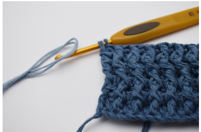
2. Indsæt den nye farve nu.