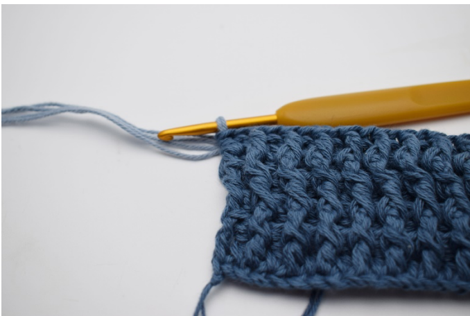
3. Så er du klar til at hækle med den nye farve.