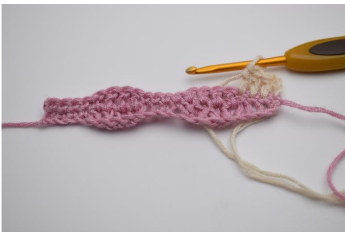
11. Hækl 1 stgm i de næste 3 masker.