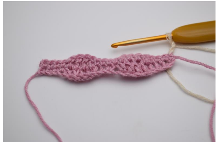
10. Skift til farve 2. Lav 3 lm. De erstatter 1.stgm.