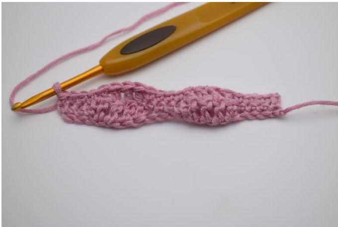
9. Hækl "1 fm i de næste 4 masker, 1 stgm i de efterfølgende 4 masker". Gentag "til" rækken ud, og afslut med 1 fm i de sidste 4 masker.