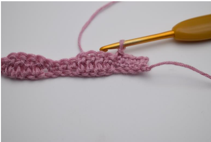
7. Hækl 1 fm i de næste 4 masker.