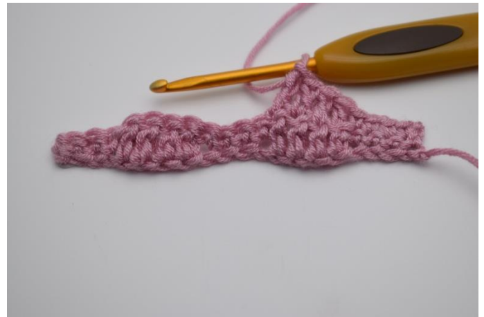
8. Hækl 1 stgm i de næste 4 masker.