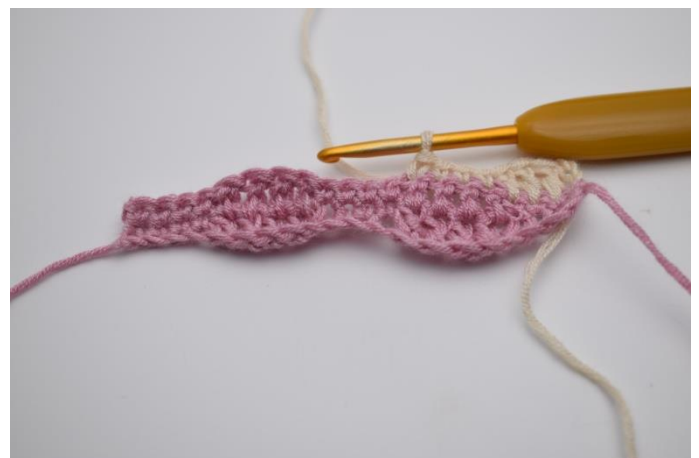
12. Hækl 1 fm i de efterfølgende 4 masker.