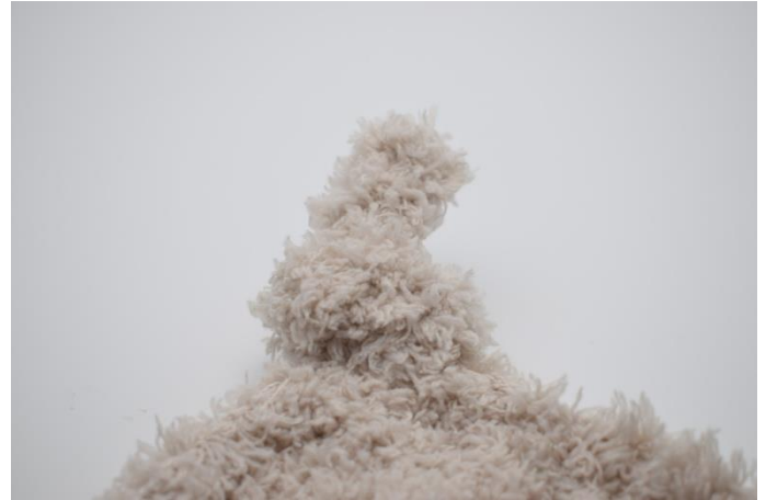
Bind en knude.

Hæft ender og nu er dit hygge tæppe klar ☺