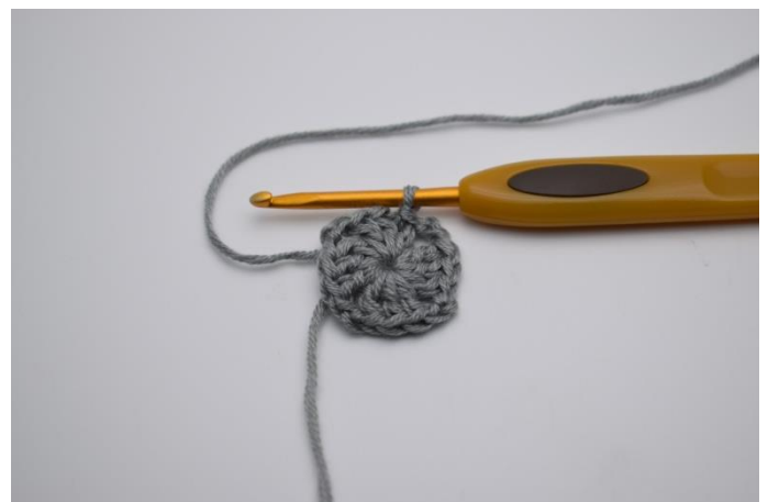
Hækl "3 stgm ned i ringen og 2 lm". Gentag "til" 2 gange mere og afslut med 1 km. Stram ringen til.