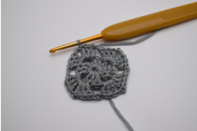
Lav nu km hen til første lm-mellemrum.