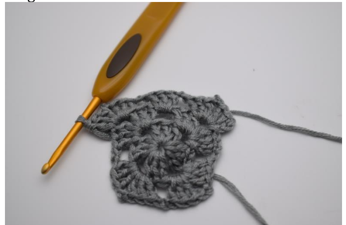
I hver hjørne lm-mellemrum hækles der "3 stgm, 2 lm, 3 stgm, 1 lm"