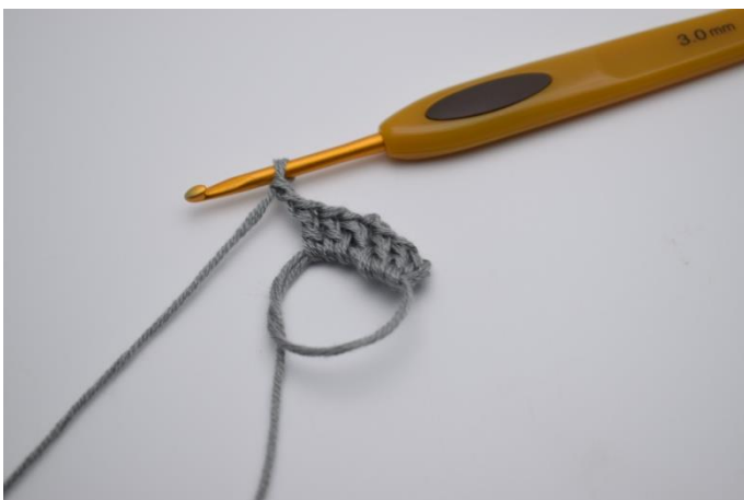
Hækl 3 stgm ned i ringen, og lav 2 lm.