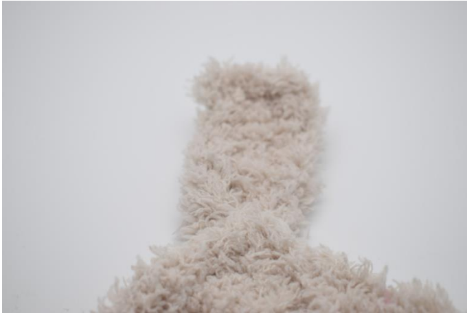
Sådan ser dit hjørne nu ud.