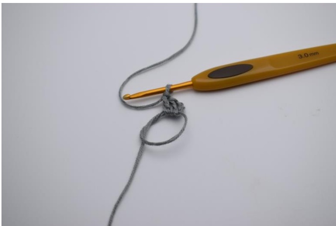
Lav en magisk ring. Lav 3 lm (erstatte 1 stgm) Hækl 2 stgm ned i ringen.