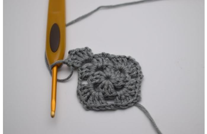
Lav 3 lm (erstatte 1.stgm) Hækl 2 stgm, 2 lm, og 3 stgm ned i lm-mellemrummet.