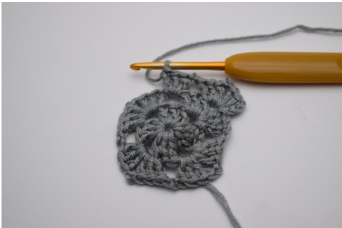
I hver lm-mellemrum i siderne hækles 3 stgm efterfulgt af 1 lm.