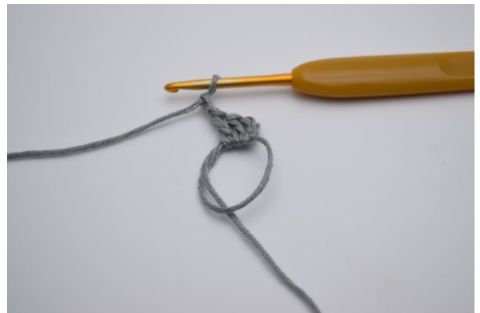
Lav 2 lm.