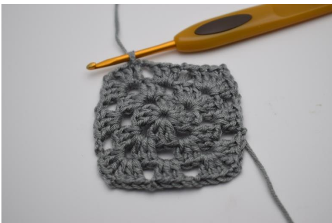
Gentag hele vejen rundt og afslut med 1 km.