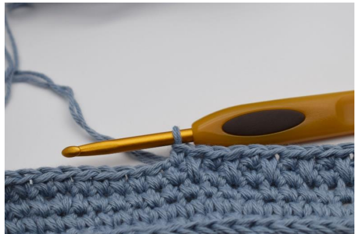
8. Sådan. Dette gentages omgangen rundt.