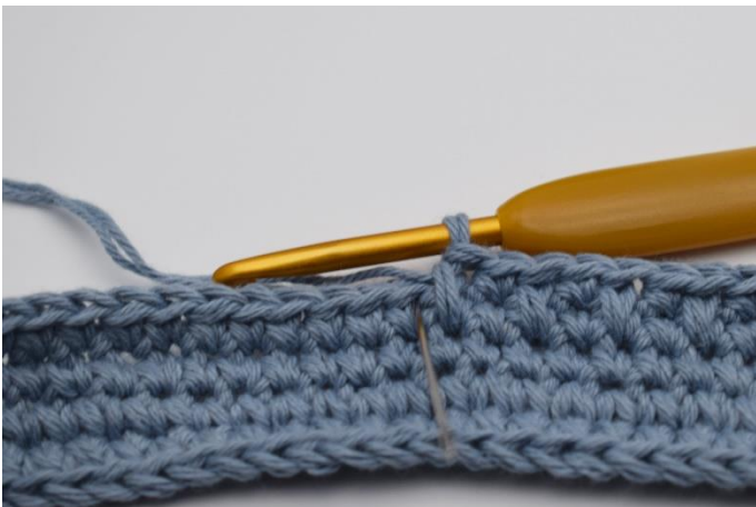
7. Hækl 1 fm som normalt ved siden af.