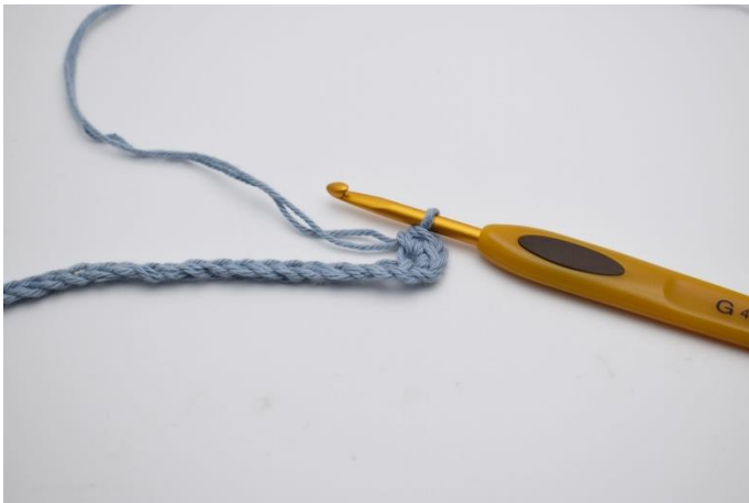
3. Hækles 2 fm.