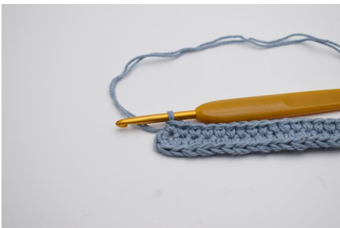
7. Hækles 1 fm. (67)