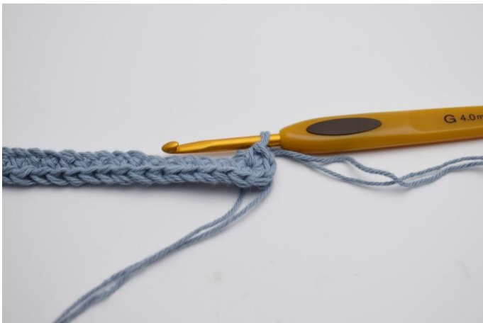
5. Hækles 4 fm. Nu hækles der på modsatte side af din lm række.