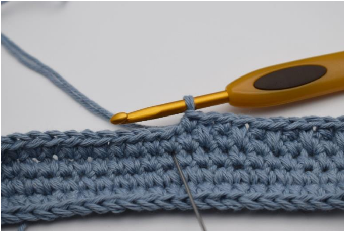
5. Næste maske er igen en dfm. Den hækles som en normal fm men i masken under. (Nålen markerer her hvor din dfm skal hækles)