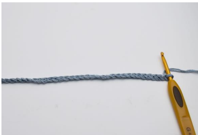
1. Start med at slå dine luftmasker op.