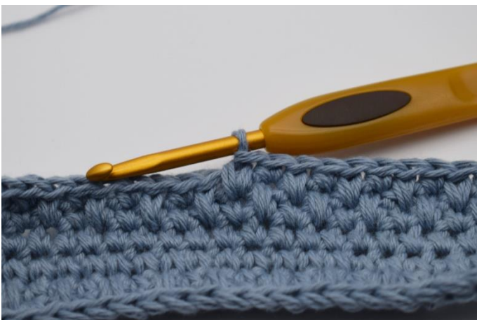
9. Når du skal hække din næste omgang, hækles der modsat, så du starter omgangen med 1 dfm, efterfulgt af 1 fm. Dvs. at du hækler dfm i fm fra forrige omgang, og fm i dfm fra forrige omgang. Sådan gentages de 2 omgange til du har den ønskede højde på din pung.