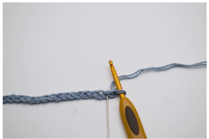
2. I 2. lm fra nålen (Nålen markerer den her)