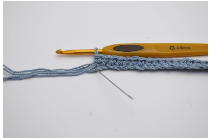
4. Hækl nu 1 fm i de næste 36 lm. I sidste lm (Nålen markere den her)