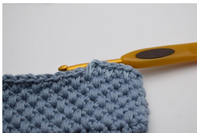
2. Skift den ene tråd ud med farve 2, så du nu hækler med farve 1 & 2.