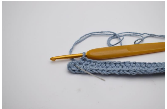
6. Hækl 1 fm i de næste 36 lm. I sidste lm (Som nålen her markere)