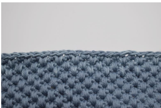
3. Hækl 3 omgange.