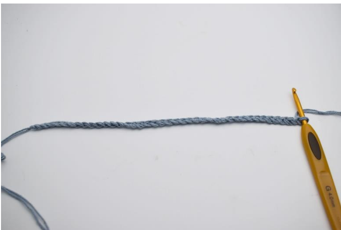
1. Start med at slå dine luftmasker op.