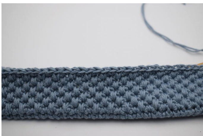
1. Der er hæklet 7 omgang med skiftevis fm, og dfm med farve 1.

Skift så du nu kun har farve 4. Hækl 4 omgange. Afslut med 1 omgang fm.