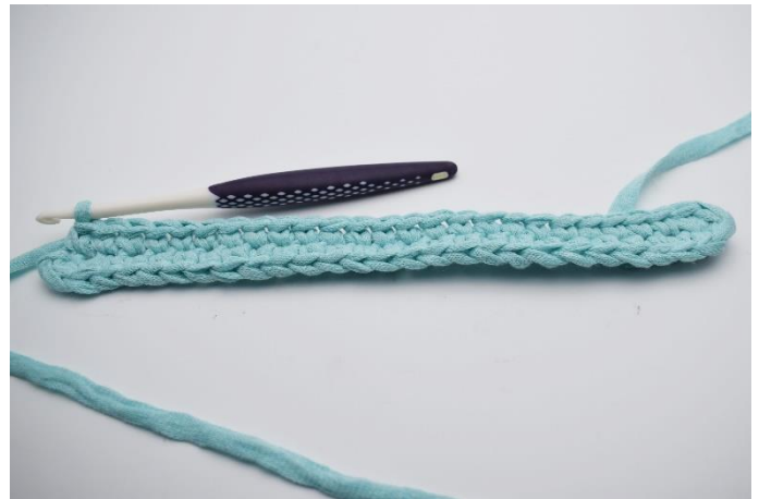
6. Nu hækles på modsatte side af din lm-række. Hækl 1 fm i de næste 24 lm.