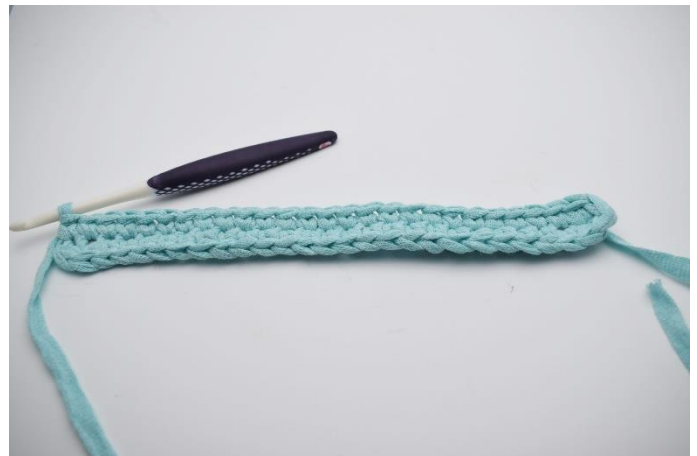
8. Hækles 1 fm. (55)