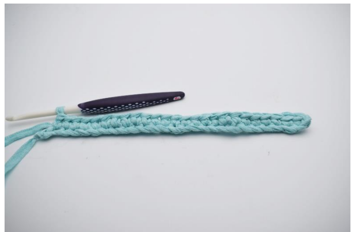
4. Hækl 1 fm i de næste 24 lm.