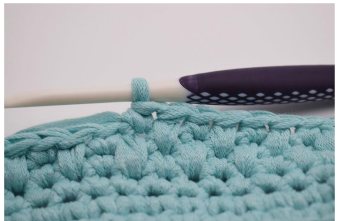
12. sådan gentages omgangene.