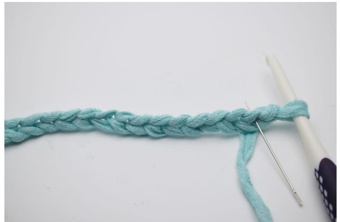
2. I 2.lm fra nålen (Den nålen her markere)