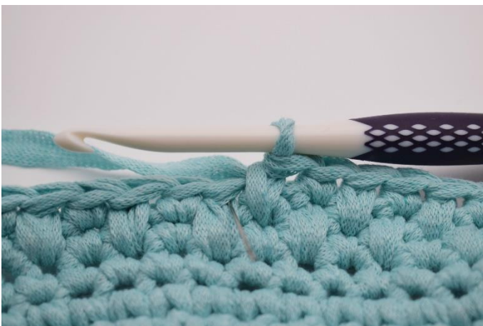
11. Næste fm hækles som normalt i masken ved siden af.