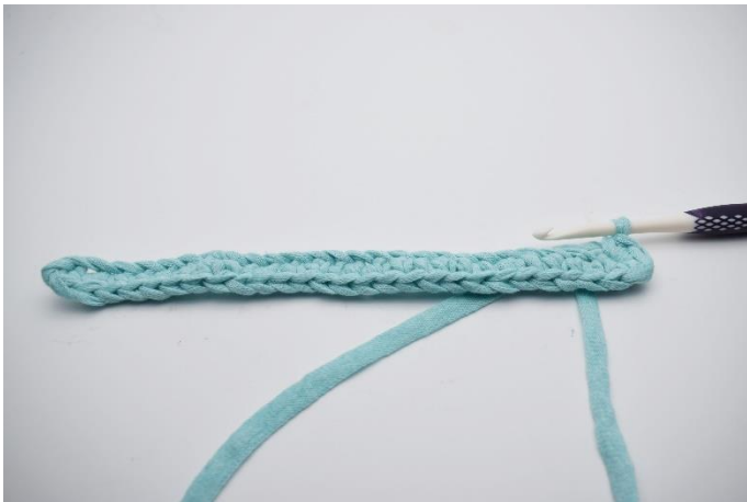
5. I sidste lm hækles 4 fm.