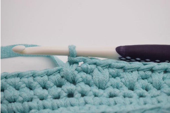
7. Sådan gentages omgangen rundt, og afsluttes med 1 fm.

markere hvor du skal hækles din næste maske for at det bliver en dyb fm.