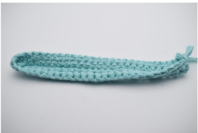
9. Hækl 1 omgang fm.