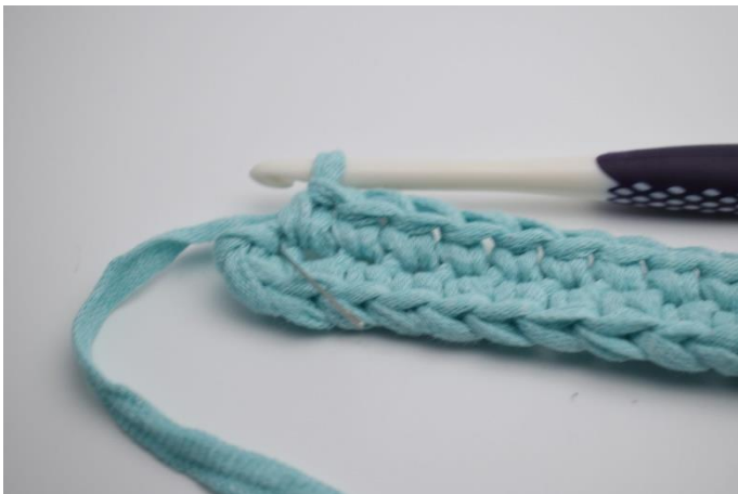
7. I sidste lm. (som nålen her markere)