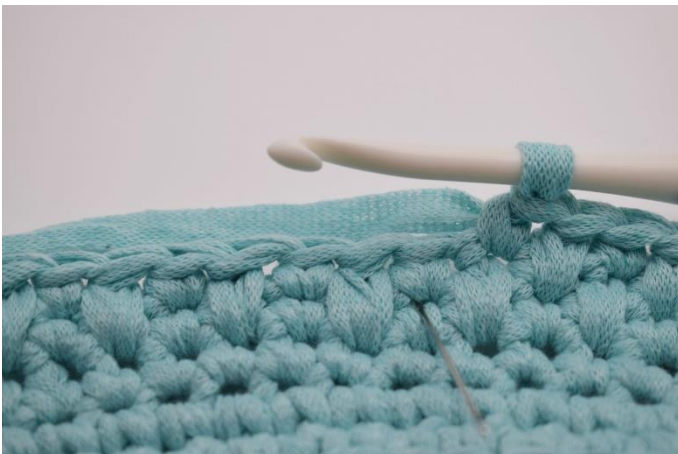
9. Nålen her markere hvor din næste maske skal hækles så det bliver en dyb fm.