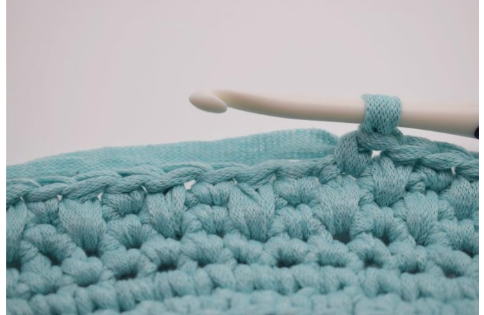
8. Næste omgang hækles med skiftevis "1 dfm, 1 fm."