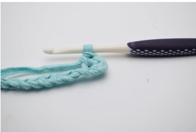
3. Hækles 2 fm.