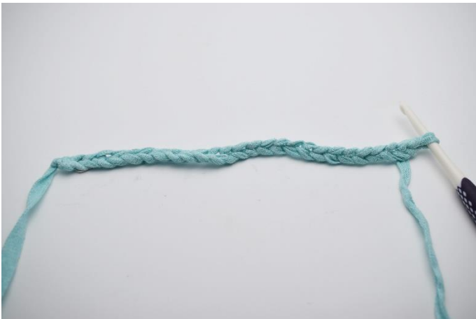
1. Start med at slå dine luftmasker op.