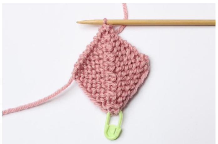
2. På næste retside strikkes 3 m ret sm som før = 1 m tilbage.