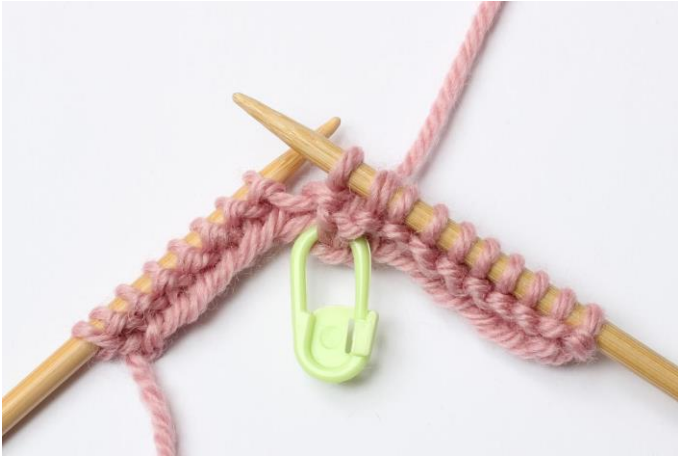
5. Strik disse masker ret sammen