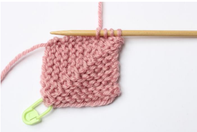
1. Stik pinden gennem arbejdet mellem 2 riller, træk garnet med tilbage.