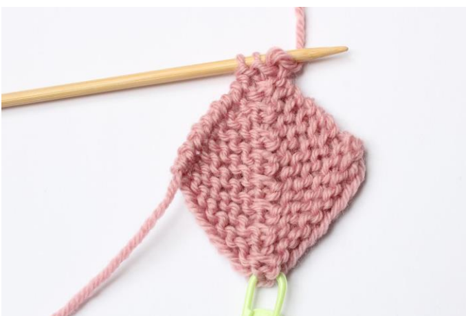
1. Strik til der er 3 masker tilbage