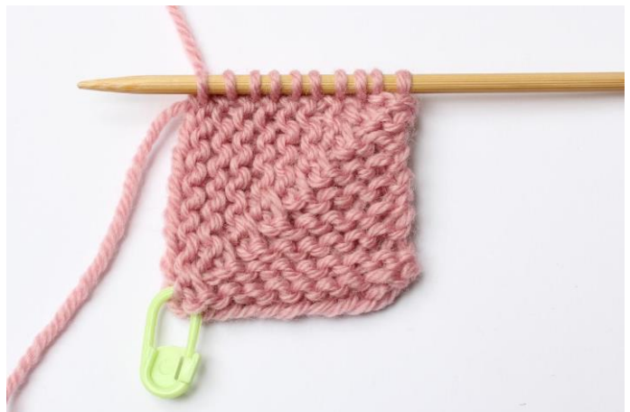
2. Gentages til alle masker er strikket op.