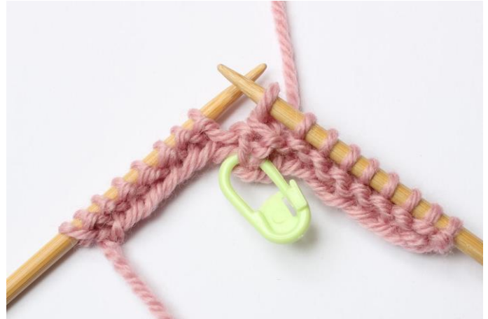
6. Træk den løse maske over