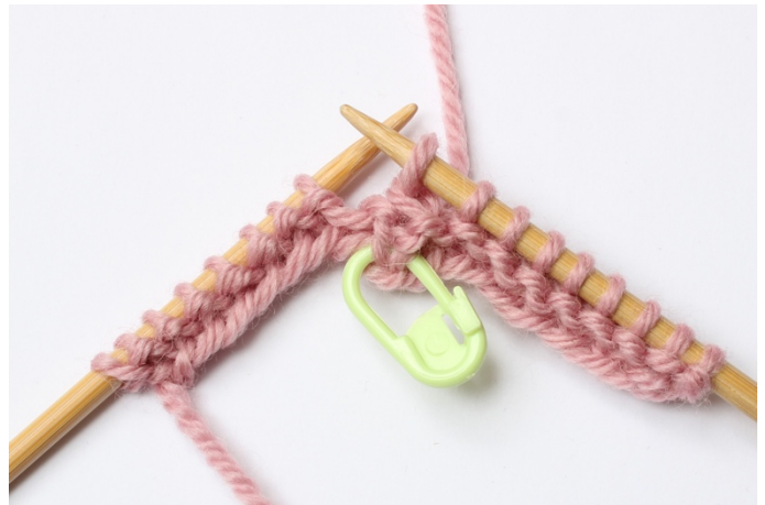
6. Træk den løse maske over.