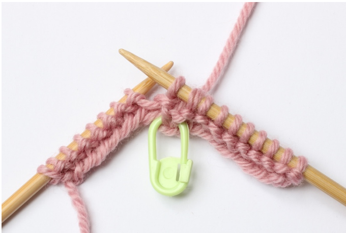
5. Strik disse masker ret sammen