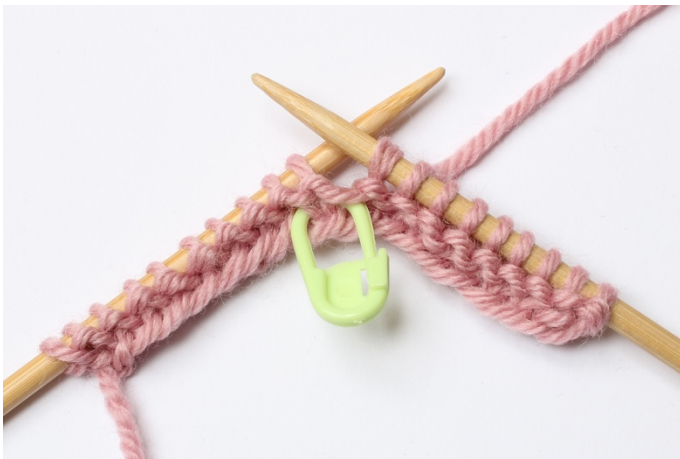
3. Sæt den over på højre pind,