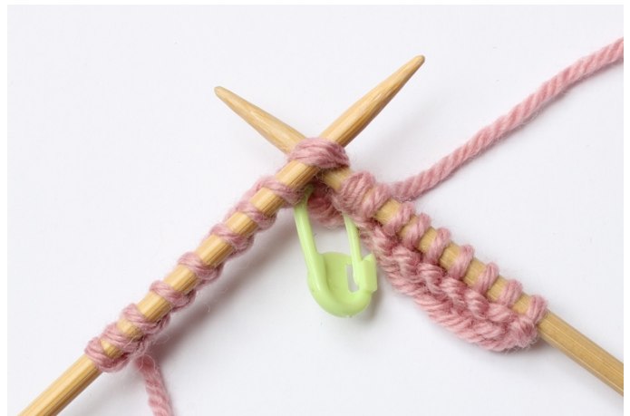
4. Stik pinden ind i 2 masker, fra venstre mod højre,