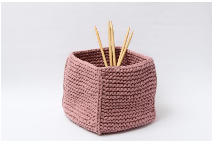
Kurv uden ombuk

Vend retten ud af arbejdet og fold kanten ned.