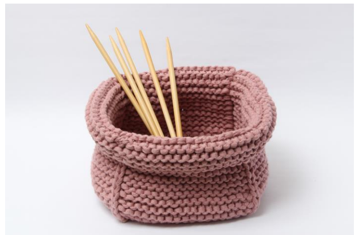
Kurv med ombuk