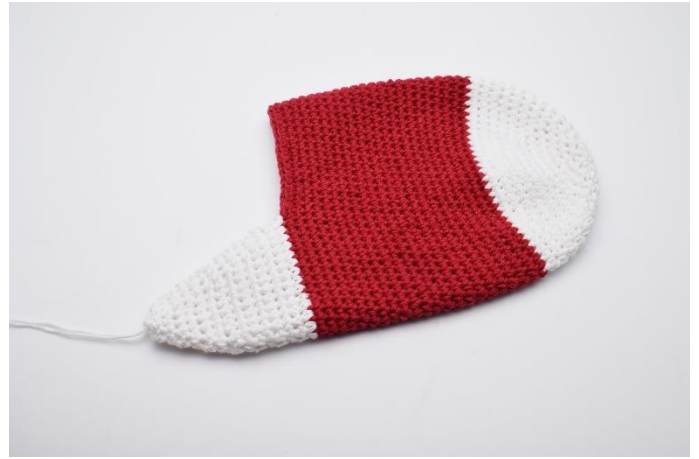
Sy enden sammen på vrangside. Din hæl er nu færdig.