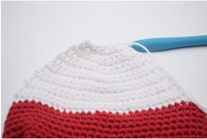
Sådan ser hælen ud nu.