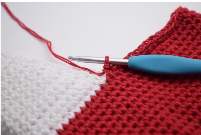
Hækl 1 fm i 32 m frem til hvor hælen starter.