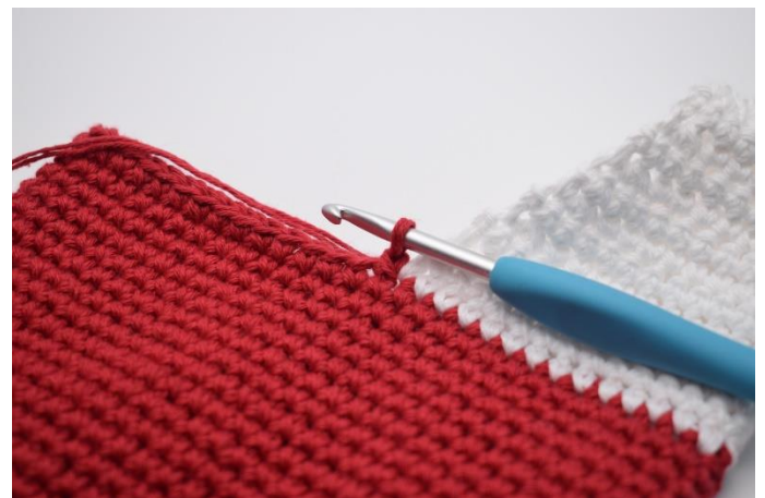
Indsæt det røde garn.