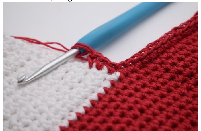
Hækl nu 14 fm langs den ene side af hælen