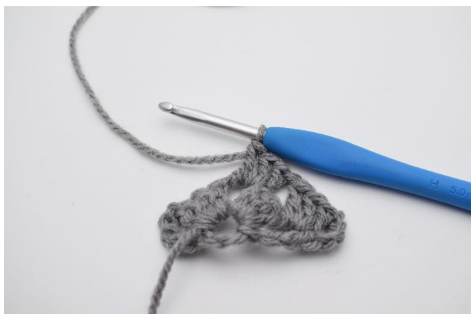
11. Hækl 1 stgm gruppe.