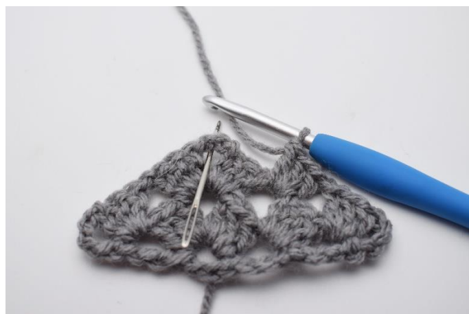
23. Nu hækles der igen i spidsen, og ned i lm buen.