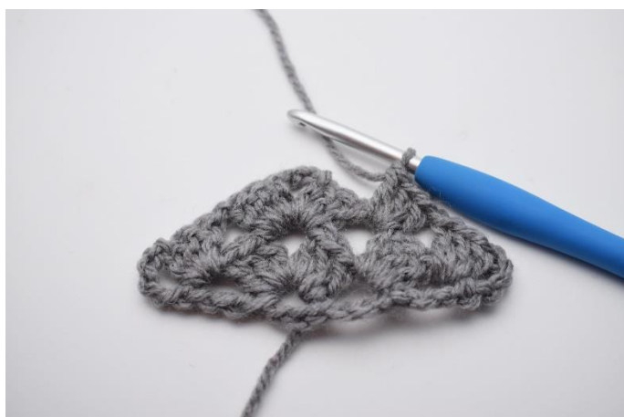
22. Hækl 1 stgm gruppe og lav 1 lm.