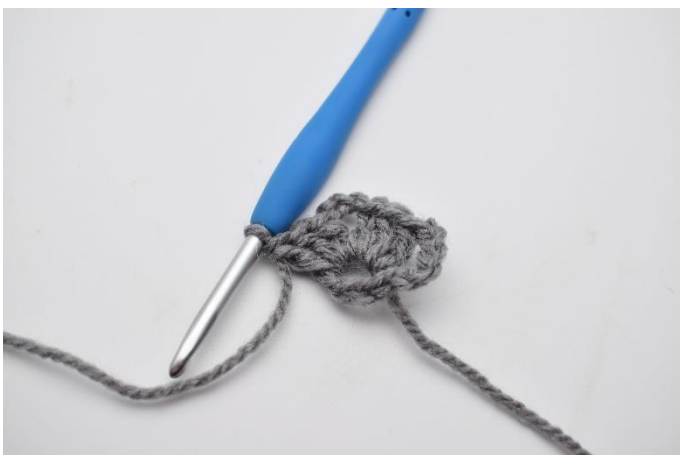
5. Hækl 3 stgm ned i ringen.