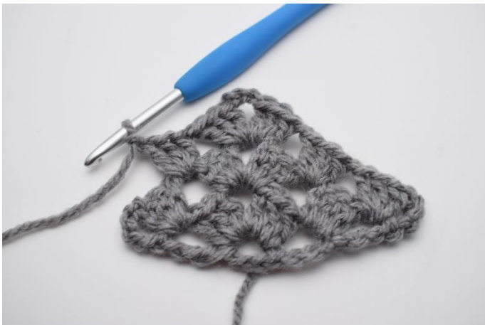
26. Hækl 1 stgm gruppe.