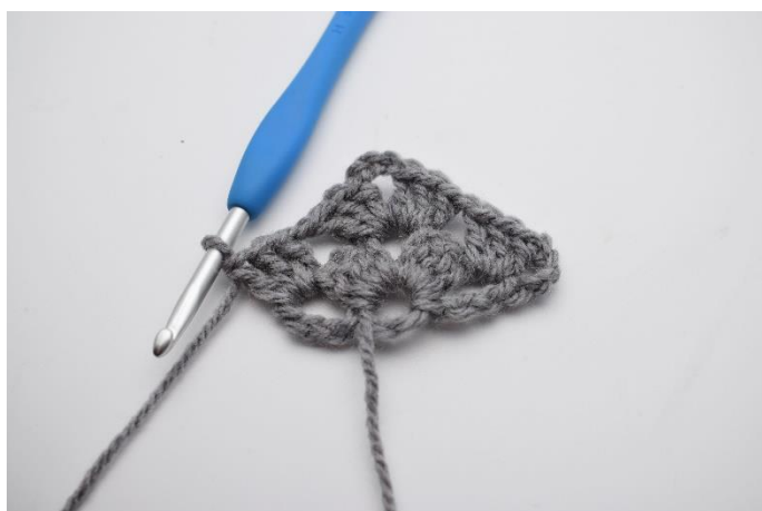
15. Hækl 1 stgm gruppe.