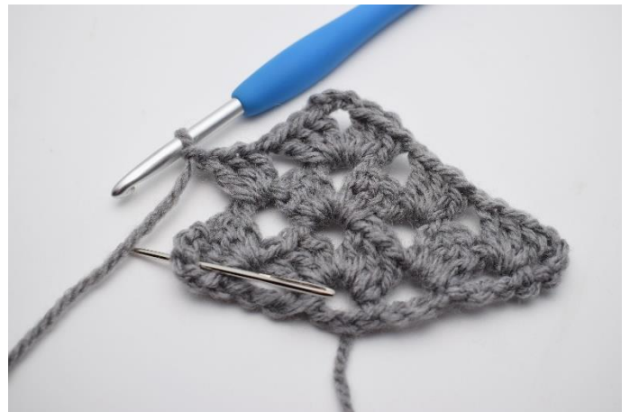
27. Lav 1 lm, og næste stgm gruppe hækles i næste mellemrum som nålen her markerer