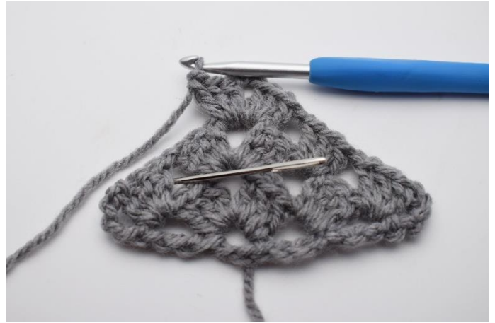
25. Lav 1 lm. Næste stgm gruppe hækles i næste mellemrum som nålen her markerer.