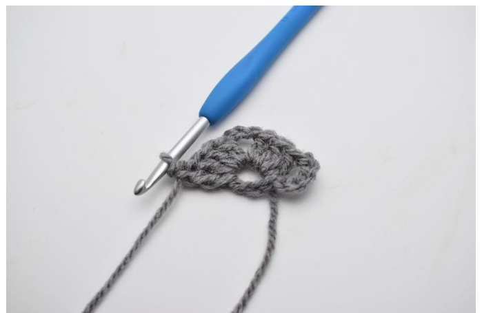
6. Lav 1 lm, og hækl 1 dbstgm ned i ringen.