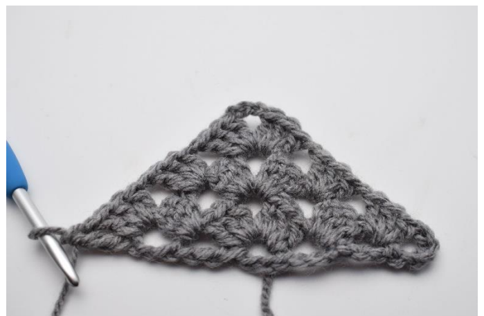
29. Lav 1 lm, og hækl 1 dbstgm i 4. lm fra forrige omgang.