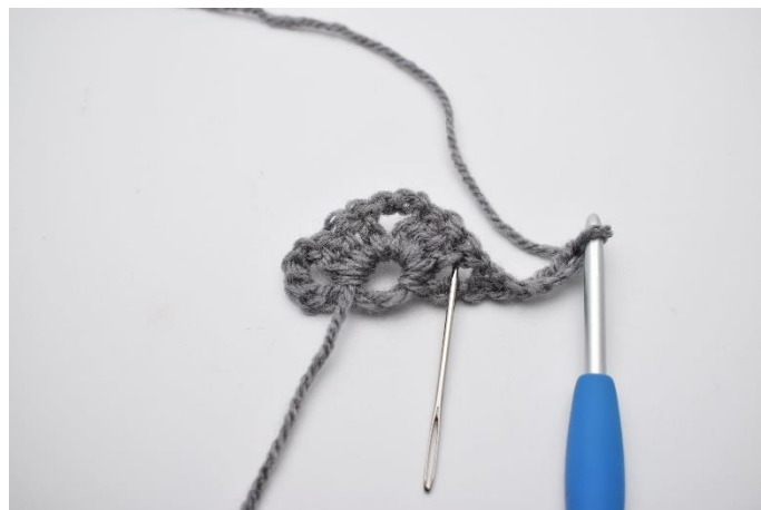
8. I mellemrummet som nålen her markerer