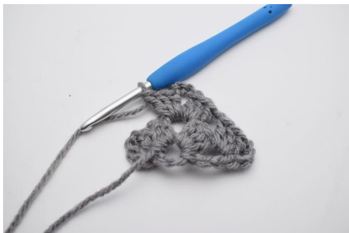
13. Hækl endnu 1 stgm gruppe.