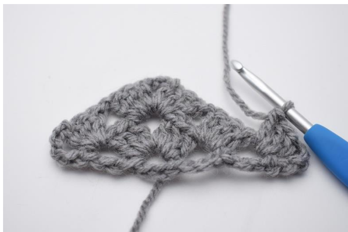
20. Hækl 1 stgm gruppe.