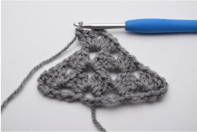
24. Hækl 1 stgm gruppe, 3 lm, 1 stgm gruppe ned omkring 1m buen.