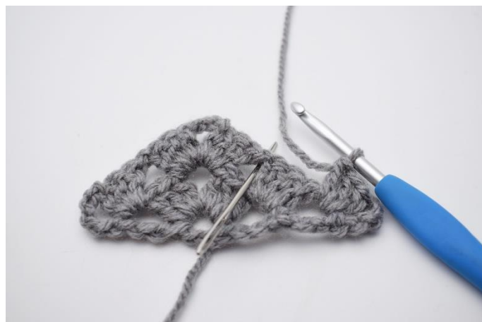
21. Lav 1 lm. Næste stgm gruppe hækles i næste mellemrum.