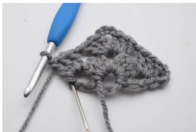
16. Lav 1 lm, og nu hækles der i 4. lm fra forrige række.