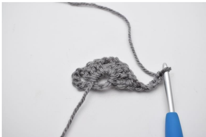
7. Vend arbejdet og lav 5 lm.