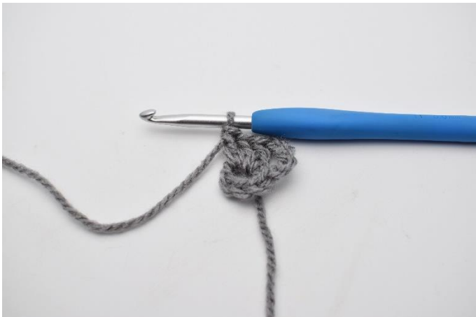
3. Hækl 3 stgm ned i ringen.