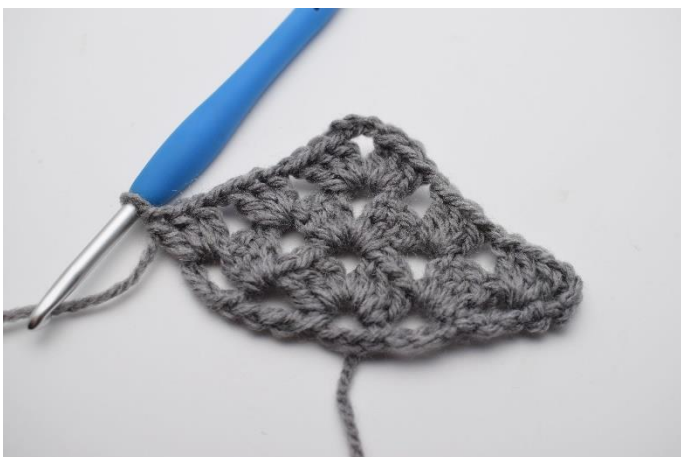
28. Hækl 1 stgm gruppe.