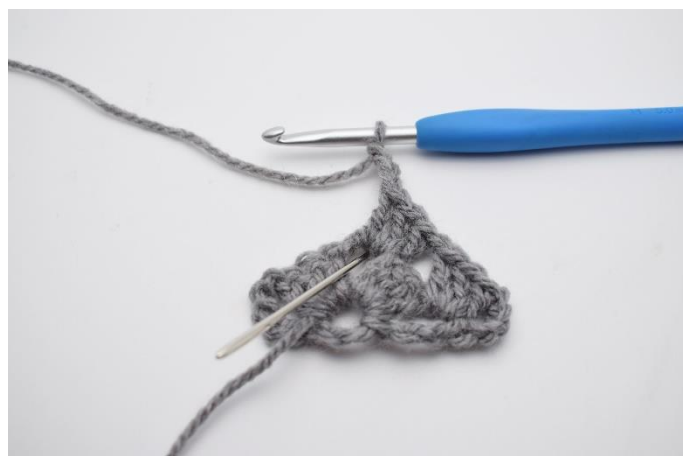
12. Lav 3 lm. Der hækles igen ned i lm-buen