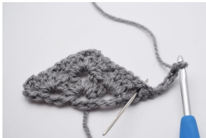
19. Der hækles nu mellemrummet som nålen her markerer.