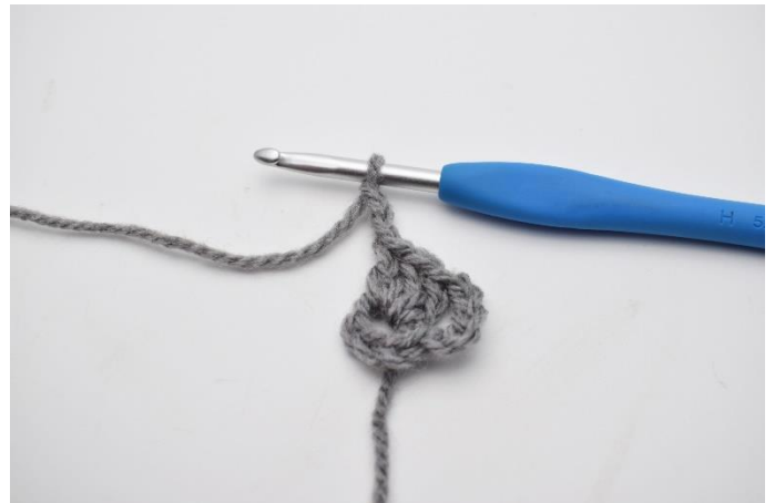
4. Lav 3 lm.