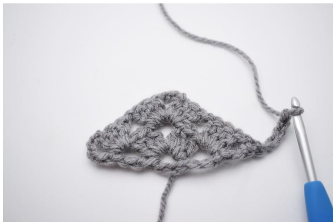
18. Vend arbejdet og lav 5 lm.