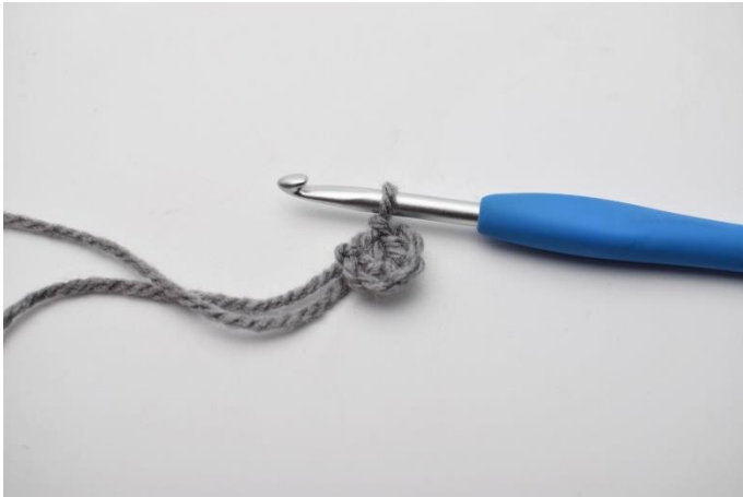
1. Lav 6 lm, og saml dem til en ring med 1 km.