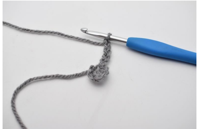
2. Lav 5 lm.