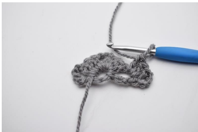
9. hækles 1 stgm gruppe.