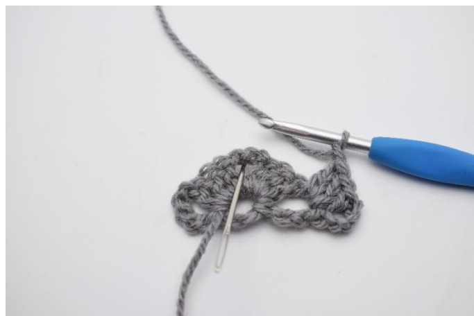
10. Lav 1 lm. Nu hækles der ned i lm-buen fra forrige omgang. (Dette er spidsen af tørklædet)