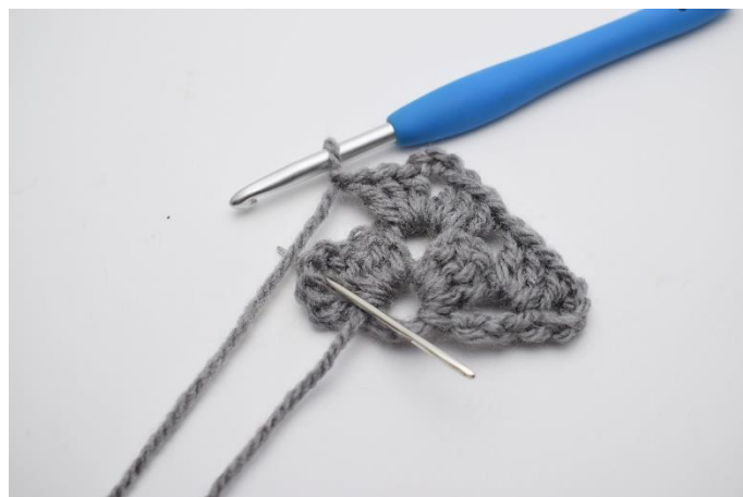
14. Lav 1 lm. Næste stgm gruppe hækles i mellemrummet som nålen her markerer.