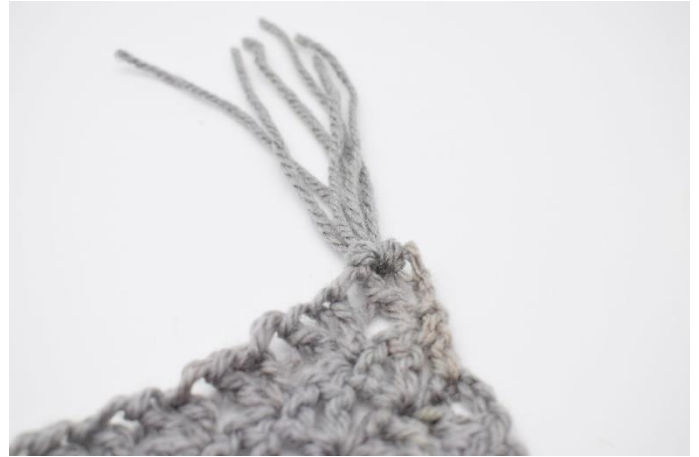
6. Stram let til.