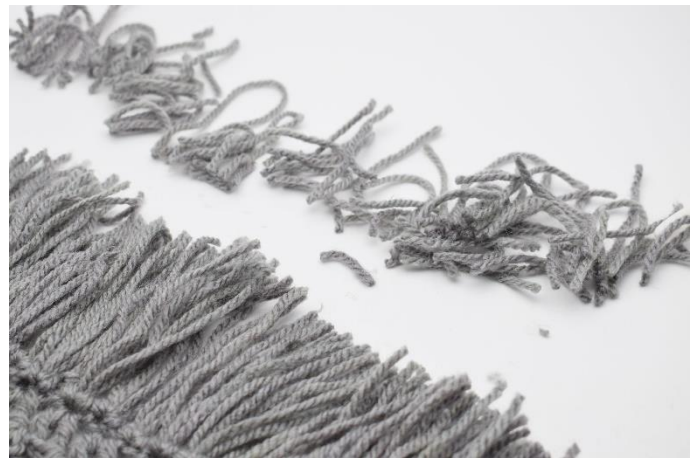
8. Klip dine frynser i den ønskede længde.