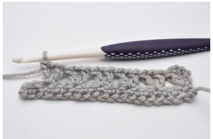
8. Gentag dette rækken ud til du har 3 m tilbage.