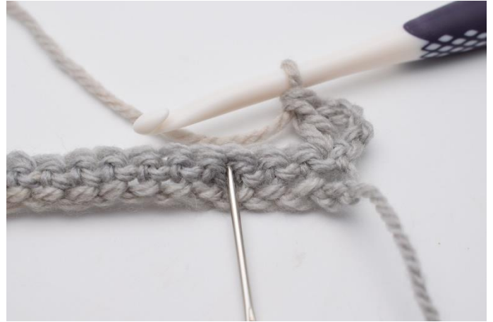
4. Spring 2 m over. I næste maske (den nålen her markerer),