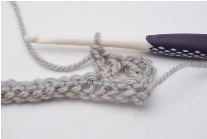
5. hækles "1 stgm, 1 lm, 1 stgm".