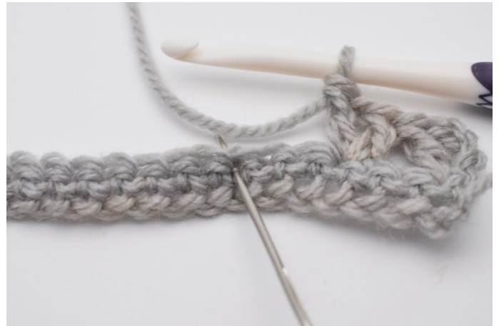
6. Spring 2 m over. I næste maske (den nålen her markerer),