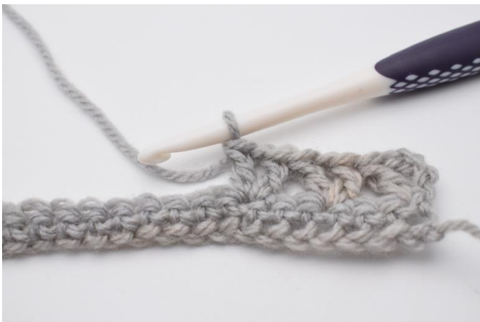
7. hækles "1 stgm, 1 lm, 1 stgm".