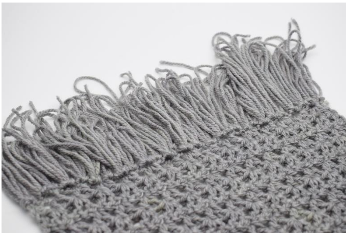
7. Gentag dette hele vejen hen på begge ender. Spring evt. hver 2. eller 3. maske over så det ikke bliver for tæt og kompakt med frynserne.