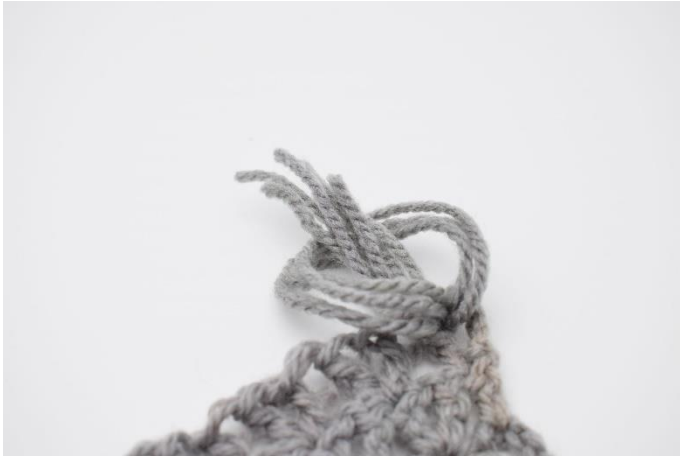
5. Kom nu garn enderne ind i løkken.