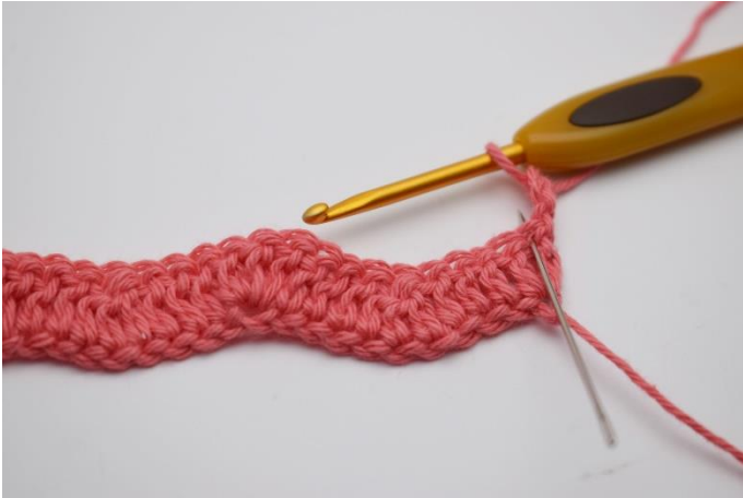
9. Vend arbejdet med 3 lm. Den første stgm hækles i første m, som nålen her markere.