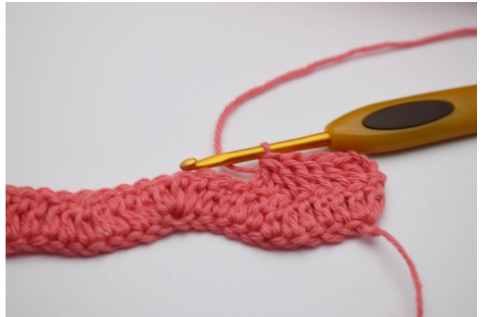
12. Hækl 3 stgm sammen.