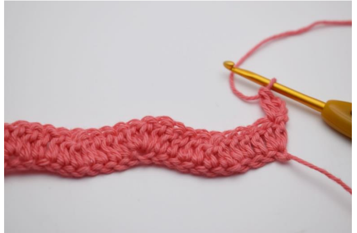
10. Hækl 1 stgm i den første m.