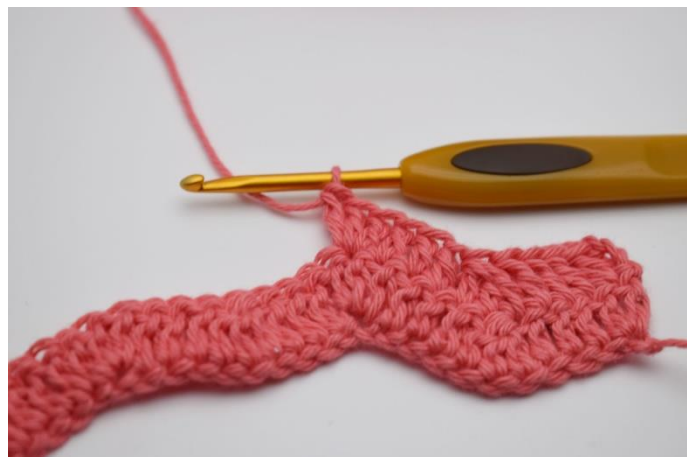
14. I den efterfølgende m hækles 3 stgm i samme m.