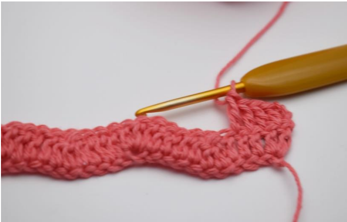
11. Hækl 1 stgm i de næste 3 m.