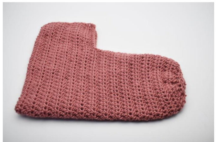
2. Fold stykket som billedet herover.