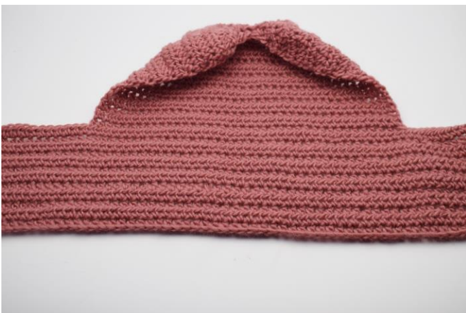
1. Sådan vil det nu se ud.

NB Filtning varierer fra maskine til maskine. Filt i maskinen ved 40 grader igen, hvis de ikke er filtet nok. Disse har fået 2 x 40 grader i vaskemaskinen og derefter formet/udvidet med selve foden eller papir mens de er våde, og derefter tørret i facon.