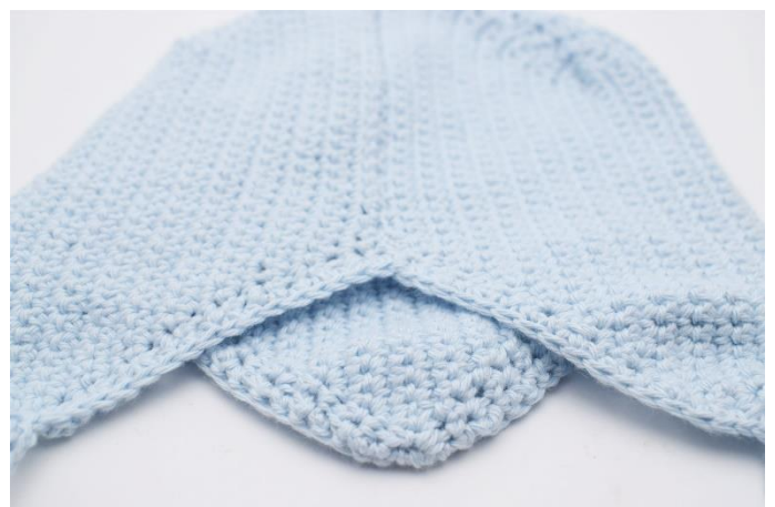
6. Hækl fm langs kanten på huen til du er hele vejen rundt, afslut med 1 km.