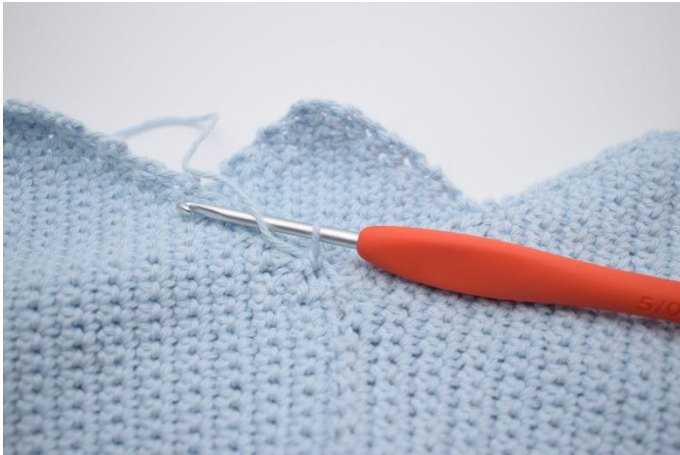
1. Indsæt ved sammensyningen af 1. og 6. del.