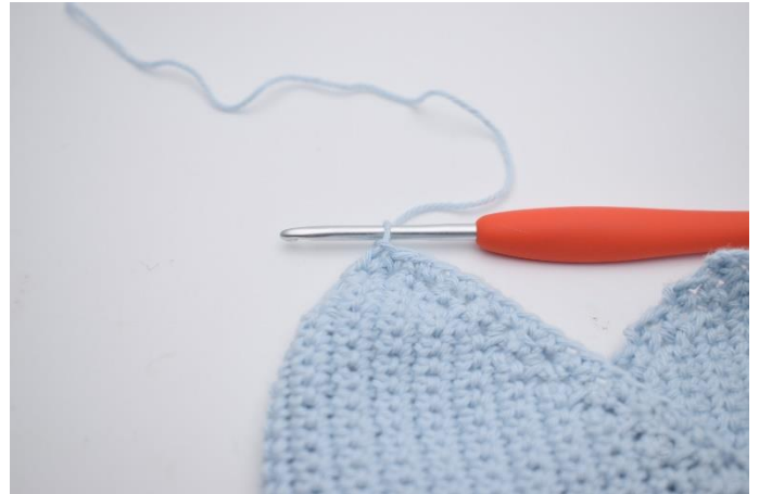
2. Hækl fm i kanten frem til første "spids". Her laves det første bindebånd.