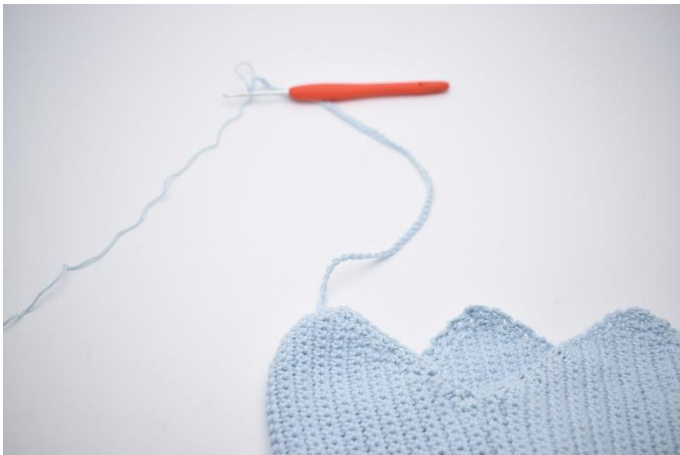
3. Hækl 60 lm.