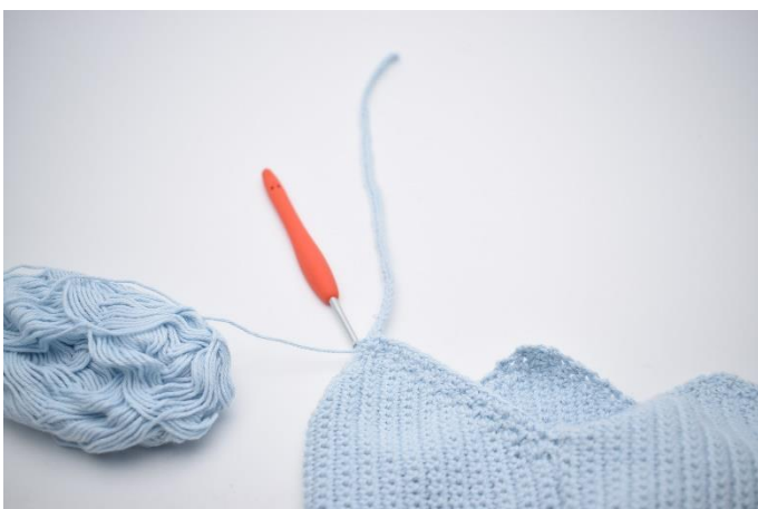
5. Hækl fm langs kanten på huen frem til sidste "spids" inden sammensyningen af 1. og 6. del. Her laves det andet bindebånd. Hækl 60 lm, og hækl km tilbage i alle lm.