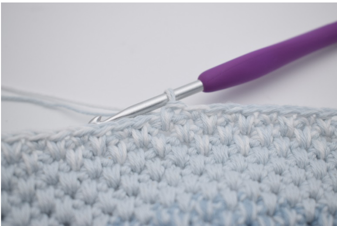
3. Nu hækles der skiftevis 1 dfm og 1 fm i de næste 33m (der hækles 1 dfm i sidste m).