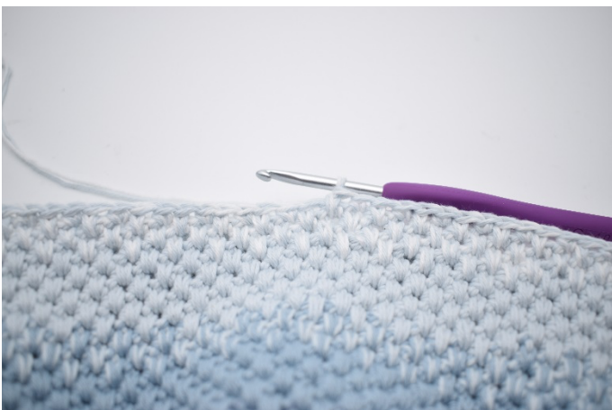
5. Hækl skiftevis fm og dfm i de sidste 16 m.

2. Skift nu farve så der kun hækles med farve 4. Hækl skiftevis 1 fm og 1 dfm i de næste 16 m. Lav 18 lm og spring over de 18 km. Nu hækles der skiftevis 1 fm og 1 dfm i de næste 33 m (der hækles 1 fm i sidste m). Lav 18 lm, og spring over de 18 km. Hækl skiftevis dfm og fm i de sidste 16 m.