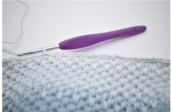
2. Hækl km i de næste 18 m.