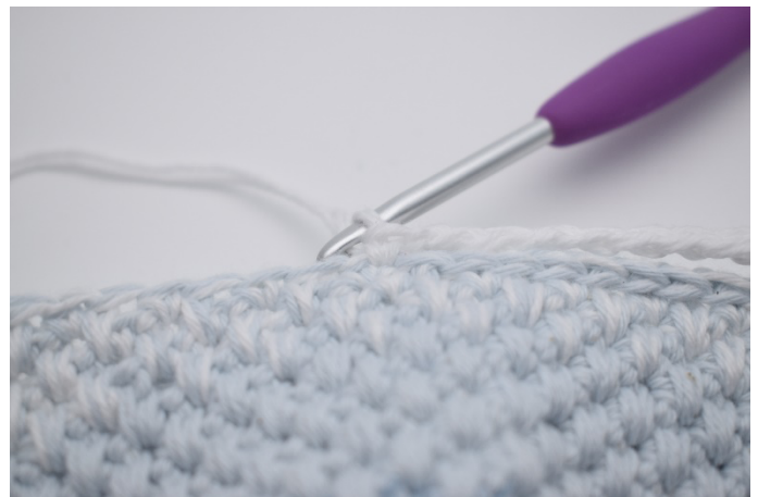
6. og spring over de 18 km.