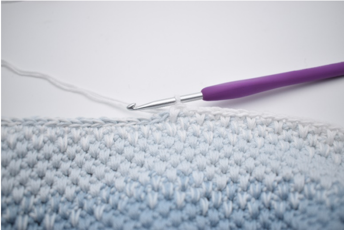
1. Hækl skiftevis 1 fm og 1 dfm i de næste 16 m.