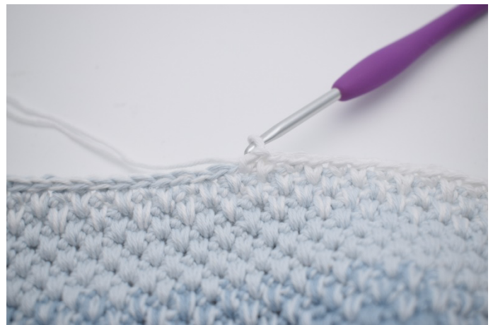
4. Nu hækles der skiftevis 1 fm og 1 dfm i de næste 33 m. (Der hækles 1 fm i sidste m.)