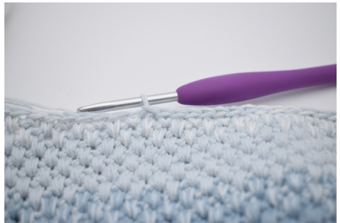
4. I de efterfølgende 18 m hækles der km.