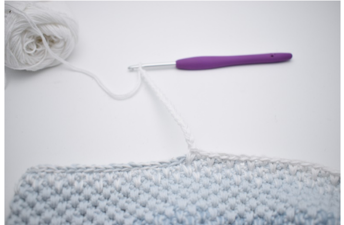
2. Lav 18 lm.