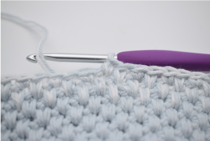
1. Hækl skiftevis 1 dfm og 1 fm i de næste 16 m.