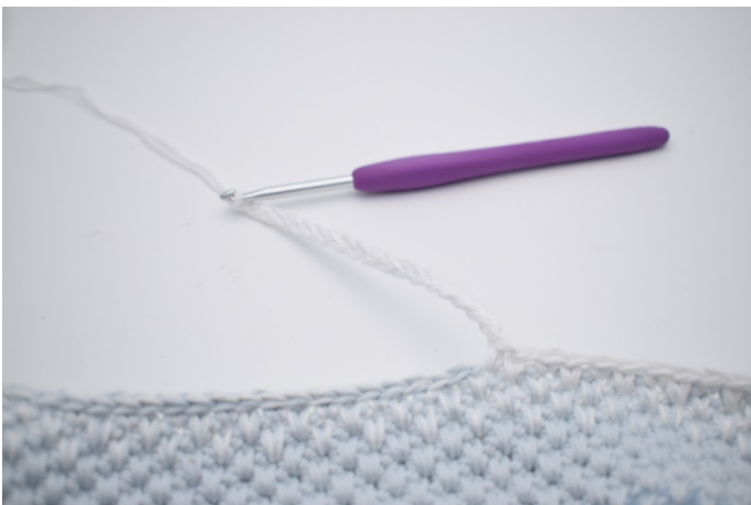
5. Lav 18 lm,