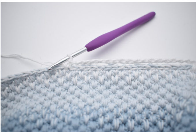
3. Spring over de 18 km.