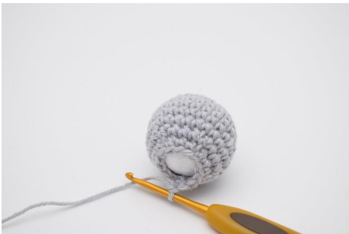
3. Der hækles nu videre omkring den.