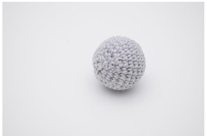
4. Sy hullet sammen, og hæft enden.