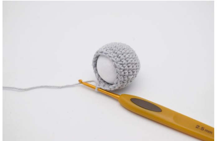
2. sættes kuglen i.