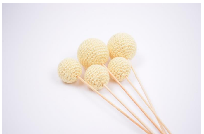
6. De er nu klar til at dekorere dit hjem 😊