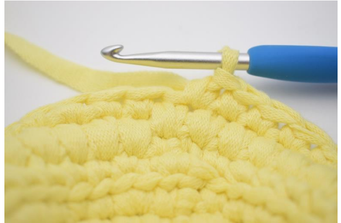
10. Nu hækles 1 omgang fm som normalt.