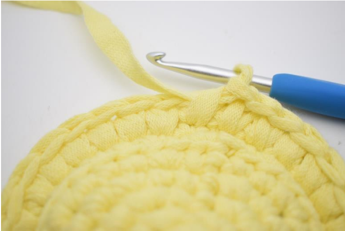
9. Sådan gentages omgangen rundt med dfm.