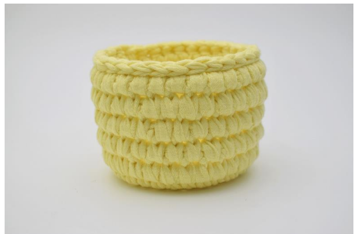
14. Afslut med 1 omgang km. Klip garnet og hæft ender.