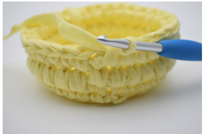
12. Gentag med dfm omgangen rundt.