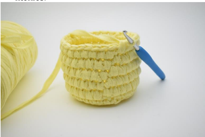
13. Gentag skiftevis omgangene til du har i alt 5 omgange med dfm.