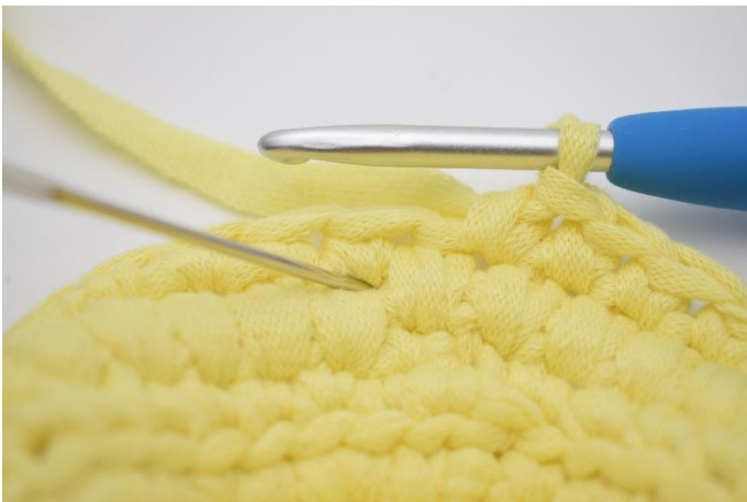
11. Nu hækles der igen en omgang med dfm. Nålen her markerer hvor din næste dfm skal hækles.