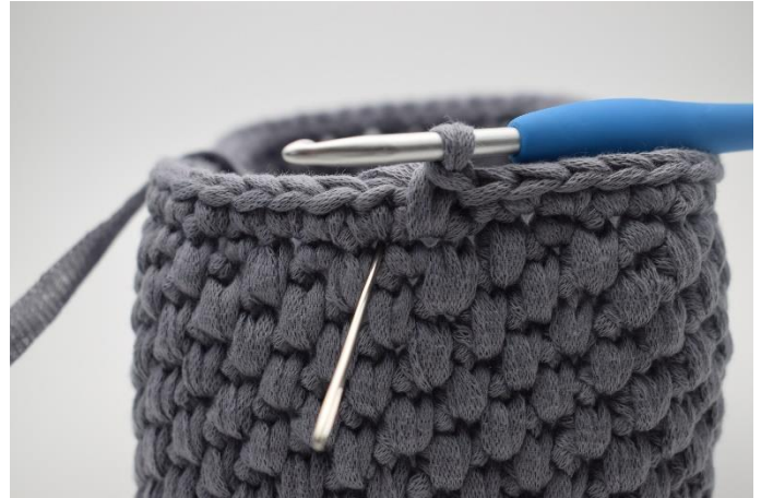
4. Nålen her markerer hvor din næste dfm skal hækles.