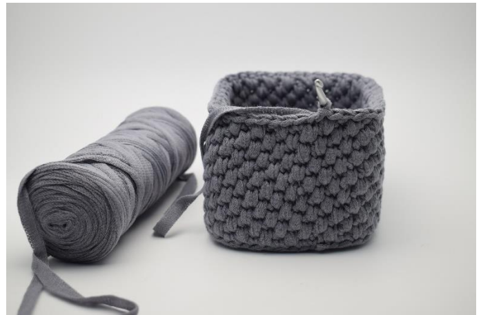
8. Gentag disse 2 omgange i alt 6 gange eller til du har den ønskede højde på din kurv