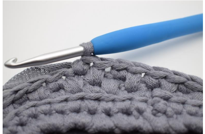
6. Hækl en fm i næste.