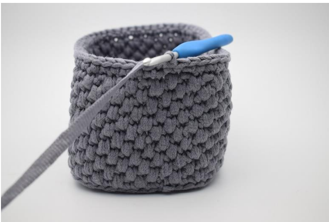
1. Lav 1 lm. Hækl 1 fm hele vejen rundt, og afslut med 1 km.