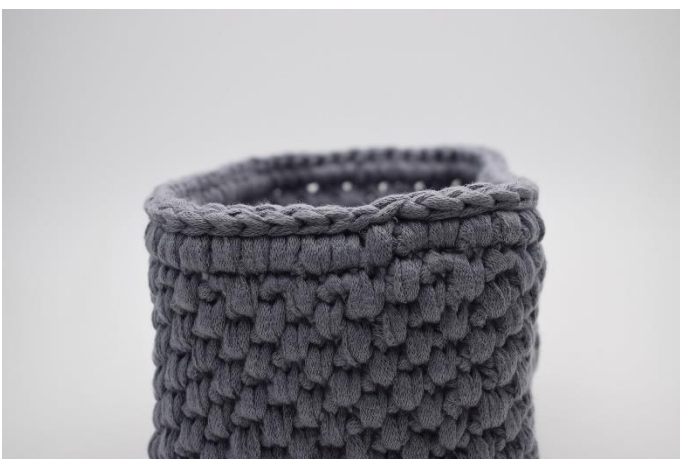
7. Afslut med 1 omgang km.