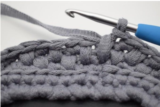
7. Gentag omgangen rundt og afslut med 1 dfm.