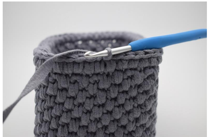
6. Gentag hele vejen rundt og afslut med 1 km.