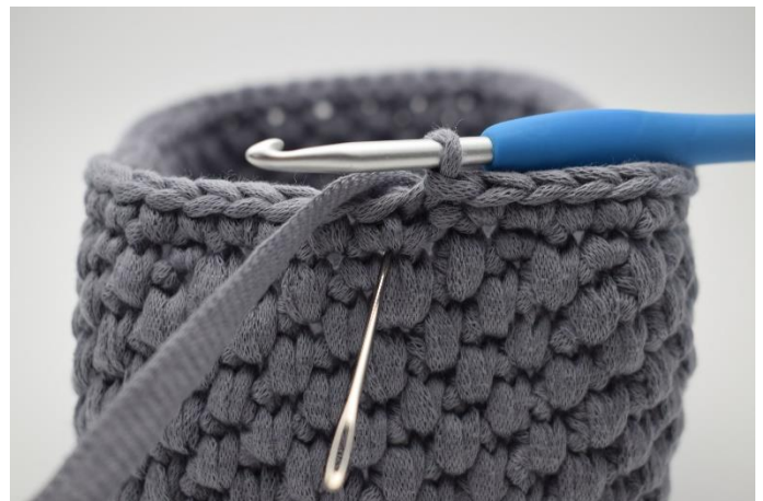
2. Lav 1 lm. Nu hækles der dfm omgangen rundt. Nålen her markerer hvor din første dfm skal hækles.