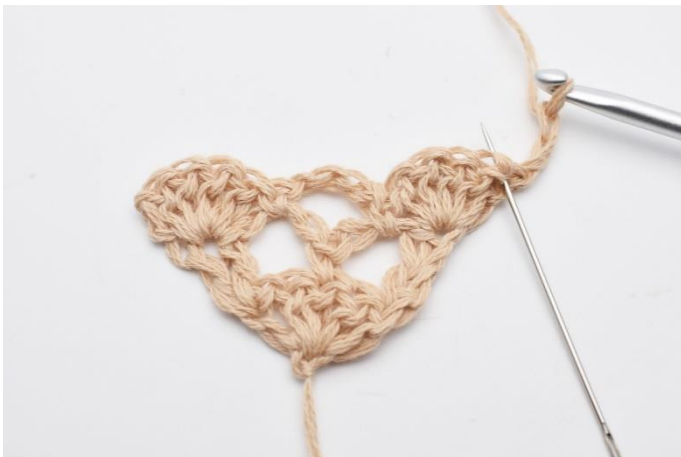
1. Vend arbejdet med 3 lm. I første maske, (den nålen her markerer)