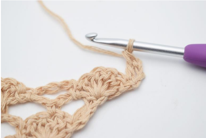
3. Hækles 1 stgm.