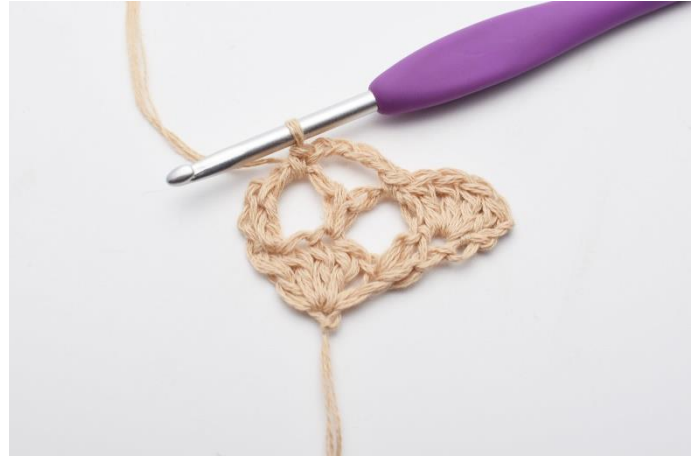
8. hækles 1 fm.