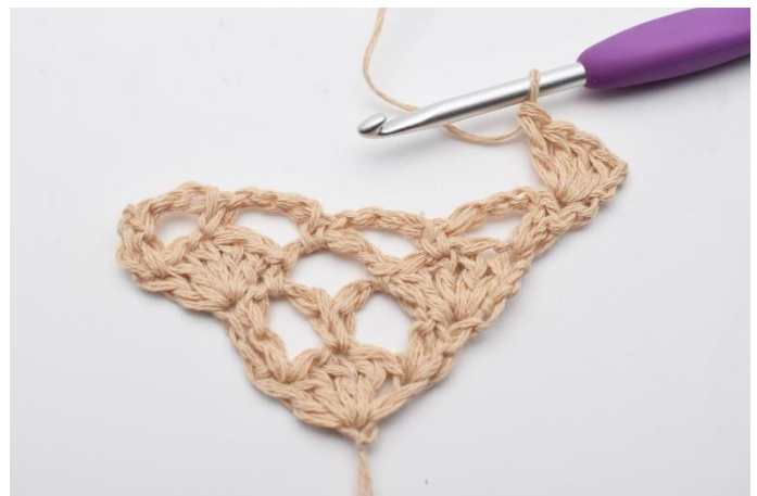
2. hækles 4 stgm. Der er nu dannet 1 vifte med 5 stgm hvor den første stgm er erstattet af lm.