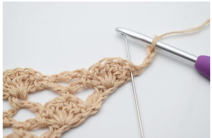
2. I første maske, (den som nålen her markerer)