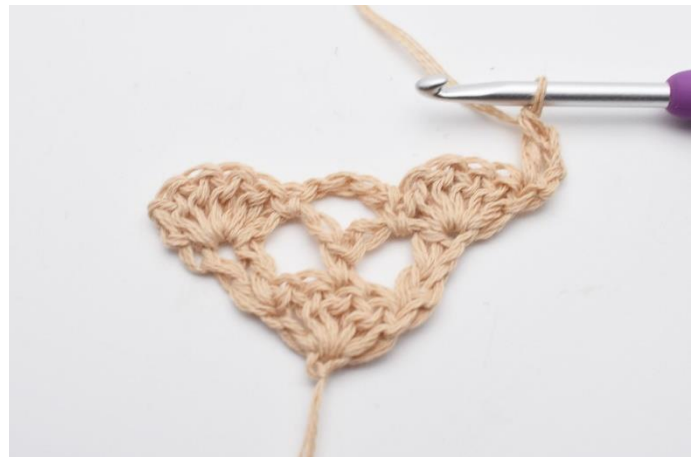
2. hækles 1 stgm.