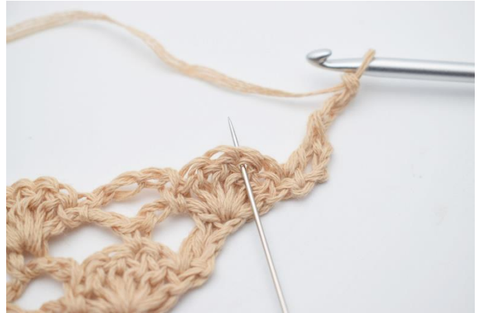
4. Lav 3 lm. I den midterste stgm i viften under hækles