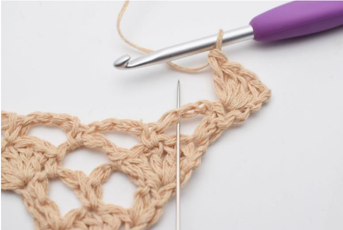
3. I lm-buen under hækles 1 fm.