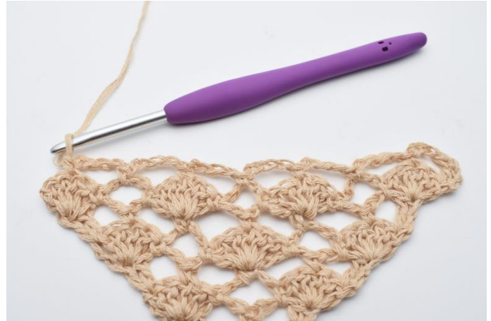
10. Gentag dette til sidste vifte på rækken.