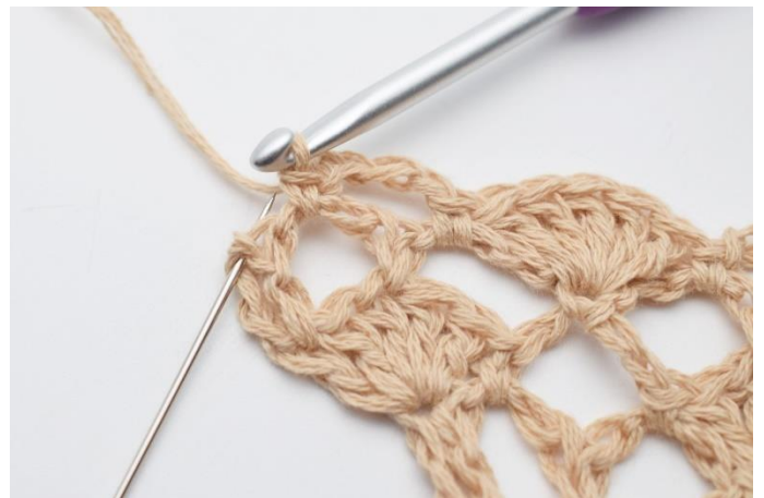
14. I sidste maske, (den som nålen her markerer)