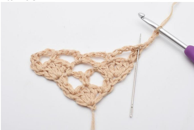
1. Vend arbejdet med 3 lm. I den første maske, (den som nålen her markerer)