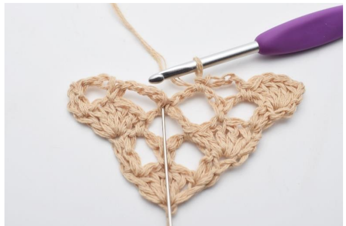
8. Nu hækles der 1 vifte (5 stgm) i fm mellem de 2 næste lm-buer. (Nålen her markerer den fm din vifte skal hækles i)