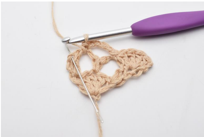
9. I den sidste af de 2 stgm under,