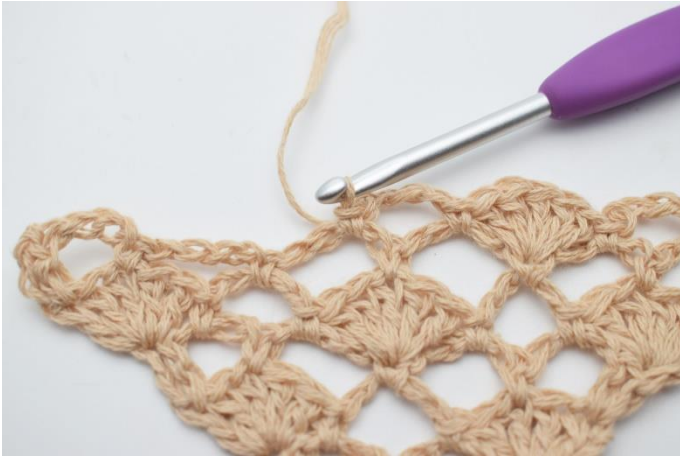
13. 1 fm.