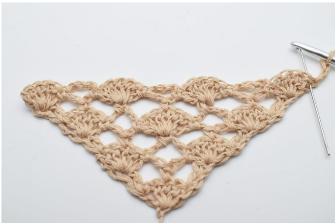
1. Vend arbejdet med 3 lm.