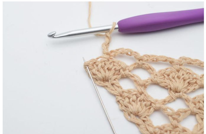
14. Lav 3 lm og i den sidste maske, (den som nålen her markerer)