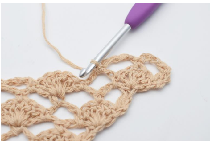
7. 1 fm.