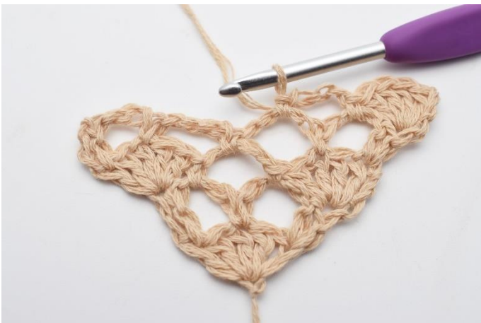
7. hækles 1 fm.