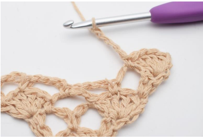
5. Lav 4 lm.