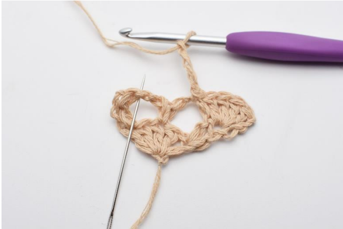
7. I næste lm-bue,