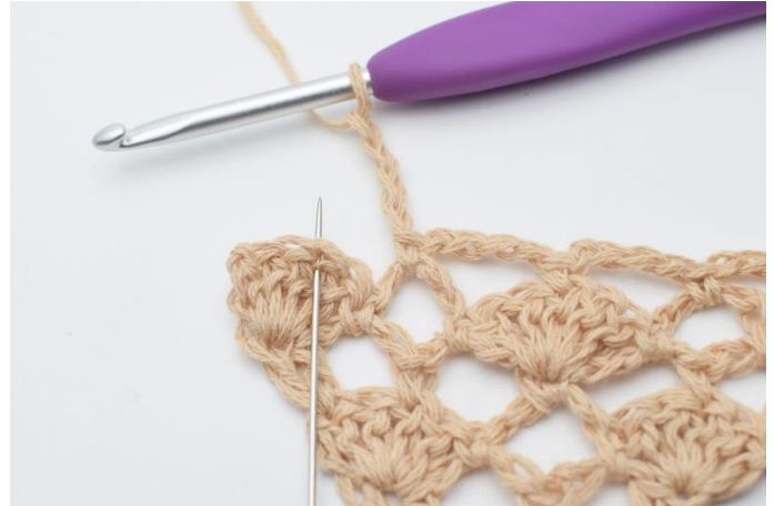
12. Lav 4 lm, og hæk 1 fm i den midterste stgm i viften under. (nålen her markerer den midterste maske)