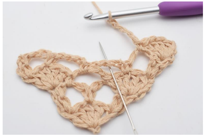
6. I næste lm-bue,