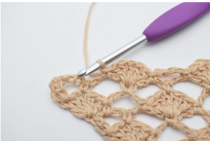
17. 1 fm.