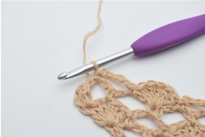
19. 1 fm.