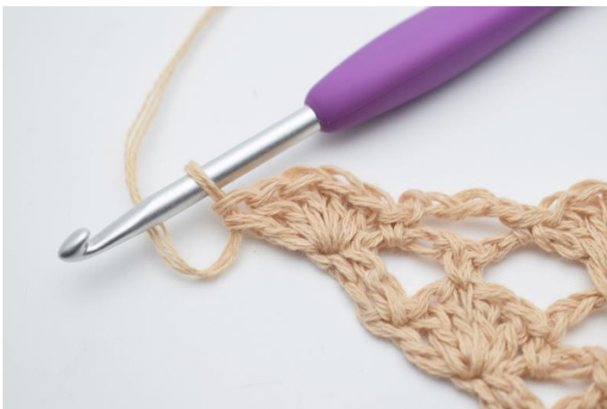
21. hækles 1 vifte (5 stgm)