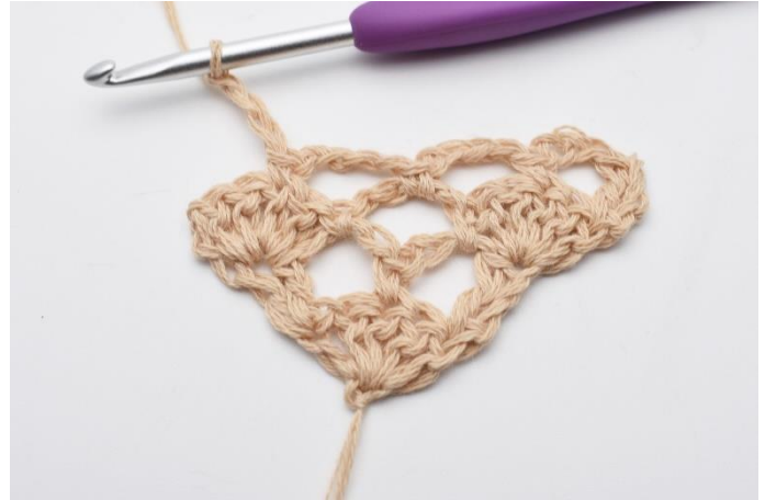
10. Lav 3 lm.