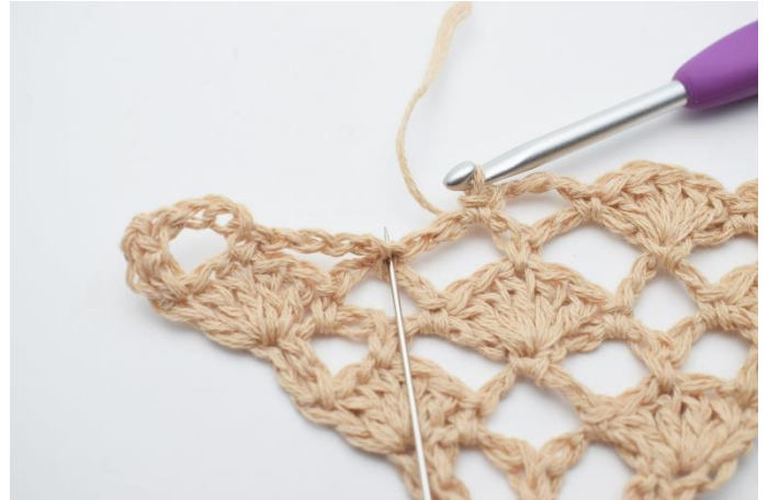
14. Nu hækles der 1 vifte (5 stgm) i fm mellem de 2 næste lm-buer. (Nålen her markerer den fm din vifte skal hækles i)