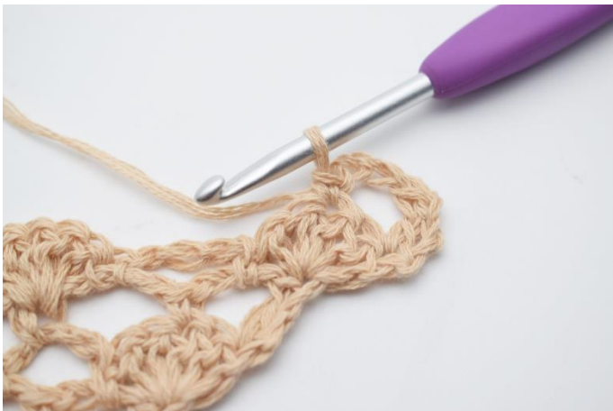
5. 1 fm.