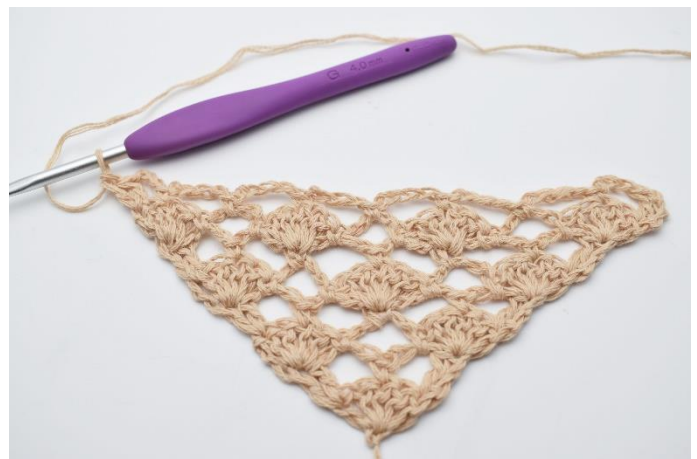
12. hækles 2 stgm.

Fortsæt sjalet/mønsteret ved at gentage række 7 & 8 skiftevis til nøglen er brugt.