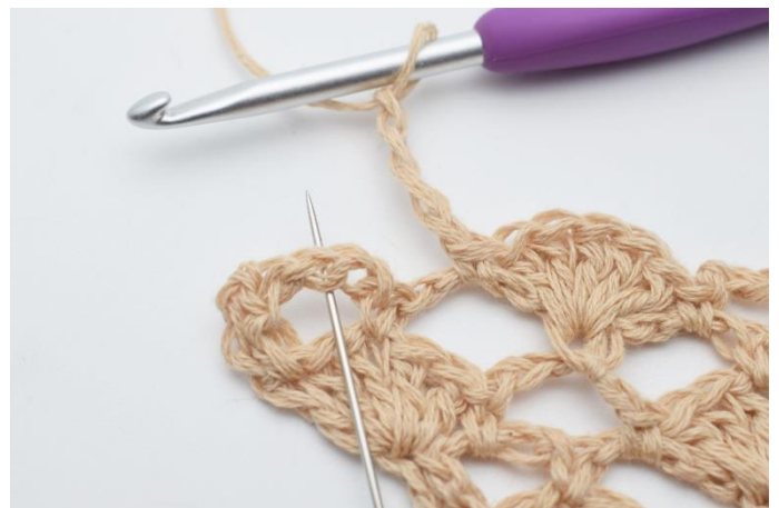
18. Lav 4 lm. I næste lm-bue hækles