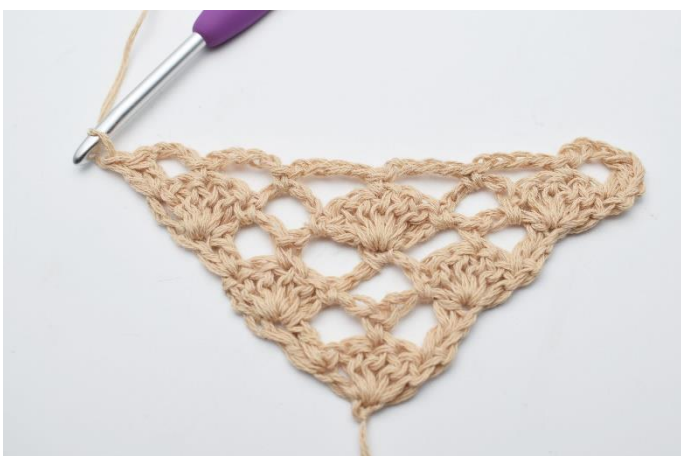
15. hækles 2 stgm.