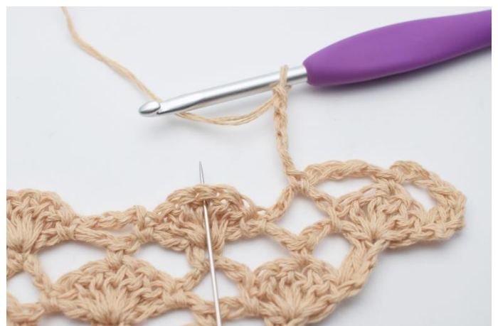
8. Lav 4 lm og i den midterste stgm i viften under hækles