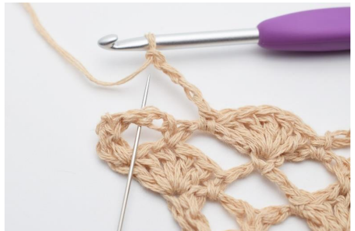
12. Lav 4 lm, og hæk 1 fm i næste lm-bue.