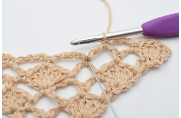
8. Nu hækles der 1 vifte (5 stgm) i fm mellem de 2 næste lm-buer. (Nålen her markerer den fm din vifte skal hækles i)