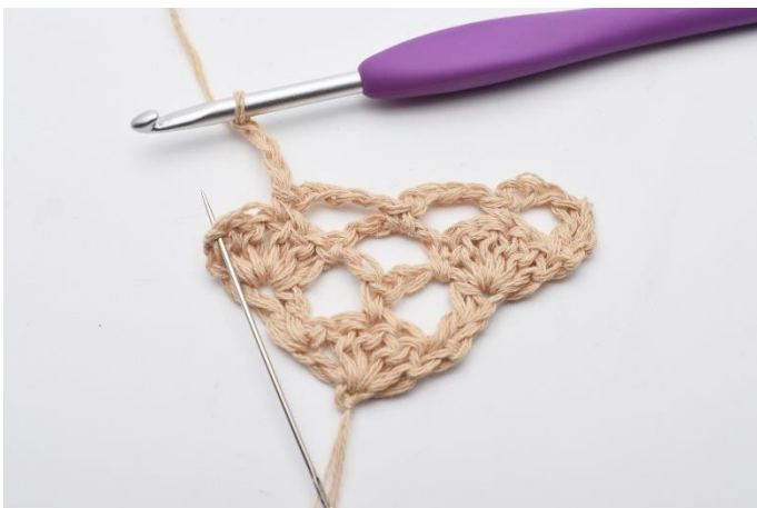
11. I den sidste maske hækles 2 stgm.