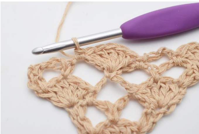
11. 1 fm.