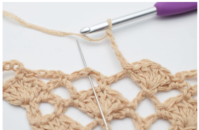
12. Lav 4 lm. I næste lm-bue hækles