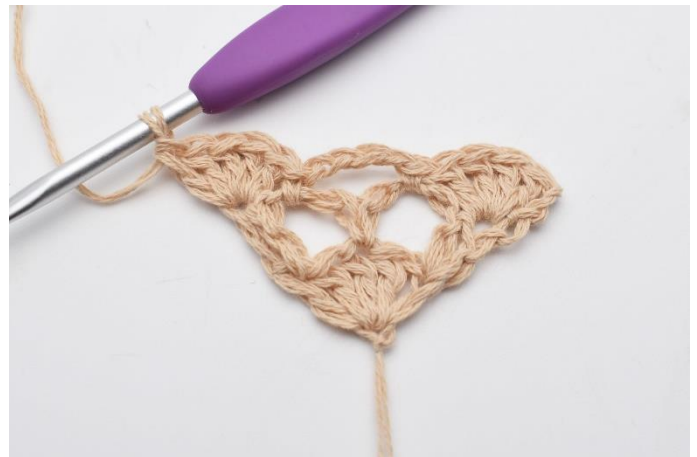
10. hækles 1 vifte (5 stgm).