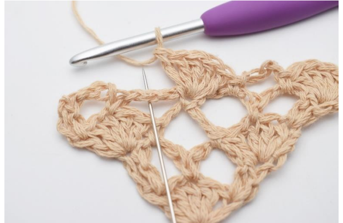
10. I næste lm-bue hækles