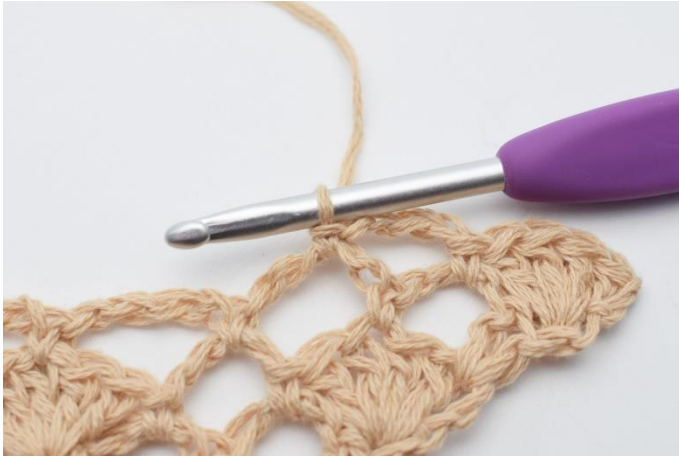
7. 1 fm.