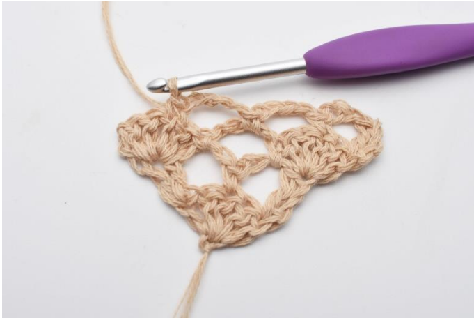
9. hækles 1 fm.