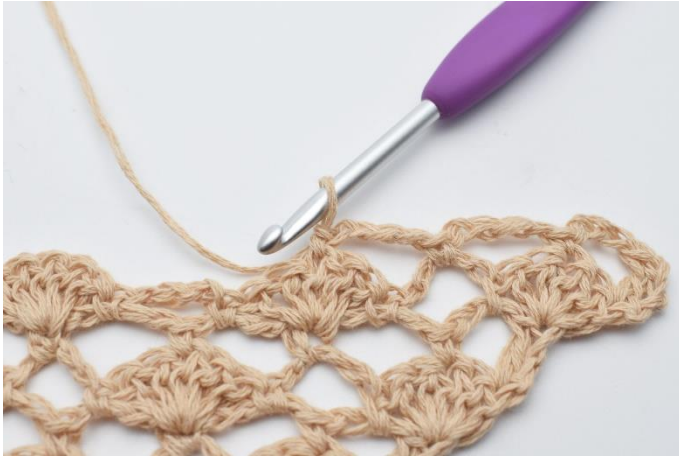
9. 1 fm.