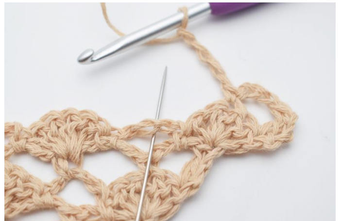
6. Lav 4 lm. I den næste lm-bue hækles