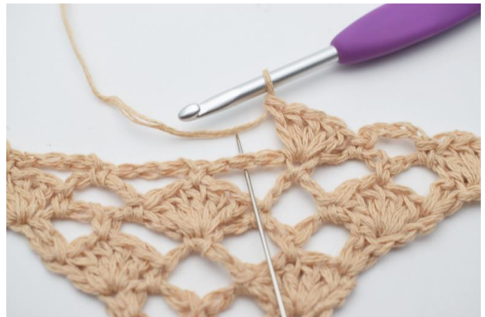
10. I næste lm-bue hækles