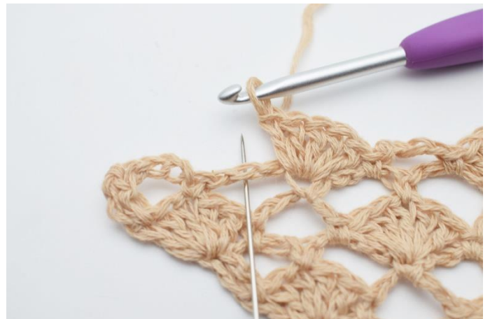
16. I næste lm-bue hækles