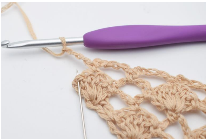
11. Lav 3 lm, og i sidste maske (den som nålen her markerer)