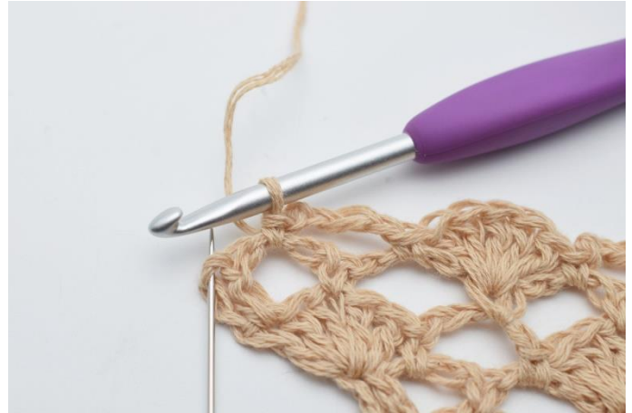
20. I sidste maske, (den som nålen her markerer)