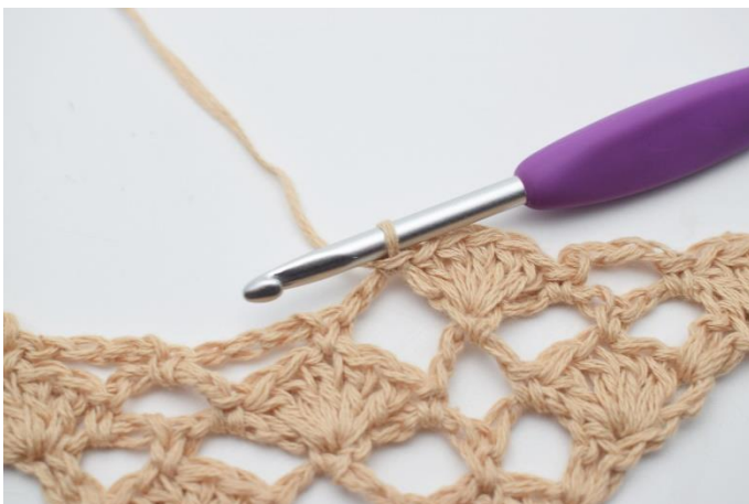
11. 1 fm.