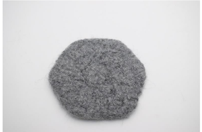
Efter filtning Mål ca. 10x11 cm