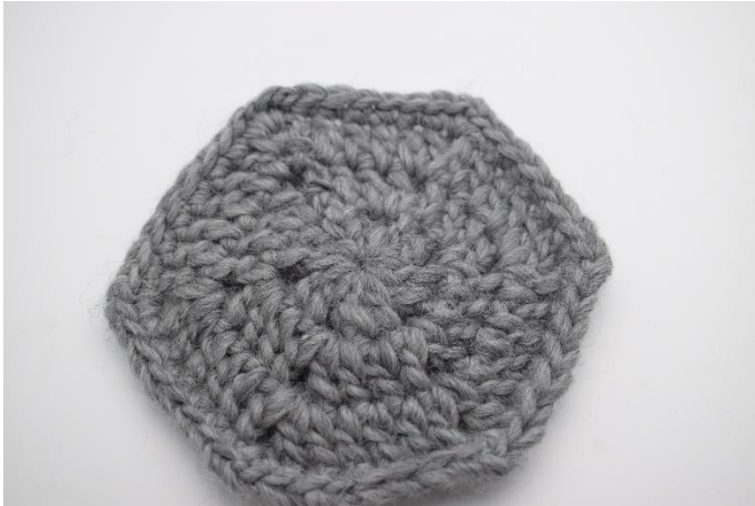
Sådan ser den ud inden filtning. Mål ca. 14x15 cm