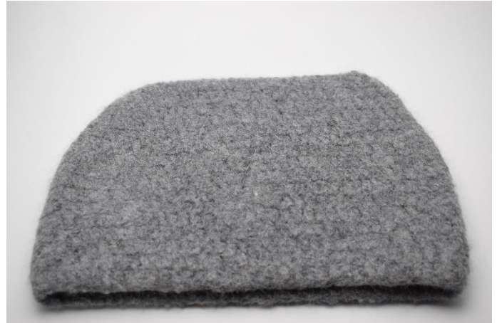
Efter filtning. Mål ca. 33x24cm