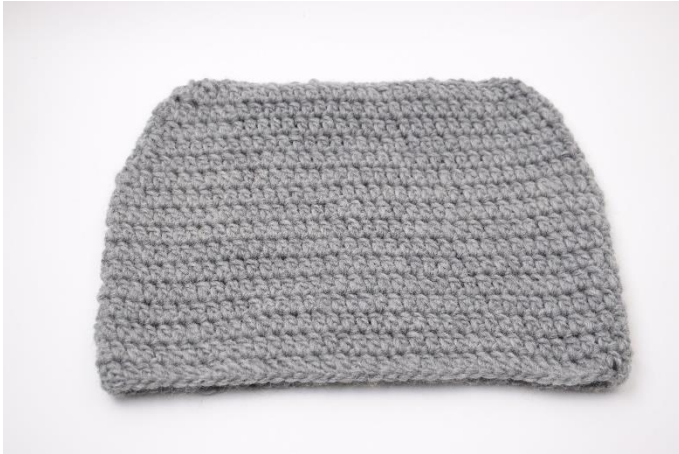
Sådan ser den ud inden filtning. Mål ca. 43x30 cm

Filtningen sker ved et alm vaskeprogram ved 40 grader i vaskemaskinen. – IKKE et kvik program eller lynvask. Vask evt. med et håndklæde eller et par jeans. Er den ikke filtet helt nok, kan man med fordel give den en tur mere. Resultat af filtning kan variere fra vaskemaskine til vaskemaskine, og derfor kan det være en god ide at lave en lille prøve og teste inden.