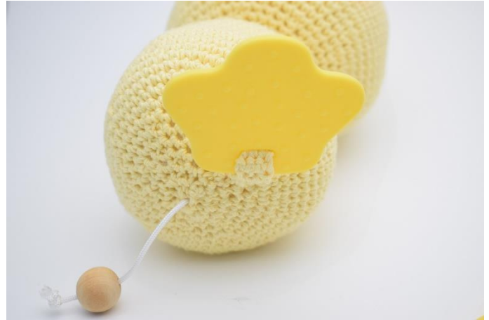
4. og sy den fast under anden.