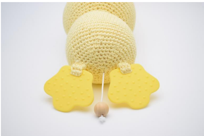
5. Gentag dette ved begge fødder.