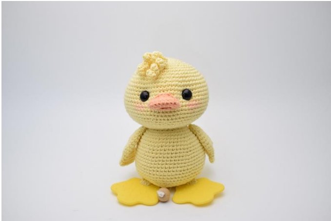
1. Sy krøllerne fast øverst på hovedet.