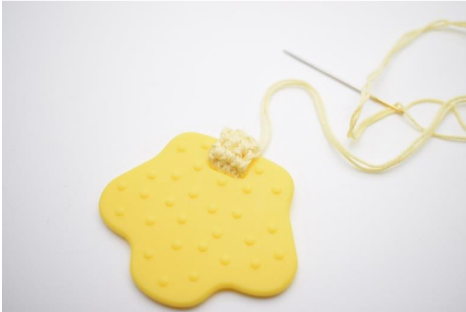
3. Sy stykket sammen,