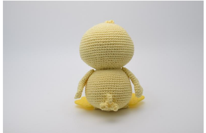
2. Samt bagpå.