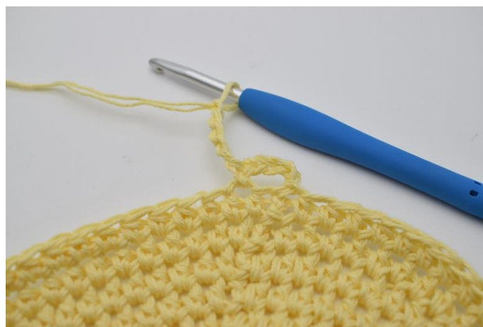
4. Lav 5 lm.