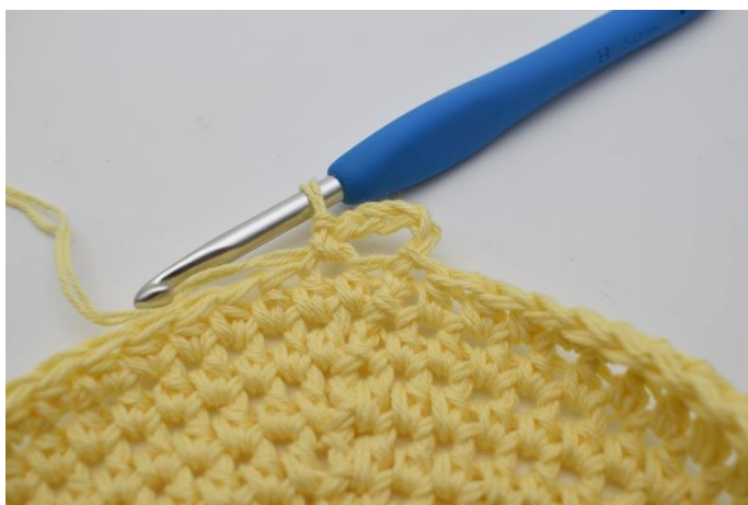
3. Spring 1 m over, og hækl 1 fm i næste.