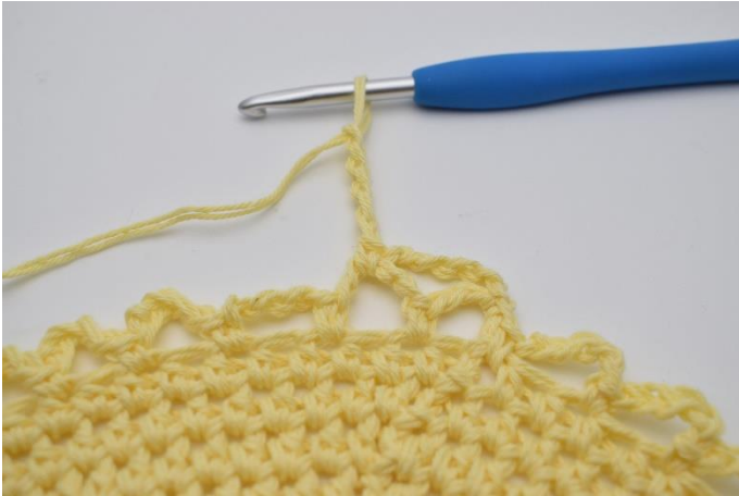
11. Lav 5 lm.