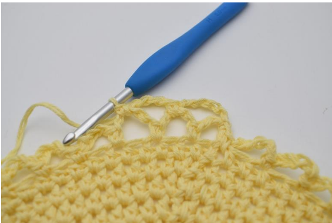
13. Hækles 1 fm.