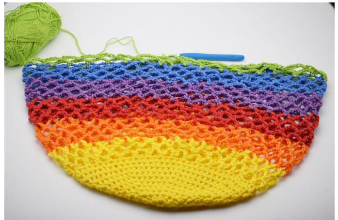
16. Her er alle 21 omgange hæklet.