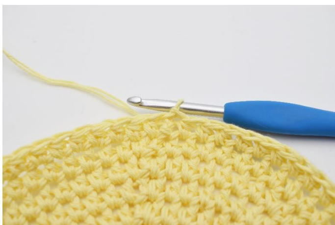
1. Her er bunden netop afsluttet med 1 km.