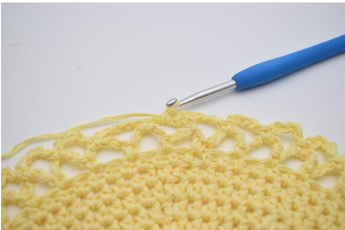
15. Så er du klar til at hækles endnu en omgang. Nu gentages omgangene med farveskift som beskrevet længere oppe i opskriften.