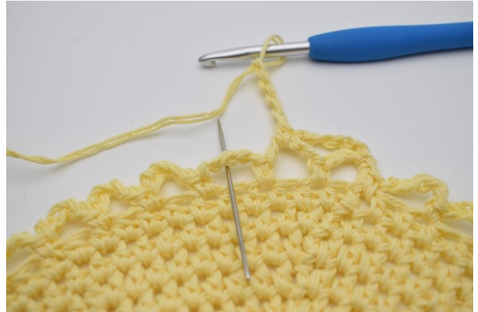
12. I næste lm- bue. (Nålen markerer den her)