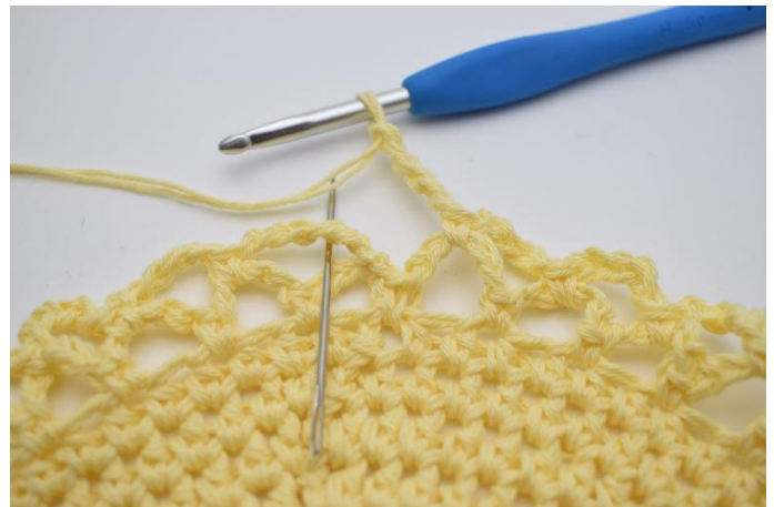
14. Sådan gentagen omgangen rundt. Omgangen afsluttes med 1 fm i den første lm-bue som blev dannet på denne omgang.