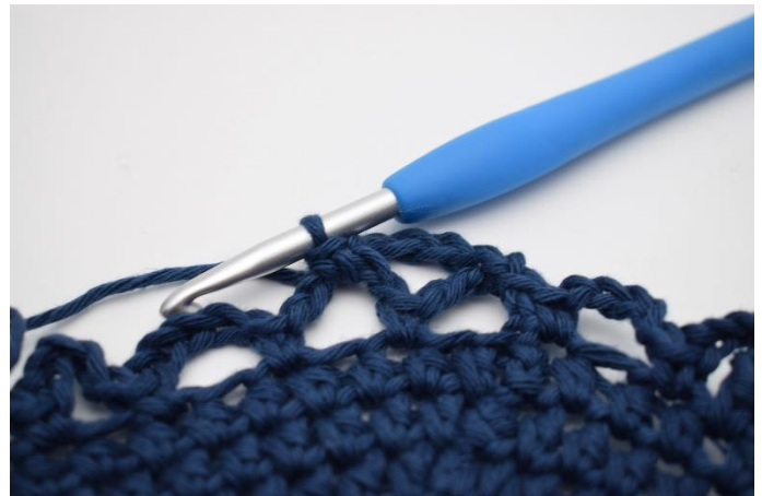
10. Hækles 1 fm.