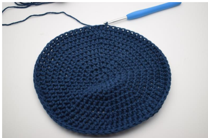
1. Her er bunden netop afsluttet med 1 km.