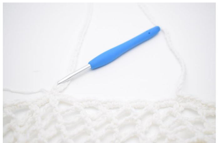
6. Hæk 1 fm i næste maske.