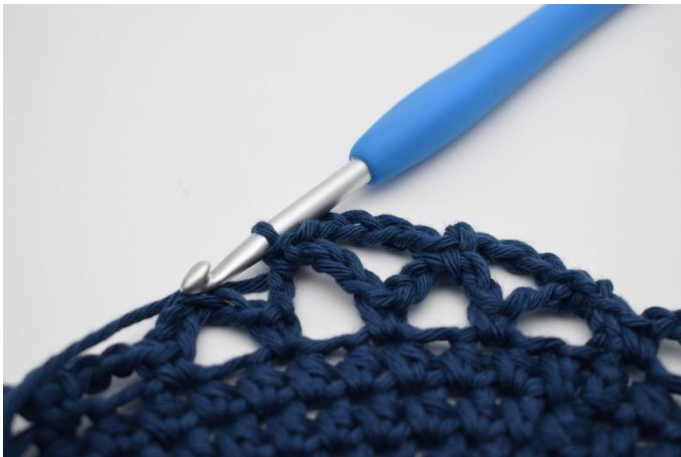
13. Hækles 1 fm.