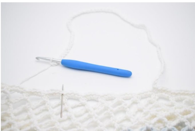
5. Nu hækles der omgangen hvor hanken dannes. Lav 1 lm, og hæk 1 fm i de næste 52 m. Lav 75 lm. Spring 20 masker over,