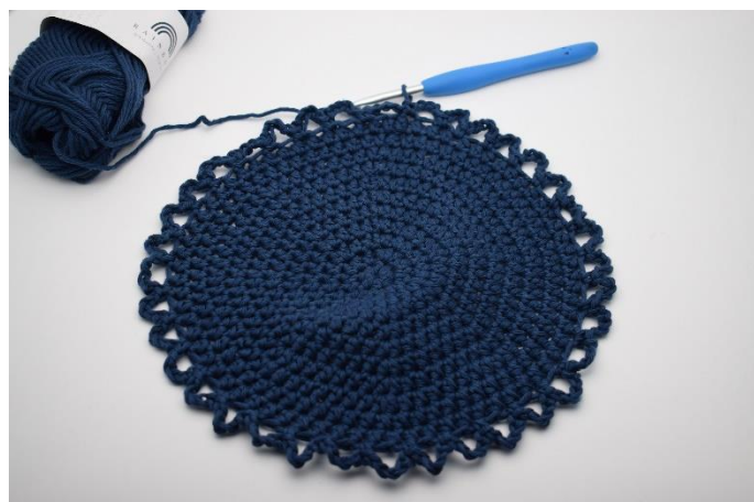
6. Sådan gentages omgangen rundt, så du har 36 lm-buer rundt om din bund.