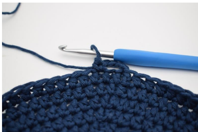
3. Spring 1 m over, og hæk 1 fm i næste.