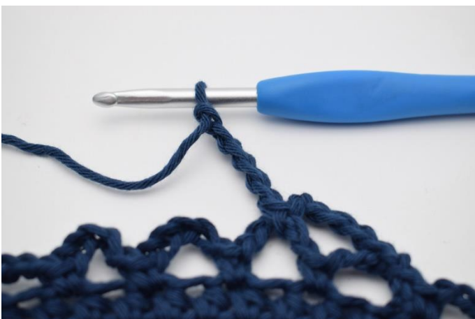
11. Lav 5 lm.