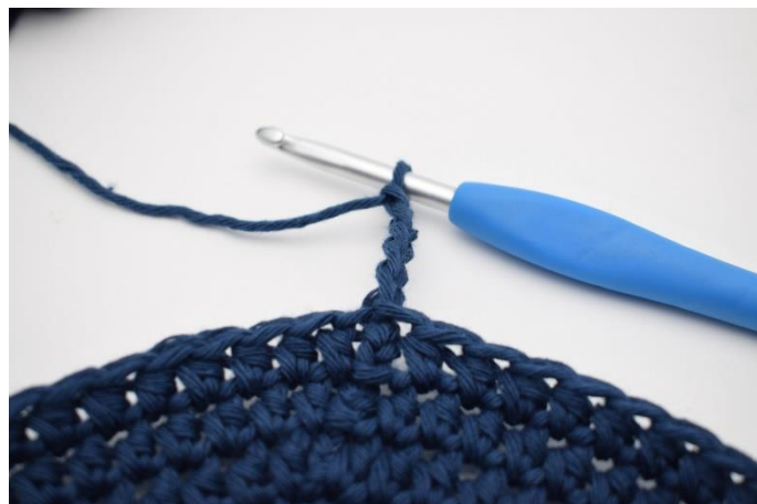
2. Lav 5 lm.