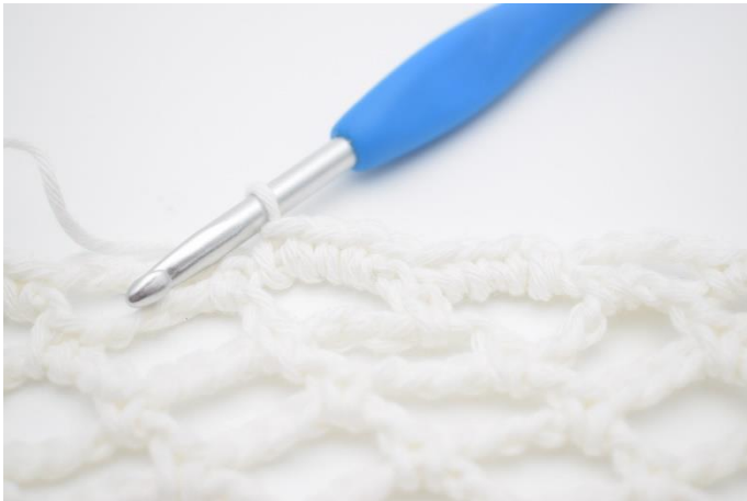
3. Hæk 4 fm i næste lm-bue. Dette gentages hele vejen rundt.