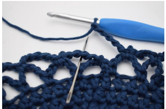
14. Sådan gentagen omgangen rundt. Omgangen afsluttes med 1 fm i den første lm-bue som blev dannet på denne omgang.