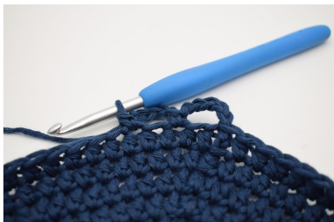
5. Spring 1 m over, og hæk 1 fm i næste.