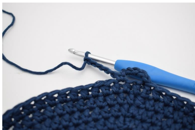
4. Lav 5 lm.