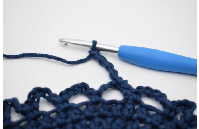
8. Lav 5 lm.