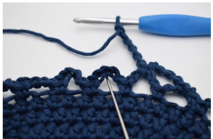
12. I næste lm- bue. (Nålen markerer den her)