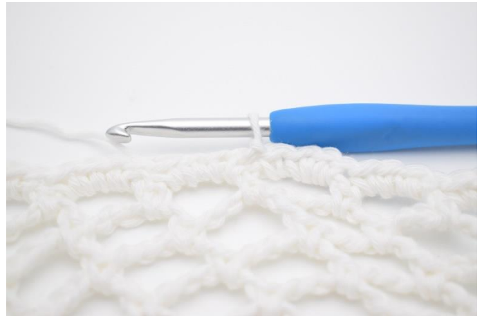
4. Afslut med 1 km.