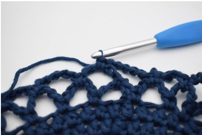
15. Gentag nu omgangene og skift farve som beskrevet i opskriften