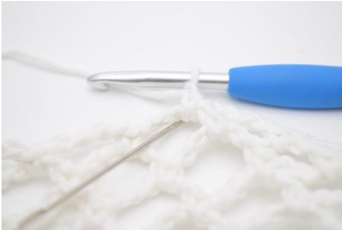
1. Lav 1 lm, og hæk 4 fm i lm-buen.