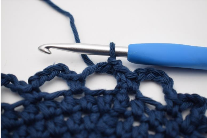
7. Lav 3 km op langs den første lm-bue, så du starter i midten af den.