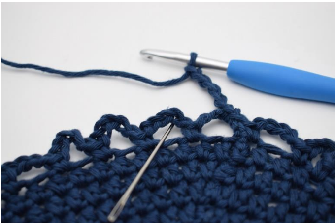
9. I næste lm- bue. (Nålen markerer den her)