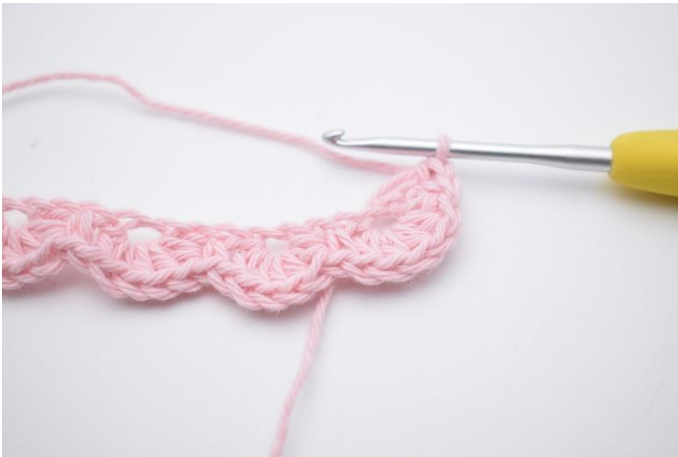
13. Nu hækles der på den anden side af din lm-række. Hæk 1 fm i samme lm som du hækles din sidste fm i.