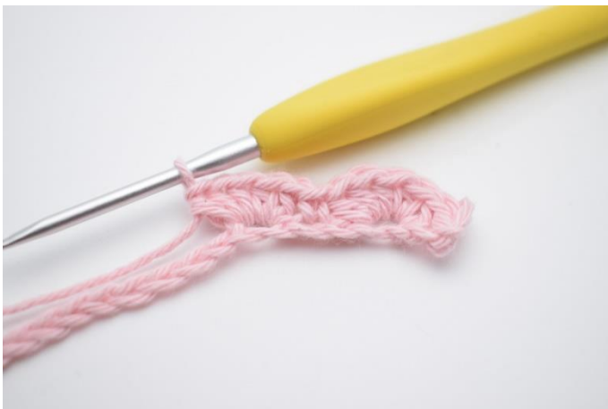
9. hækl 5 hstm i næste lm.