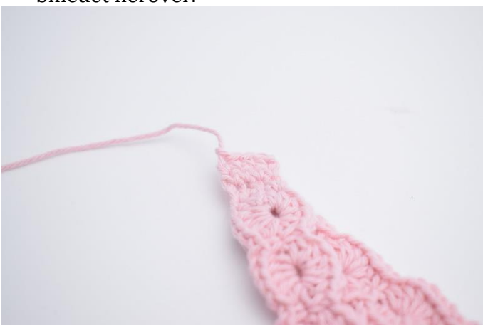
3. Vend med 1 lm, og hækl fm rækken ud. (5) Gentag dette 1 gang mere. Klip garnet og efterlad en lang snor til montering.