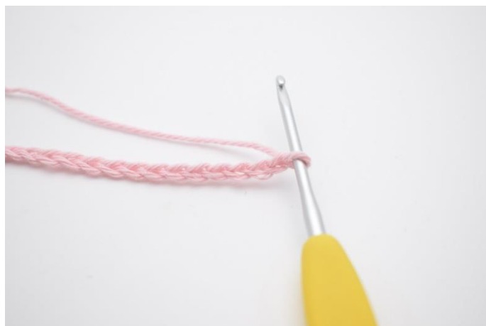
1. Slå dine lm-række op.