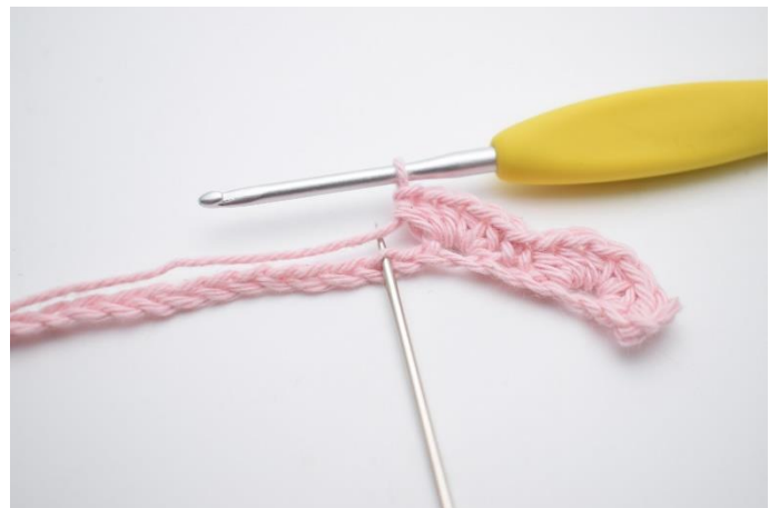
10. Spring 1 lm over,