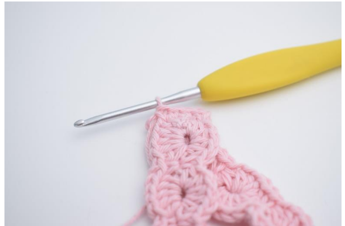
2. Hækl dem nu sammen med 4 fm.