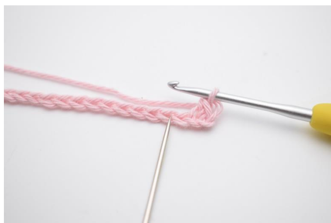
4. Spring i lm over.