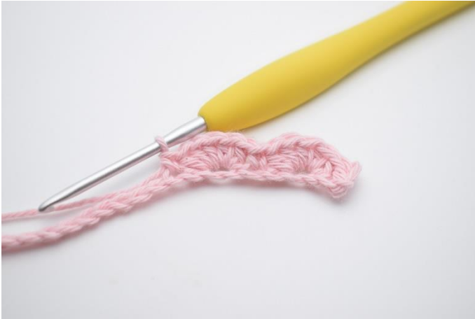
11. hæk 1 fm i næste lm. ”