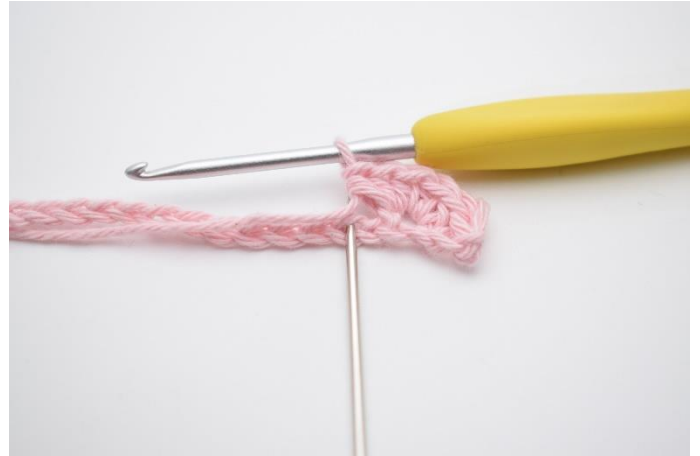
6. Spring 1 lm over,