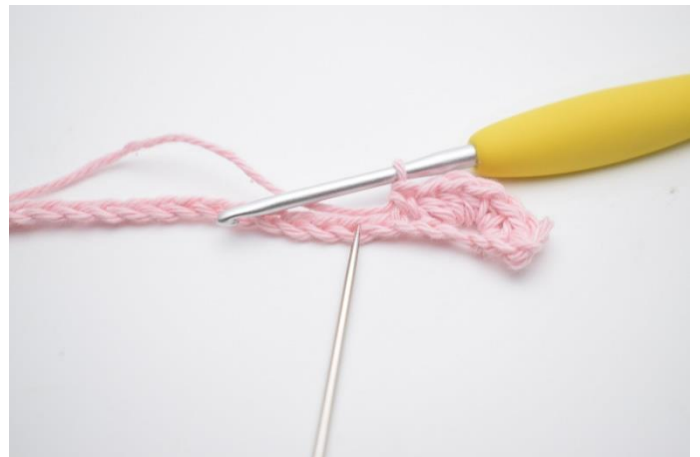
8. "Spring 1 lm over,