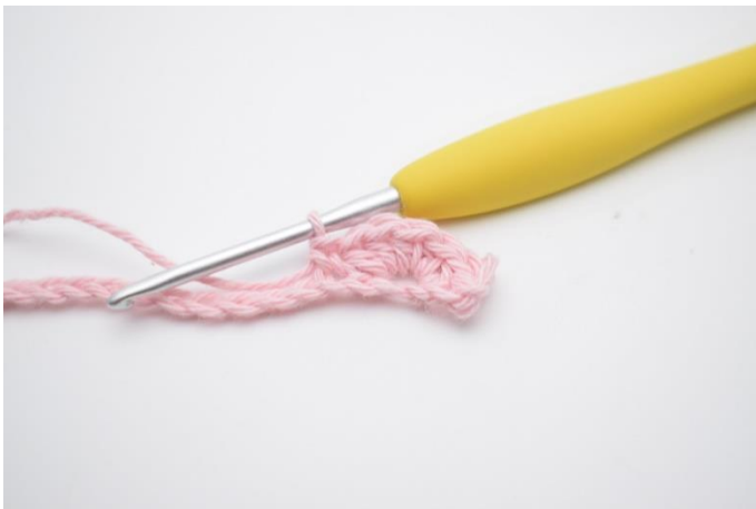
7. hækl 1 fm i næste lm.