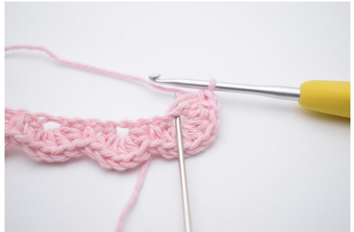
14. ”Spring 1 lm over, og hæk 5 hstm i næste lm (samme lm som der er hæklet 5 hstm i på den anden side af din lm-række),