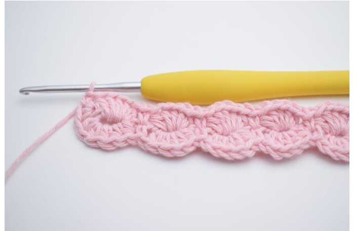
18. Gentag "til" rækken ud. Klip garnet og hæft ender.