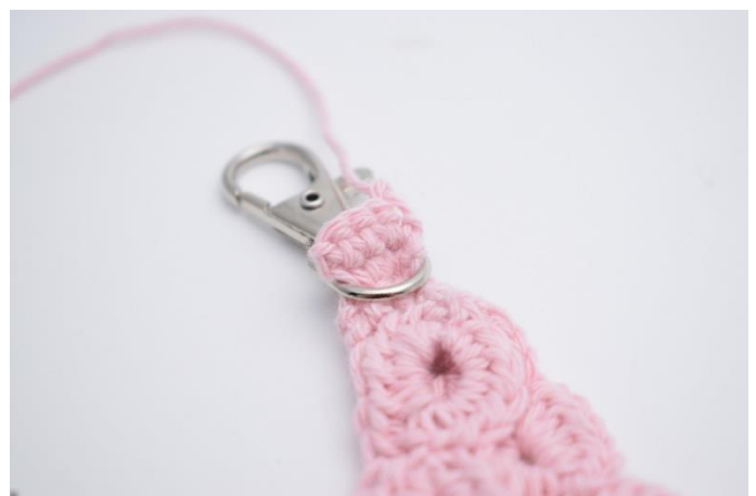
4. Buk nu det lille stykke rundt om ringen på din karabinhage om sy den fast.