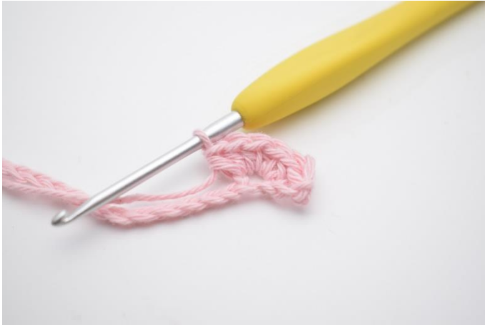
5. Hækl 5 hstm i næste lm.