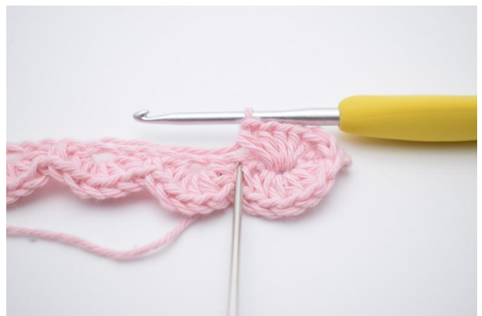
16. Spring 1 lm over, og hæk 1 fm i næste lm (samme lm som der er hæklet 1 fm i på den anden side af din lm-række)”