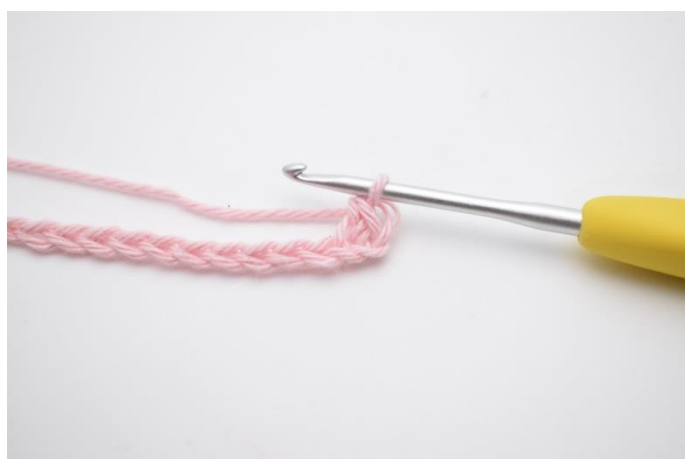
3. hækles 1 fm.