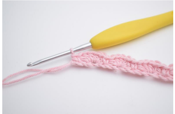
12. Gentag ”til” rækken ud. Du vil nu have 44 ”buer”.