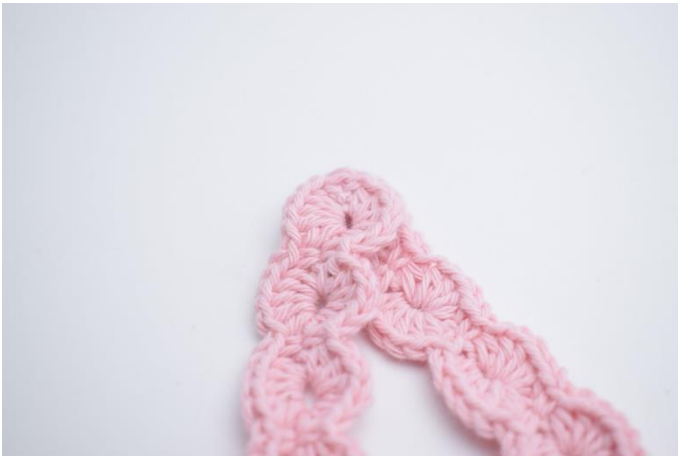
1. Læg enderne ovenpå hinanden som på billedet herover.