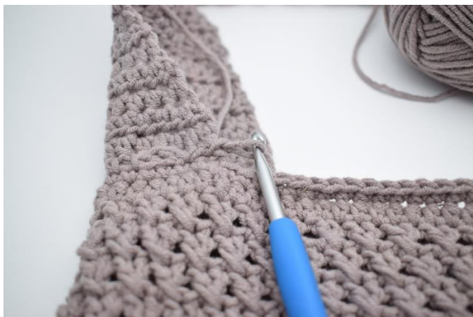
1. Start i venstre side hvor hanken starter.

Hækl nu en fm kant rundt om hanken, og km langs kanten på tasken. Gentag dette på den anden side af hanken/tasken. Hæft ender.