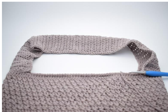
2. Hækl fm langs hele hanken.