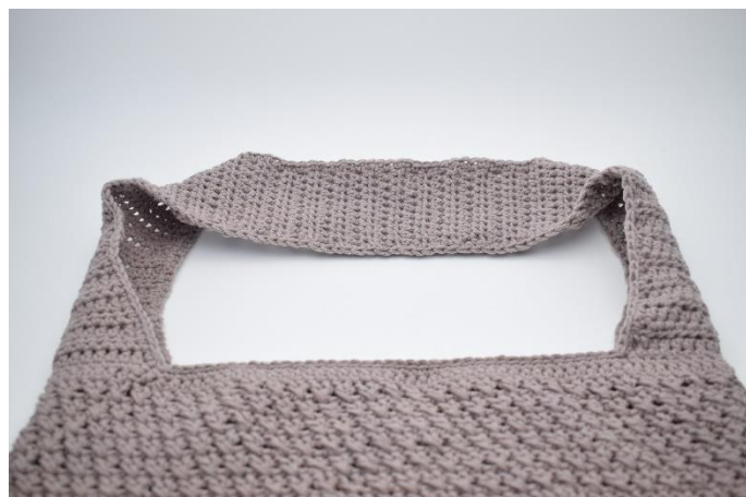
4. Gentag dette på den anden side af tasken.

Har du spørgsmål til opskriften er du velkommen til at skrive til tine@hobbii.dk