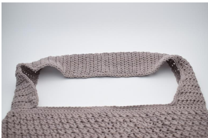
3. Hækl nu km langs taskens kant. Klip garnet og hæft ender.