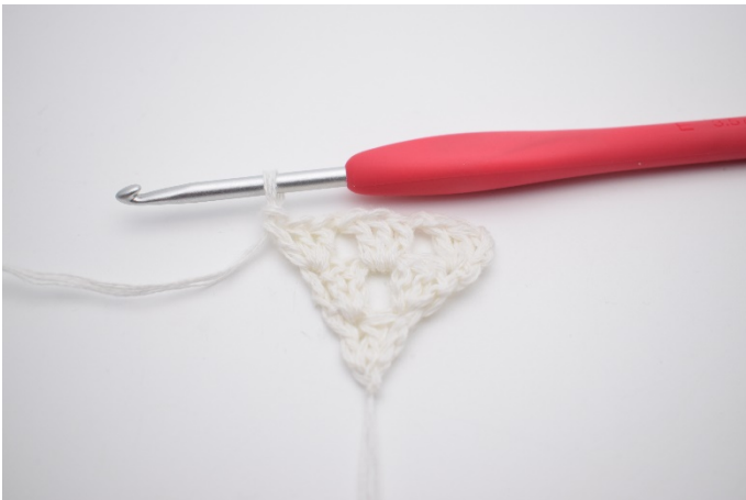
7. Hækl 1 stgm gruppe i sidste m.