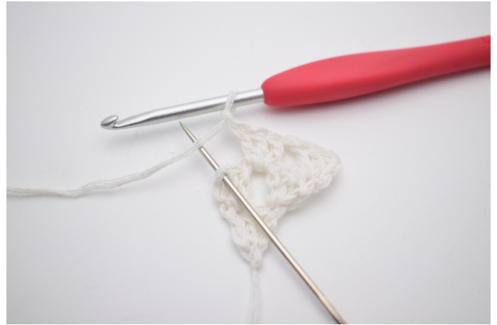
6. Lav 1 lm. Nu hækles der i sidste m som nålen her markerer