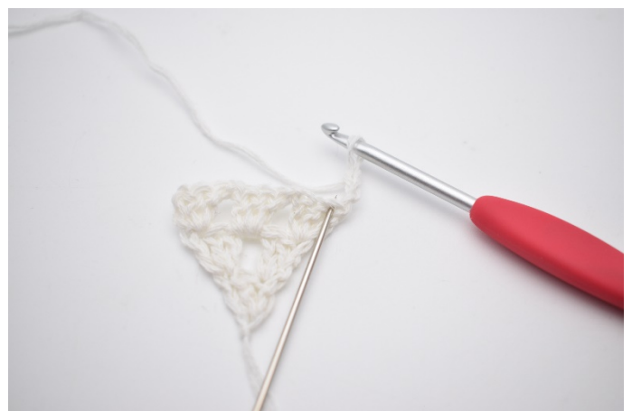
2. I første m, som nålen her markerer,