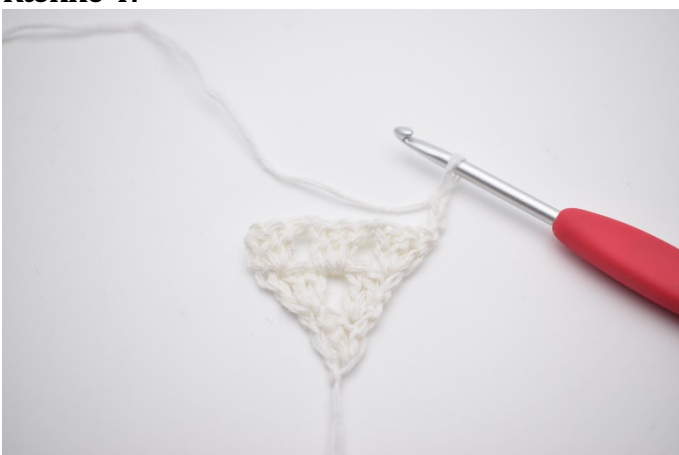
1. Vend dit arbejde med 3 lm (erstatte 1. stgm)