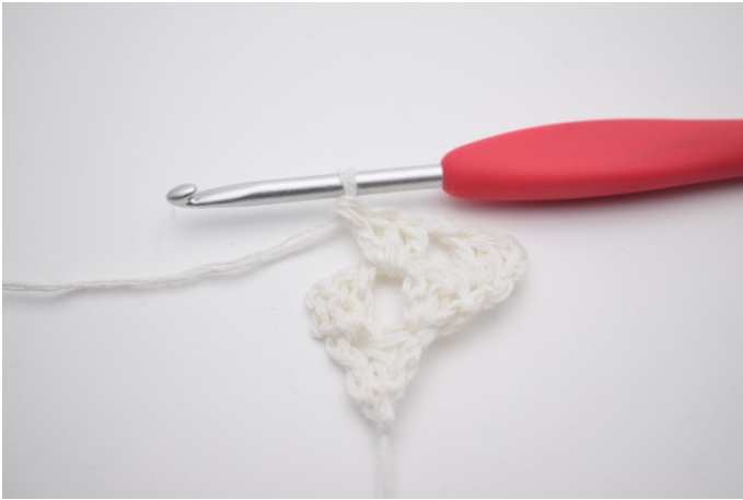
5. Hækl 1 stgm gruppe i lm-mellemrummet.