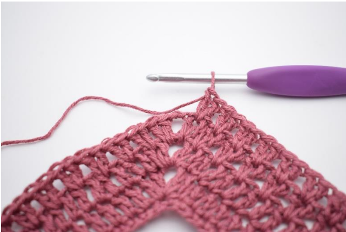
5. Gentag "til" i alt 29 (30) 32 (33) gange.