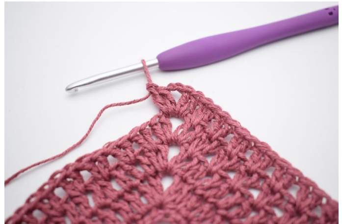
6. Hækl "2 stgm, 2 lm, 2 stgm" i mellemrummet.