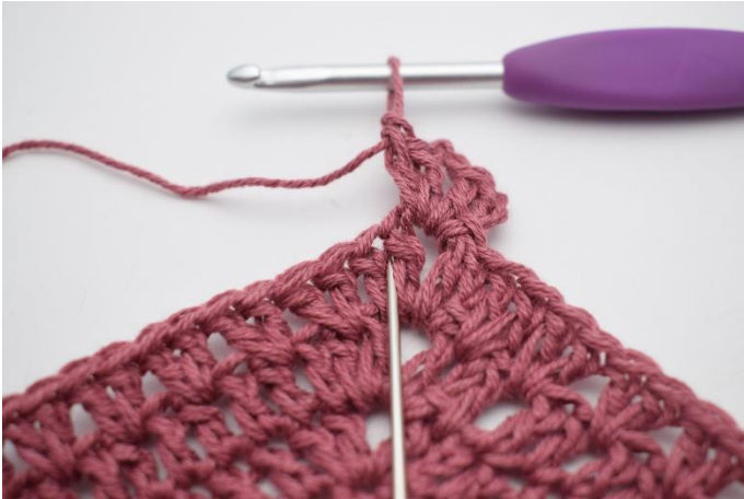
3. "Hækl 2 stgm imellem 2 stgm fra forrige omgang".