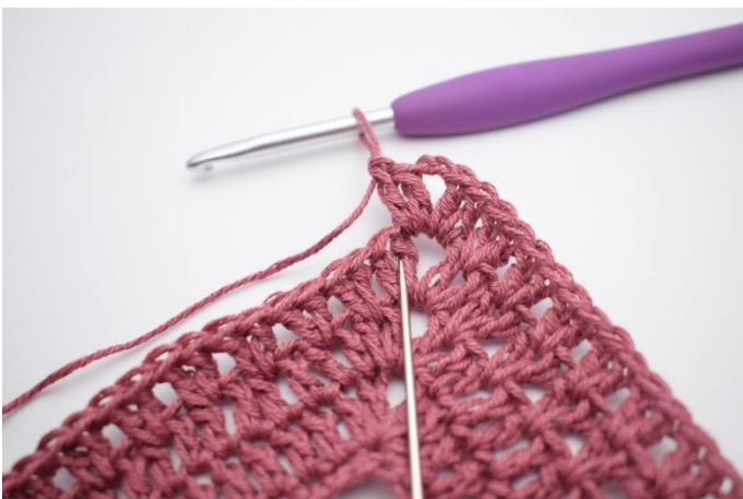
7. Hækl 2 stgm imellem 2 stgm fra forrige omgang".