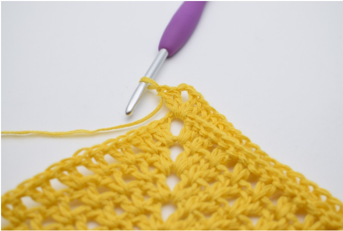
5. Hækl "2 stgm, 2 lm, 2 stgm" i mellemrummet.