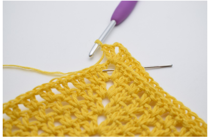
6. Hækl brstgm omkring de næste 70 (72) 76 (78) m.