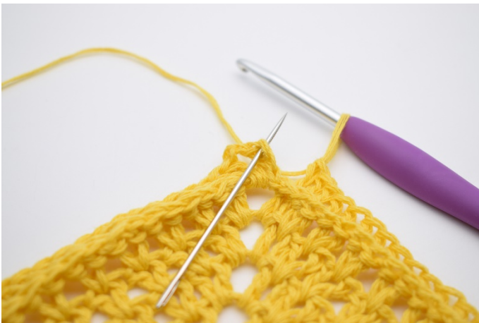
7. Afslut med 1 km i den øverste af de 3 lm som omgangen startede med.