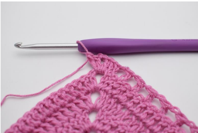
5. I lm-buen hækles 2 stgm, 2 lm, 2 stgm.