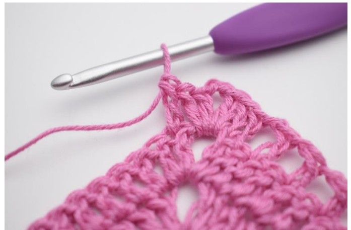
6. Hækl 1 stgm i næste m.