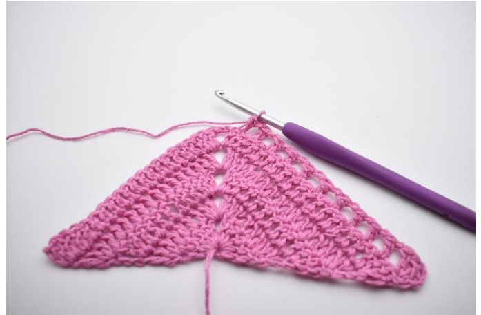
4. Gentag "til" i alt 10 gange.