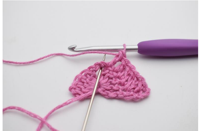
4. I lm-buen hækles 2 stgm, 2 lm, 2 stgm.