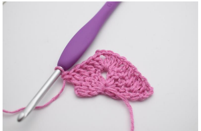
6. Hækl 1 stgm i de næste 4 m.