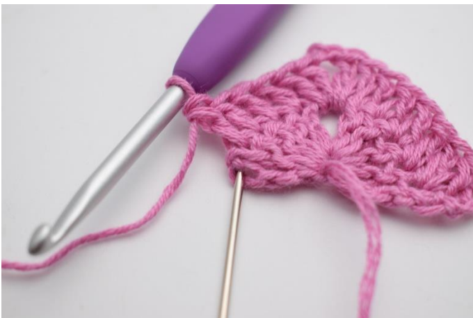
7. I sidste m hækles 2 stgm og 1 dbstgm.