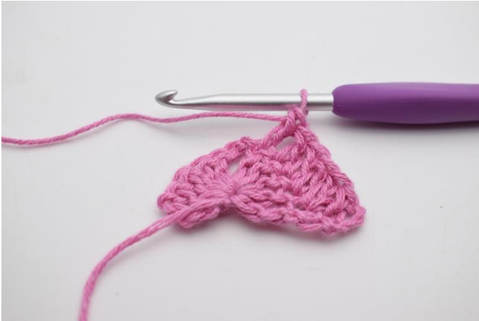
3. Hækl 1 stgm i de næste 4 m.