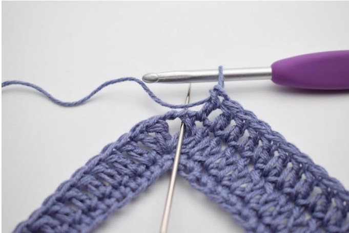
5. I lm-mellemrummet hækles "2 stgm, 2 lm, 2 stgm".