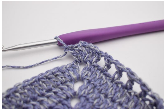
6. I lm-mellemrummet hækles "2 stgm, 2 lm, 2 stgm".