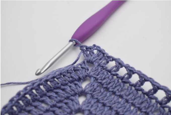
7. I lm-mellemrummet hækles "2 stgm, 2 lm, 2 stgm".