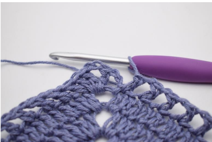
11. Gentag "til" i alt 41 gange.