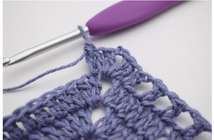
8. Lav 1 stgm i først m.