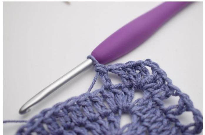
10. hæk 1 stgm i næste m".