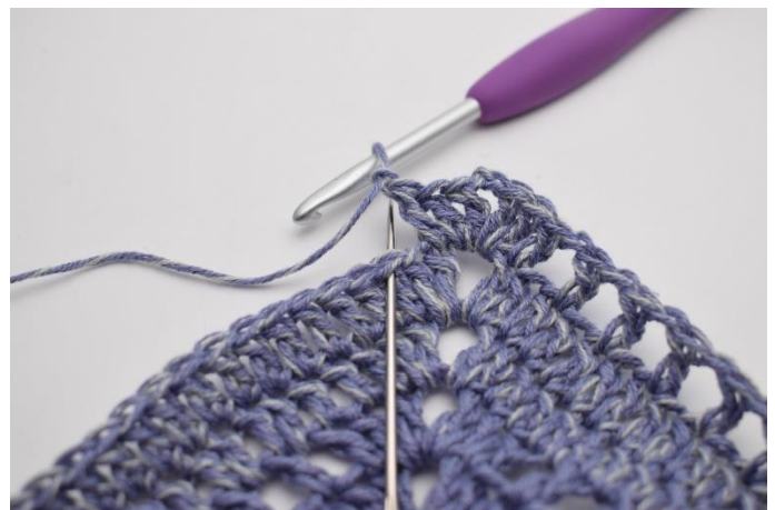
8. "Lav 1 lm, spring 1 m over,