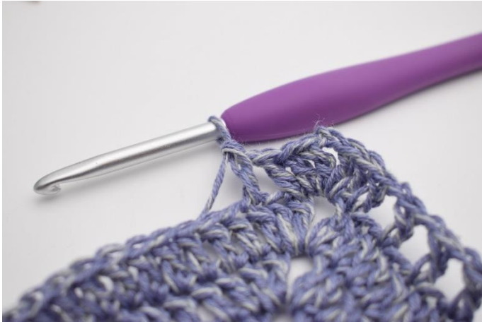
9. hæk 1 stgm i næste m".