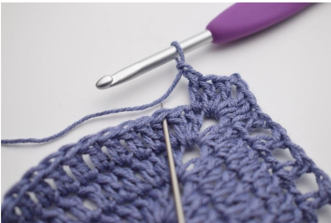
9. "Lav 1 lm, spring 1 m over,