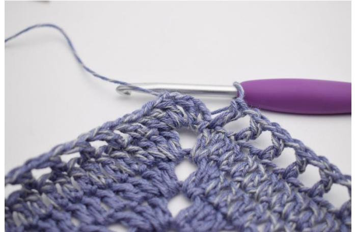
10. Gentag "til" i alt 47 gange.