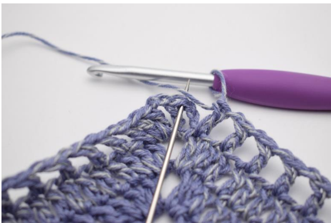
11. Afslut med 1 km.