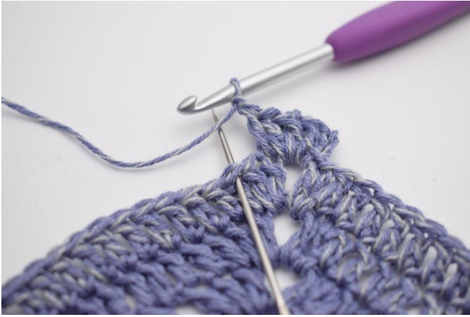
3. "Lav 1 lm, spring 1 m over,