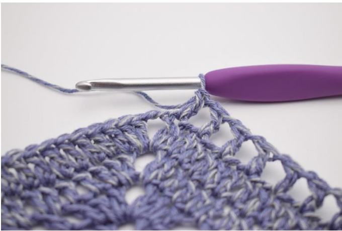
5. Gentag "til" i alt 47 gange.