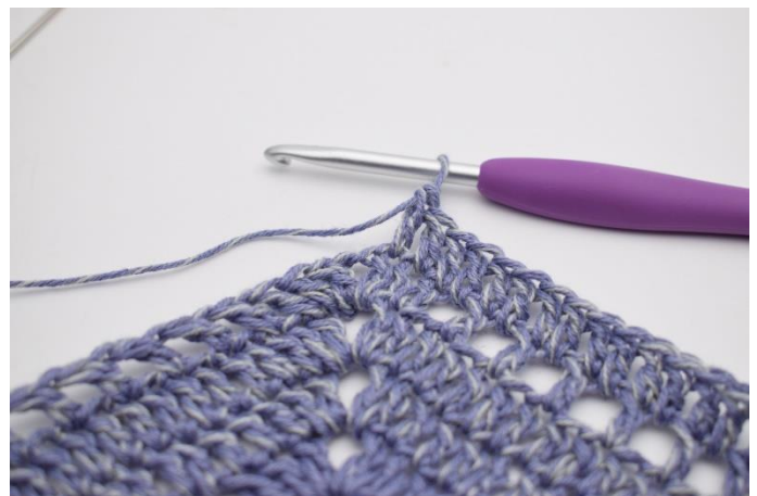
2. Hæk 1 stgm i de næste 99 m og lm-huller.