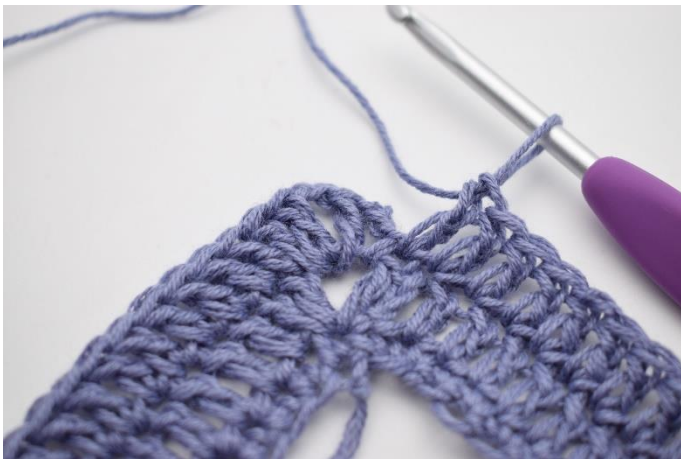
7. Hækl 1 stgm i de sidste 67 m.