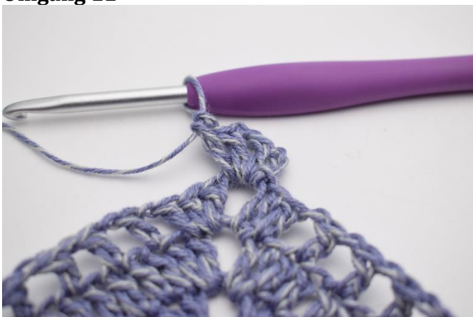
1. Lav km hen til lm-mellemrummet. Lav 3 lm (erstatte 1.stgm). Hæk 1 stgm, 2 lm, og 2 stgm i lm-mellemrummet.