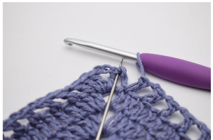
12. Afslut med 1 km