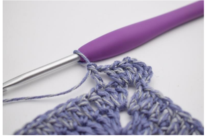
4. hækl 1 stgm i næste m".