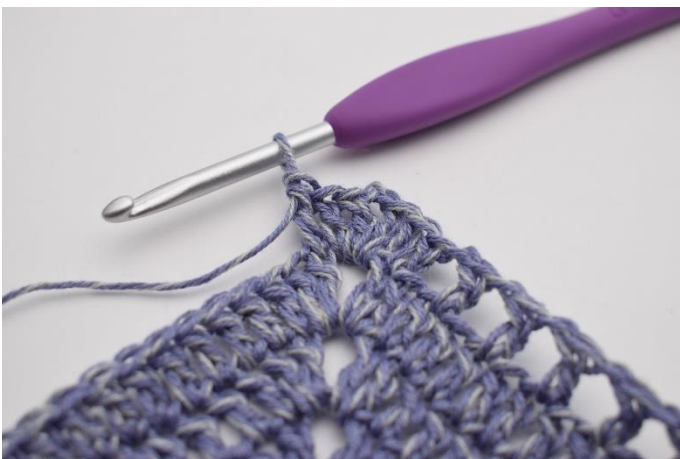
7. Lav 1 stgm i først m.