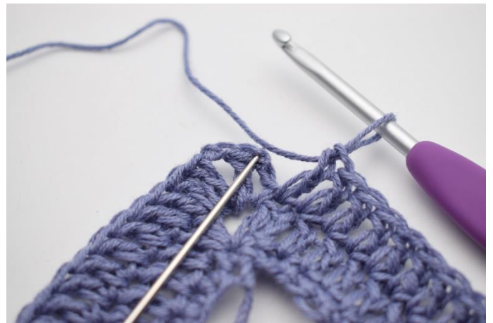
8. Afslut med 1 km.