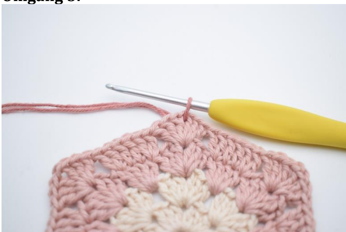
1. Skift til farve 3. Indsæt garnet i et lm-mellemrum.