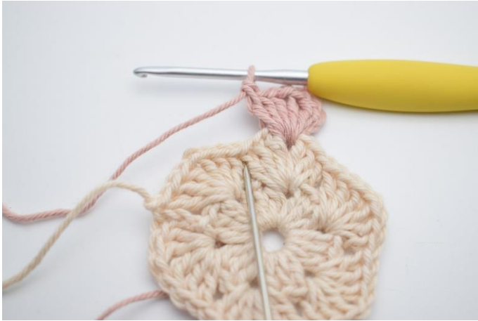
3. I næste mellemrum hækles 4 stgm.