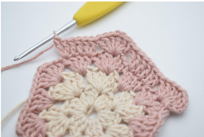
9. spring 3 m over, hækl 2 stgm i næste m, 1 stgm i de næste 2 m, 2 stgm i næste m".