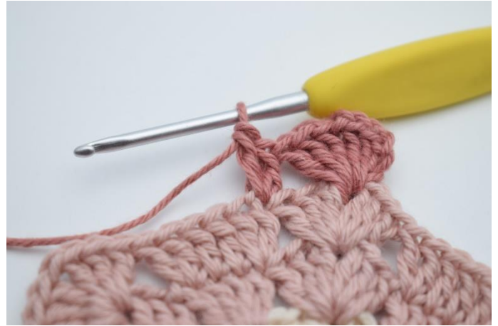
4. hæk 2 stgm i næste m.