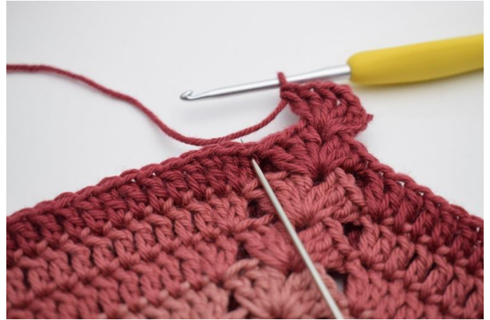
4. Spring 3 m over,