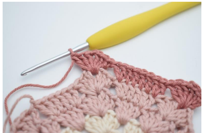
8. "Hæk 3 stgm, 1 lm, 3 stgm i næste lm-mellemrum,