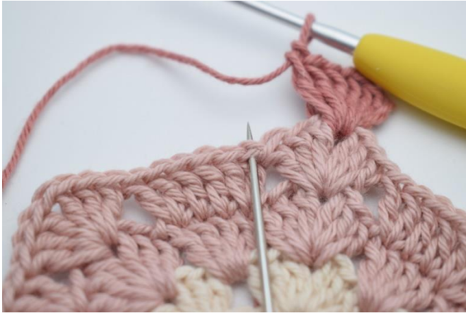
3. Spring 3 m over,