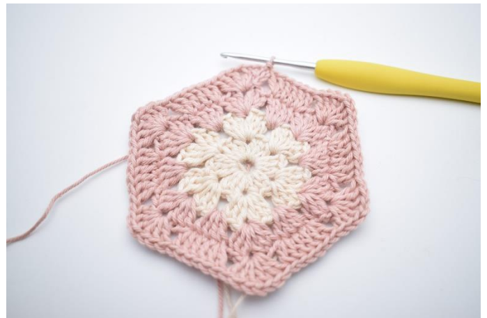
10. Gentag "til" 5 gange. Afslut med 1 km. Klip garnet.