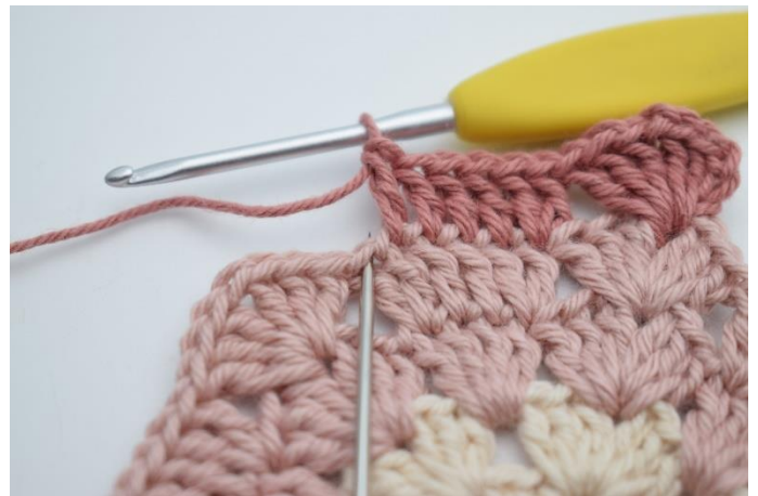
6. Hæk 2 stgm i næste m.