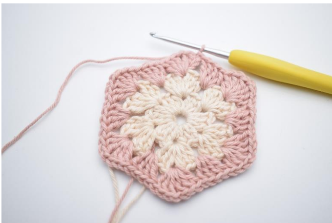
7. Gentag "til" i alt 5 gange. Afslut med 1 km.