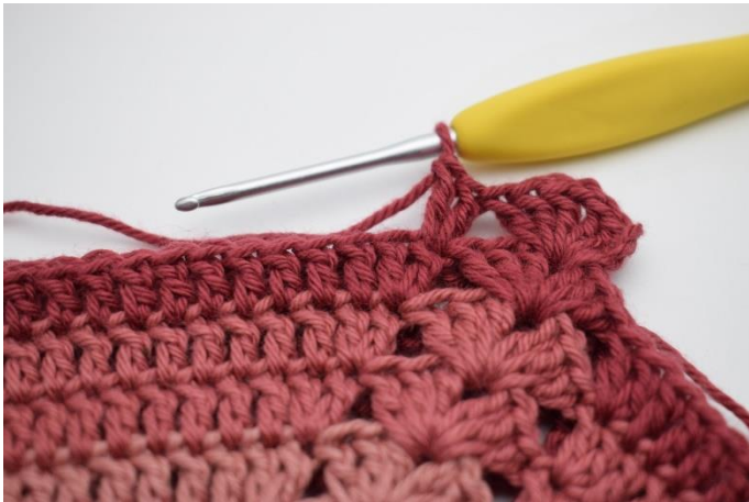
5. hækl 2 stgm i næste m,