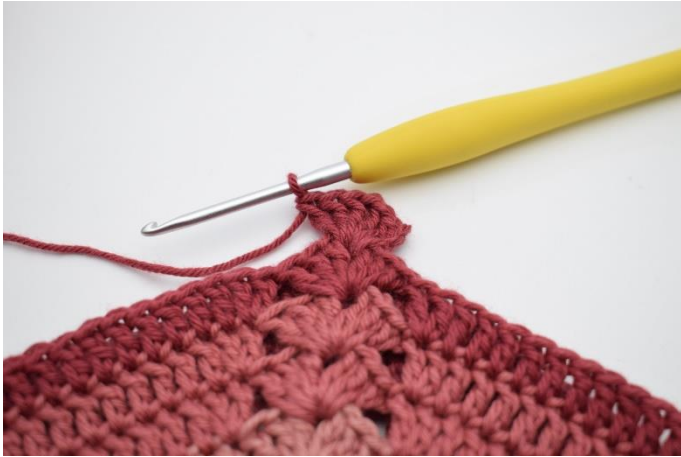
3. Lav 3 lm (erstatte 1 stgm). Hækl 2 stgm, 1 lm, 3 stgm i lm-mellemrummet.