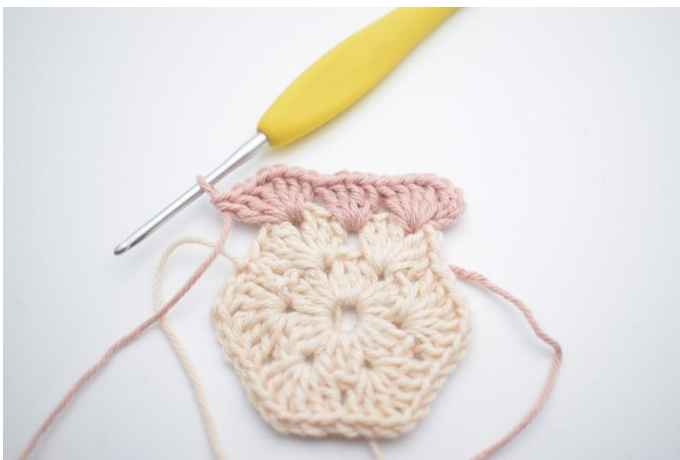
5. "Hækl 3 stgm, 1 lm, 3 stgm i næste mellemrum,