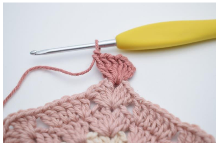
2. Lav 3 lm (erstatte 1 stgm). Hækl 2 stgm, 1 lm, 3 stgm i lm-mellemrummet.