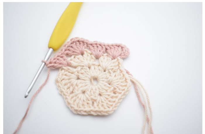
6. hæk 4 stgm i det efterfølgende mellemrum".