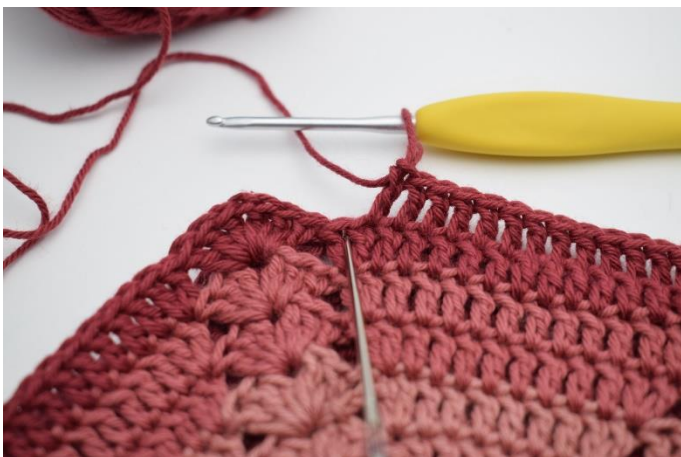
7. 2 stgm i næste m.