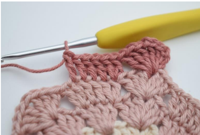
5. Hæk 1 stgm i de næste 4 m.