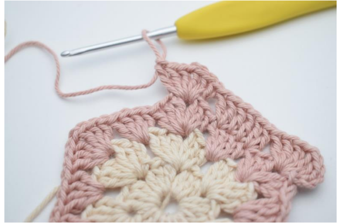
8. "Hækl 3 stgm, 1 lm, 3 stgm i næste lm-mellemrum,