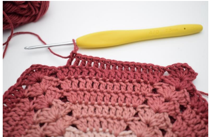
6. 1 stgm i de næste 14 m,