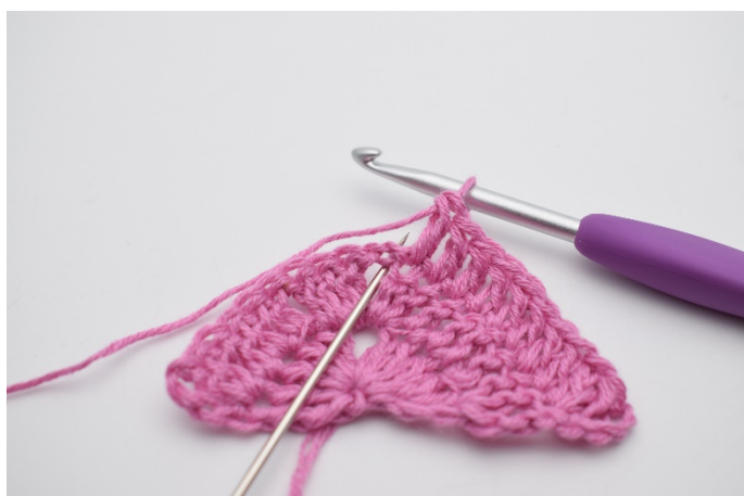
4. I lm-buen hækles 2 stgm, 2 lm, 2 stgm.