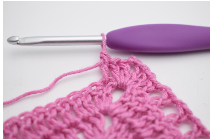
6. Hækl 1 stgm i næste m.