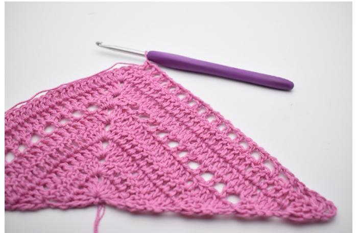
4. Gentag "til" i alt 16 gange.