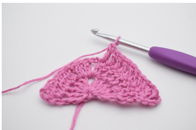
3. Hækl 1 stgm i de næste 8 m.