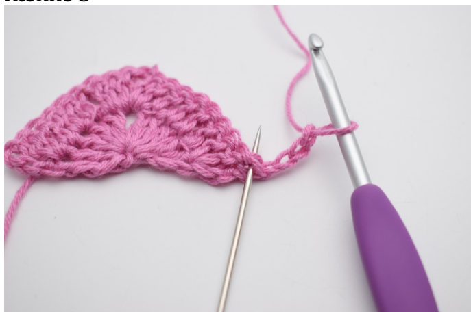
1. Vend arbejdet med 4 lm. Hækl 2 stgm i første m. Nålen her markerer den første maske.