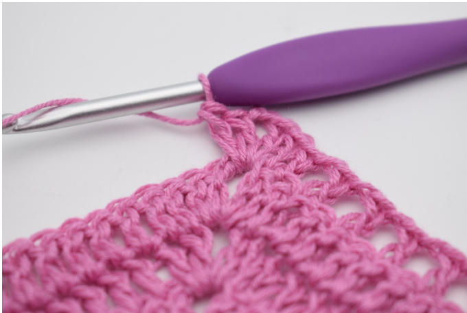
5. I lm-buen hækles 2 stgm, 2 lm, 2 stgm.