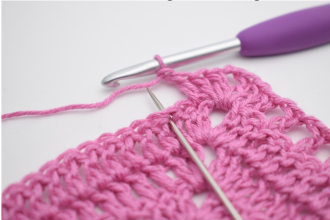
7. "Lav 1 lm, spring 1 m over, hækl 1 stgm i næste m".