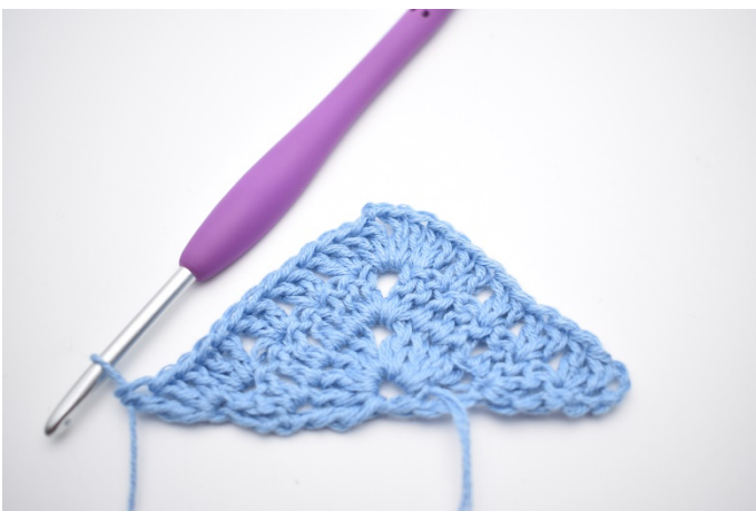
7. I sidste m hækles 2 stgm og 1 dbstgm