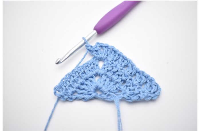
4. I lm-buen hækles 2 stgm, 2 lm, 2 stgm.