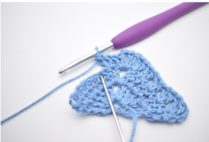
5. Hækl "2 stgm, spring 1 m over".