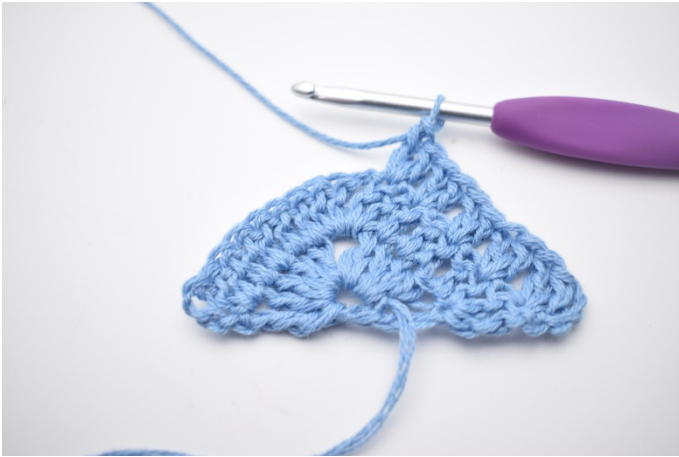
3. Gentag "til" i alt 4 gange.