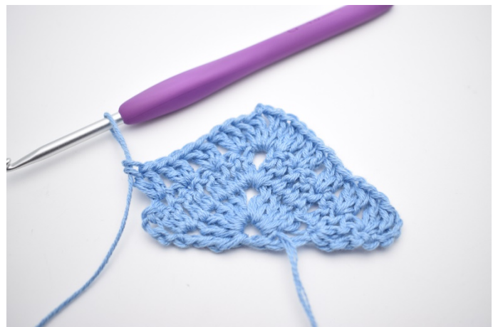
6. Gentag "til" i alt 4 gange.