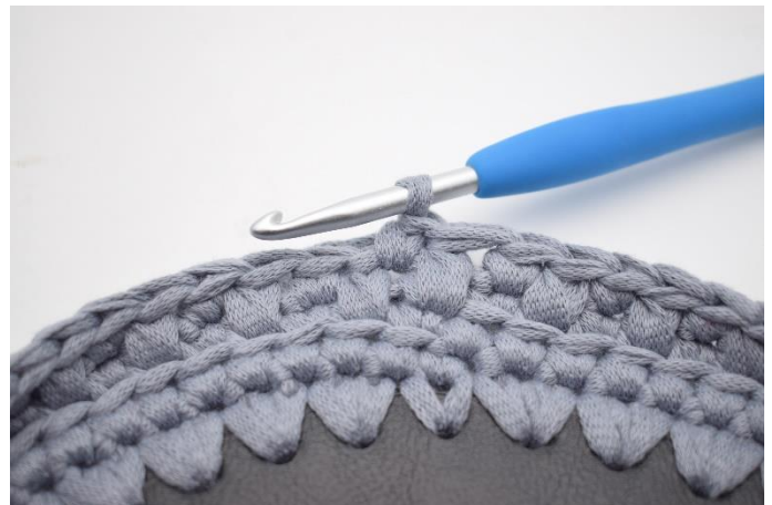
16. Hækl 1 fm i næste m.