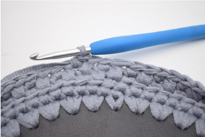
19. Hækl 1 fm i næste m.