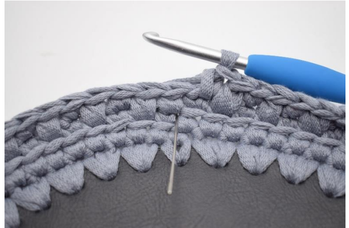
14. Nu skal der hækles skiftevis dfm og fm. Hækl 1 dfm i næste m. Nålen markerer hvor din dfm skal hækles.