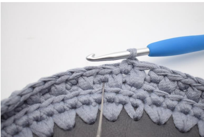
17. Hækl 1 dfm i næste m. Nålen markerer hvor din dfm skal hækles.