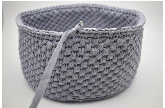
22. Hækl 1 omgang fm.