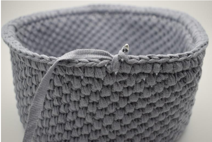
25. Gentag omgangen rundt.