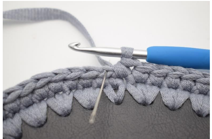
4. Nu hækles der fm i bml. Nålen markerer hvor din fm skal hækles.