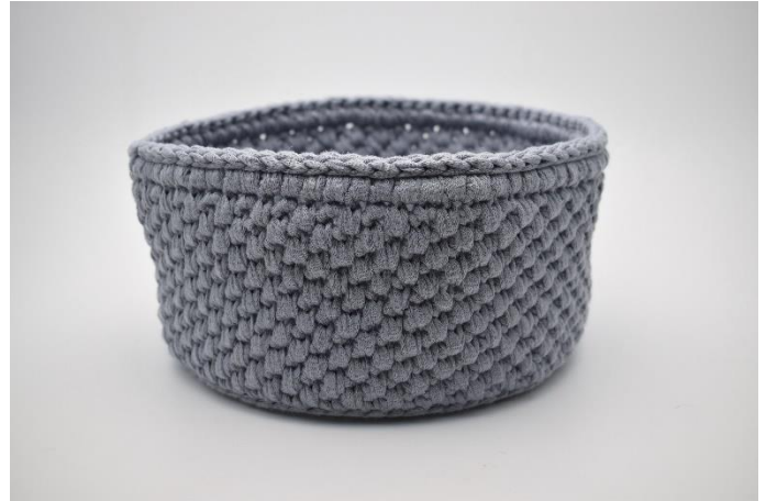
26. Hækl 1 omgang km. Klip garnet og hæft ender.