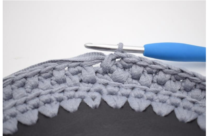
20. Gentag omgangen rundt med skiftevis dfm og fm. Afslut omgangen med 1 dfm.