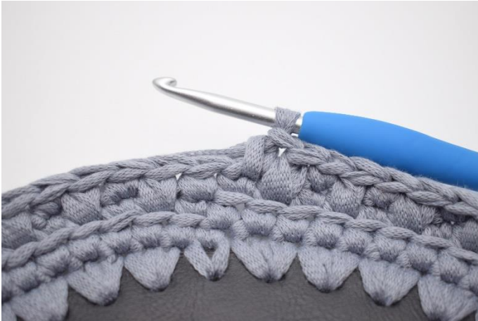
13. Gentag omgangen rundt med fm og dfm. Afslut omgangen med 1 fm.