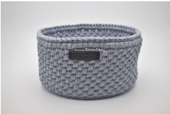
27. Sy "Handmade" mærke på med nål og tråd.