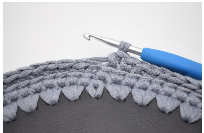
6. Gentag omgangen rundt med fm i bml.