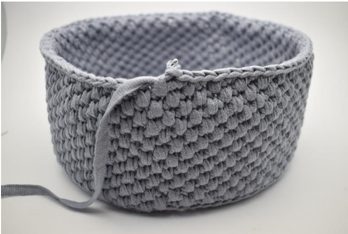
21. Gentag disse rækker som beskrevet i opskriften.