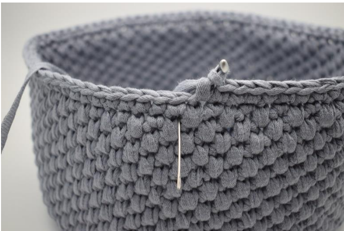
23. Hækl 1 omgang dfm. Nålen markerer hvor din dfm skal hækles.