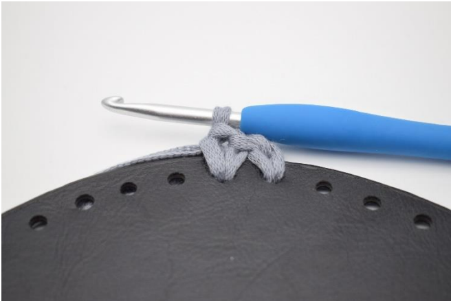
1. Hækl fm rundt i alle huller på bunden som beskrevet i opskriften.