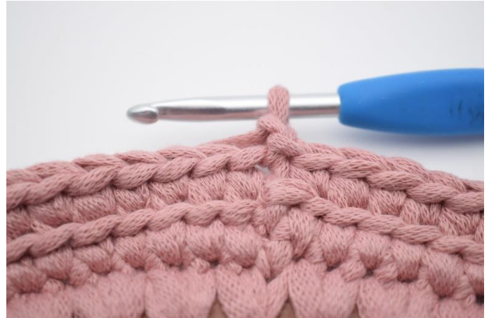
8. Lav 1 lm.