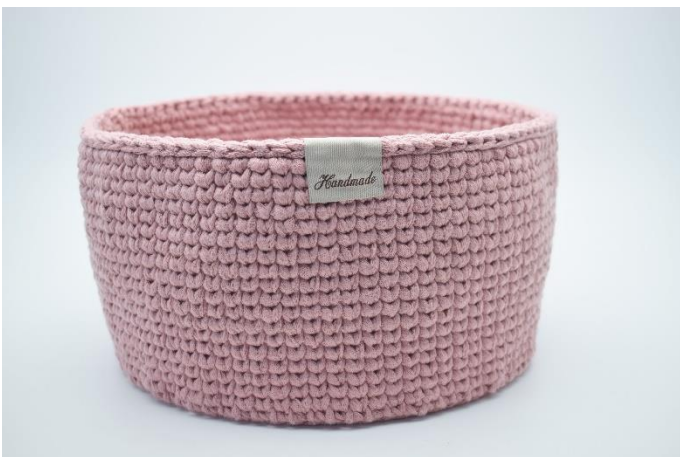
23. Sy eller lim evt. et smart "Handmade" mærke fast. Mærket er foldet ned over kanten på kurven.