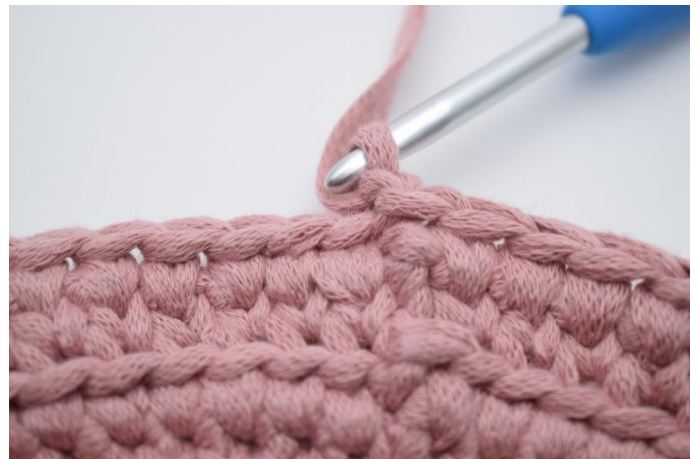
16. Lav 1 lm.