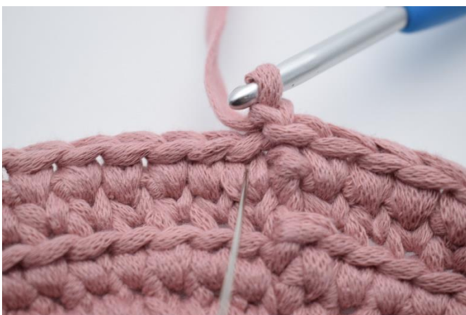
17. Hækl 1 fm ned i vét på den første maske.