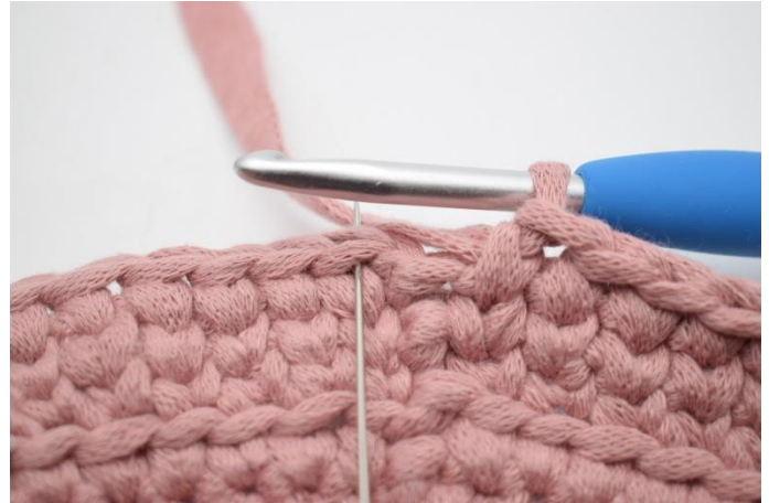
20. Afslut med 1 km i den første maske fra omgangens start.