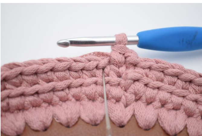
11. Næste fm hækles i vét i den næste maske.