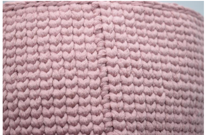
22. Gentag som beskrevet i opskriften. Afslut med 1 omgang km. Din samling vil se sådan ud.