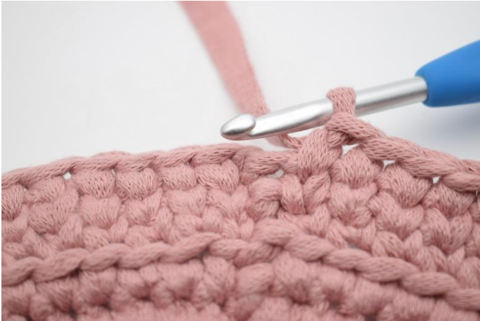
19. Gentag omgangen rundt.