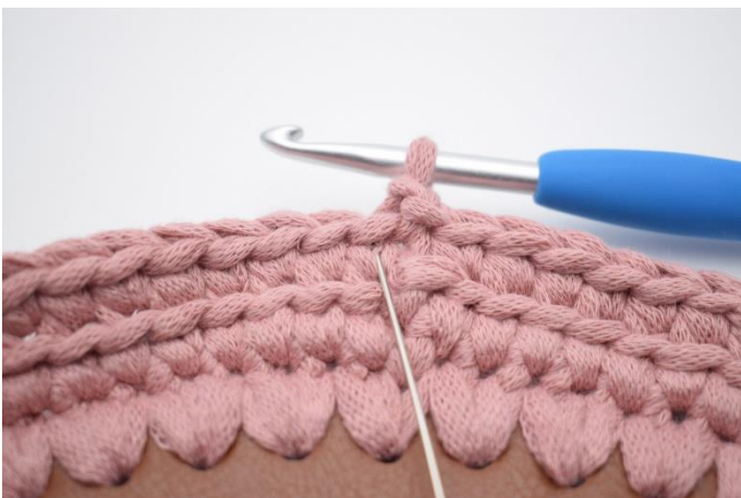
9. Nu skal der hækles ks. Ks er en alm. fm men som er hæklet i vét i masken under. Hækl 1 fm i det første v. Nålen her markerer hvor din fm skal hækles.