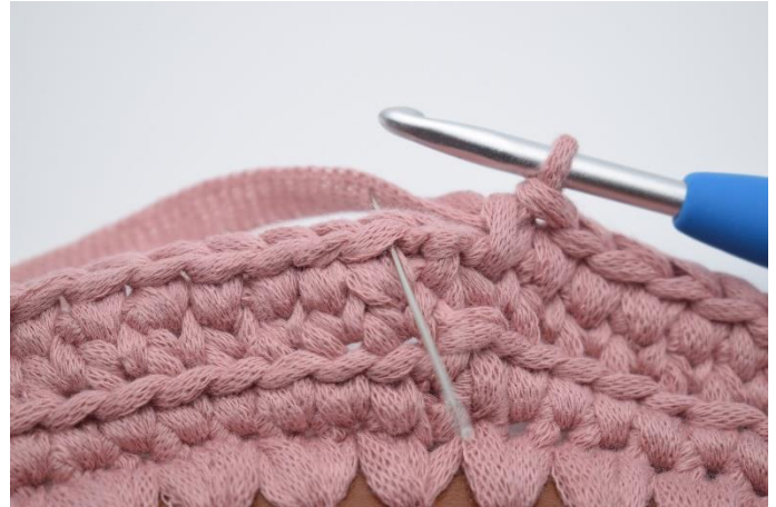
14. Afslut med 1 km i første m fra omgangens begyndelse.