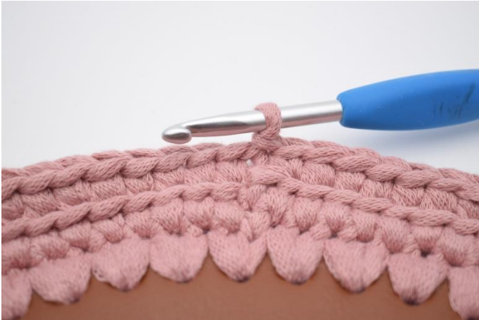
7. Gentag omgangen rundt og afslut med 1 lm.