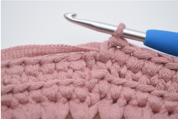
13. Hækl ks omgangen rundt.