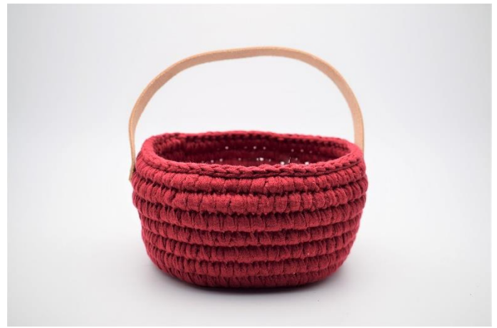
16. Sæt hanken på kurven med nitterne som bankes let sammen med en hammer.