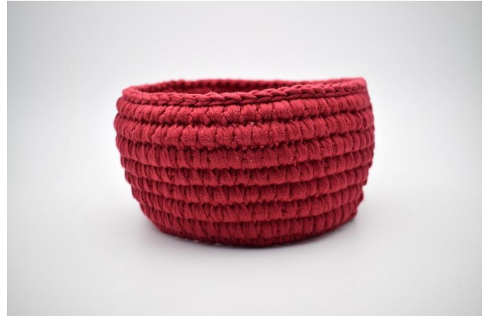
14. Gentag omgangene som beskrevet i opskriften. Afslut med en omgang km.