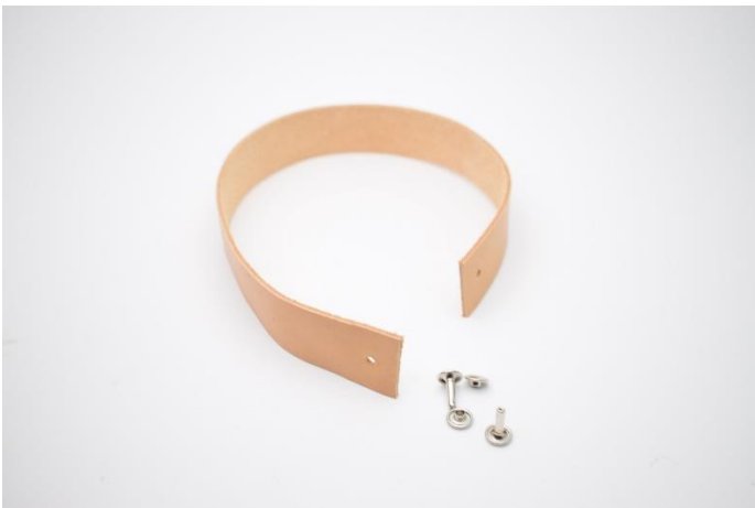
15. Klip din læderrem til. Lav hul til nitterne med en hultang