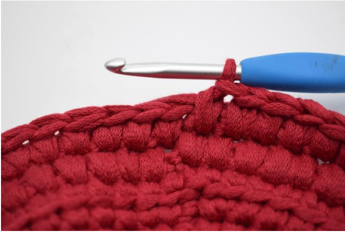
13. Gentag dfm omgangen rundt.