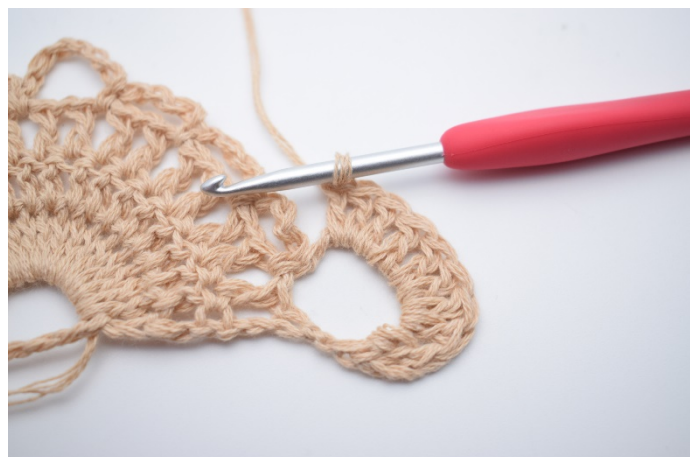
2. Hækl 9 stgm i lm-buen (10 stgm).