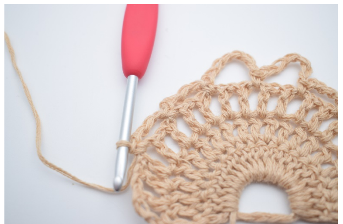
12. Lav 4 lm, spring 1 lm-mellemrum over og hækl 1 fm i næste lm-mellemrum.