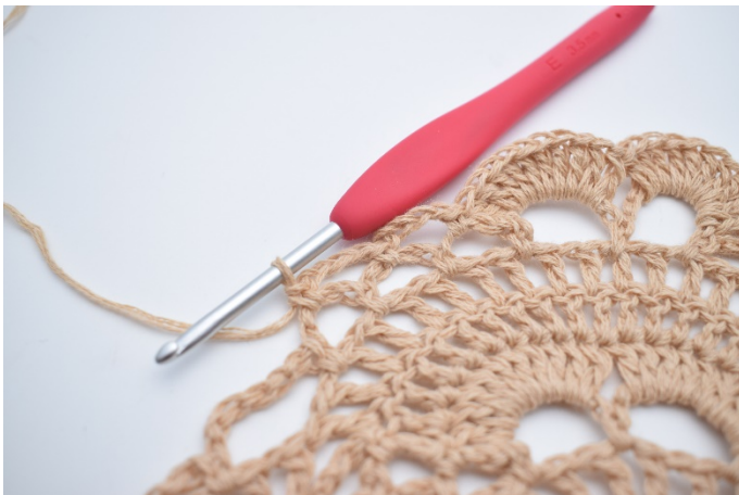
41. Lav 4 lm, og hækl 1 fm i næste lm-bue. Gentag 1 gang mere, så du har 2 små lm-buer.