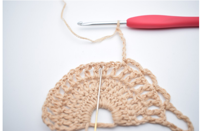
8. Lav 7 lm, spring 1 lm-mellemrum over og hækl 1 fm i næste lm-mellemrum.