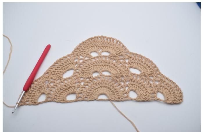
56. Hækl "1 lm, 1 stgm" i alle stgm omkring den sidste store lm-bue. (10 stgm)