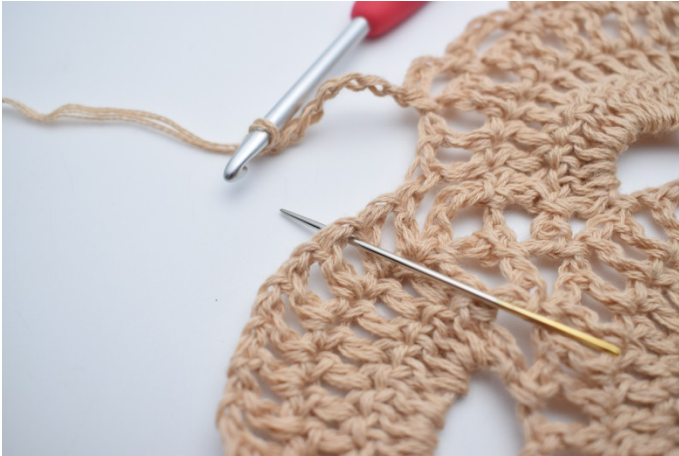
28. Lav 7 lm, og spring over 2 lm-mellemrum. Hækl 1 fm i næste lm-mellemrum. Nålen her markerer hvor din fm skal hækles.