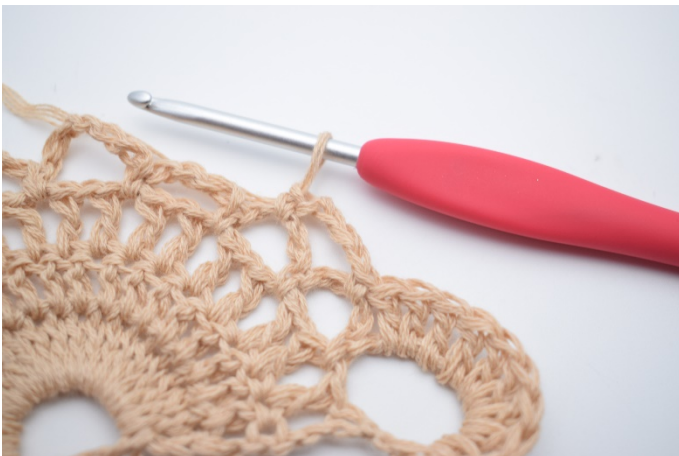
5. Lav 4 lm, og hækl 1 fm i næste lm-bue.