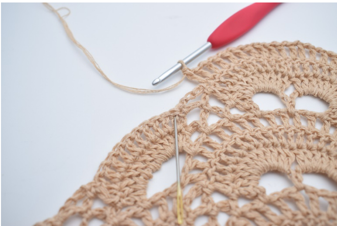
53. Spring den lille lm-bue over, og hækl 1 stgm i den første stgm omkring den næste store lm-bue. Nålen her markerer hvor din næste stgm skal hækles.