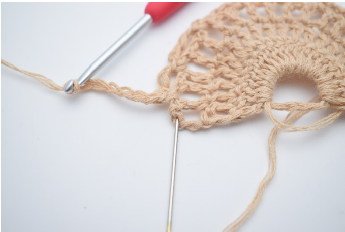
15. Hækl 1 stgm i sidste m. Nålen her markerer hvor din stgm skal hækles.