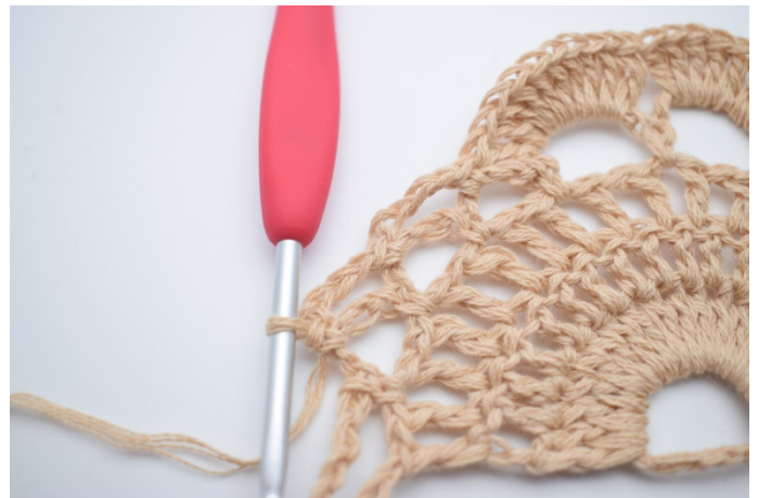
12. Lav 4 lm, og hækkl 1 fm i næste lm-bue.