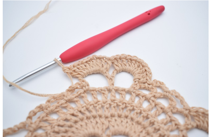
40. Hækl 10 stgm omkring den store lm-bue ved siden af. Hækl 1 fm i lm-buen ved siden af.