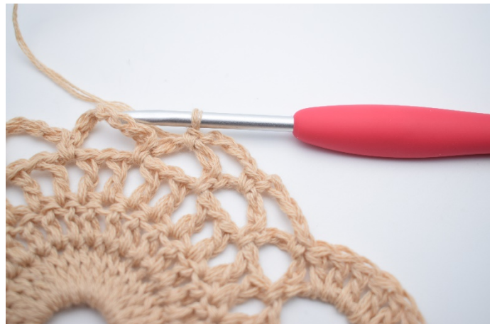
6. Lav 4 lm, og hækl 1 fm i næste lm-bue.