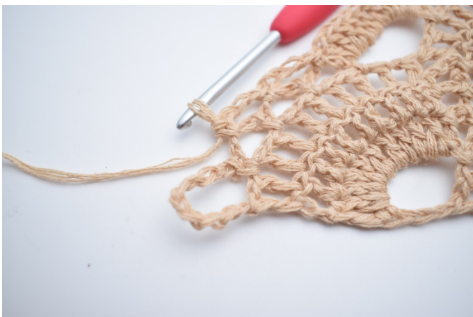
43. Lav 4 lm, og hækl 1 fm i næste lm-bue. Gentag 1 gang mere, så du har 2 små lm-buer.