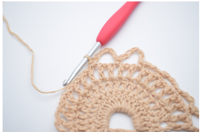
10. Lav 7 lm, spring 1 lm-mellemrum over og hækl 1 fm i næste lm-mellemrum.