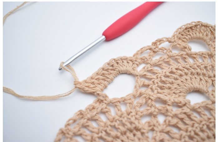
42. Hækl 10 stgm omkring den store lm-bue. Hækl 1 fm i lm-buen ved siden af.