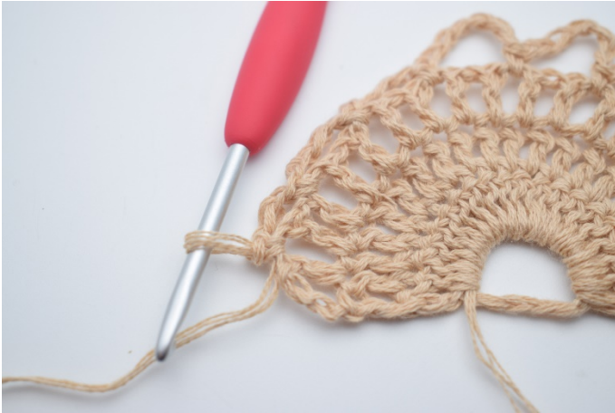
13. Gentag 1 gang mere så du har 3 små lm-buerne med 4 lm.