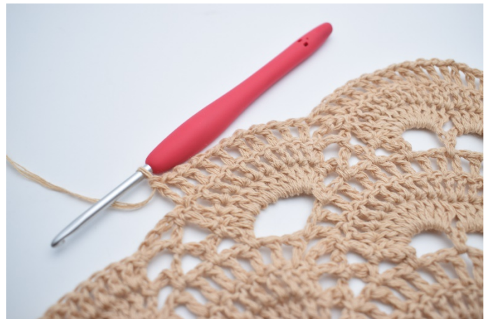
54. Hækl "1 lm, 1 stgm" i alle stgm omkring den store lm-bue. (10 stgm)