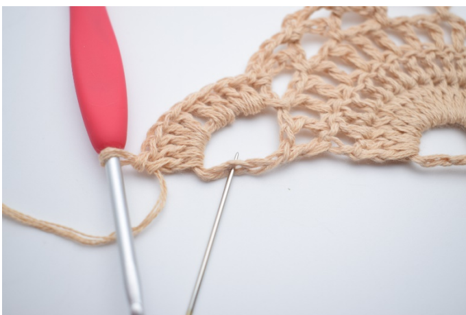
13. Hækkl 10 stgm i den sidste store lm-bue. Den sidste stgm hækles i 3. lm som nålen her markerer.