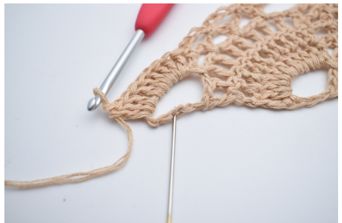
44. Hækl 10 stgm omkring den sidste store lm-bue. Den sidste stgm hækles i 3. lm. Nålen markerer her hvor din sidste stgm skal hækles.