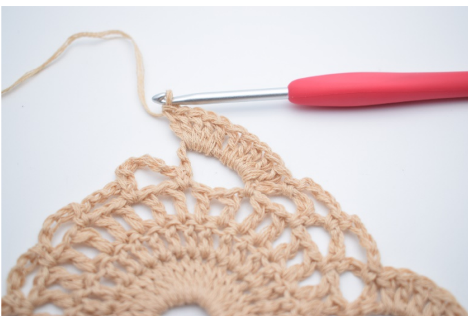
7. Hækl 10 stgm i den store lm-bue.