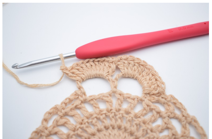
8. Hækl 10 stgm i den næste store lm-bue.