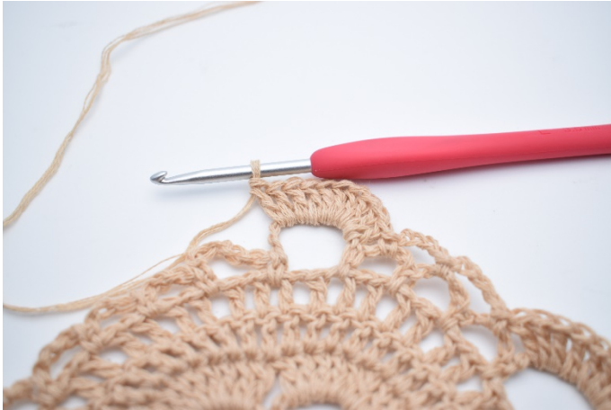
39. Hækl 10 stgm omkring den store lm-bue.