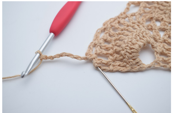
31. Lav 7 lm, og hækl 1 stgm i sidste m. Nålen her markerer hvor din stgm skal hækles.