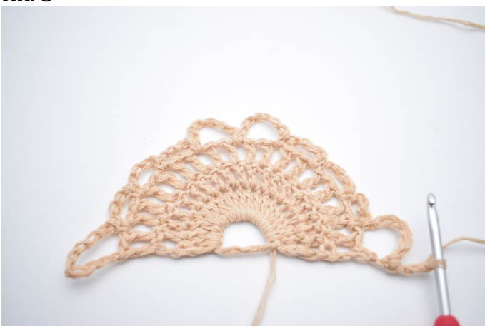
1. Vend dit arbejde med 3 lm (erstatte 1. stgm).