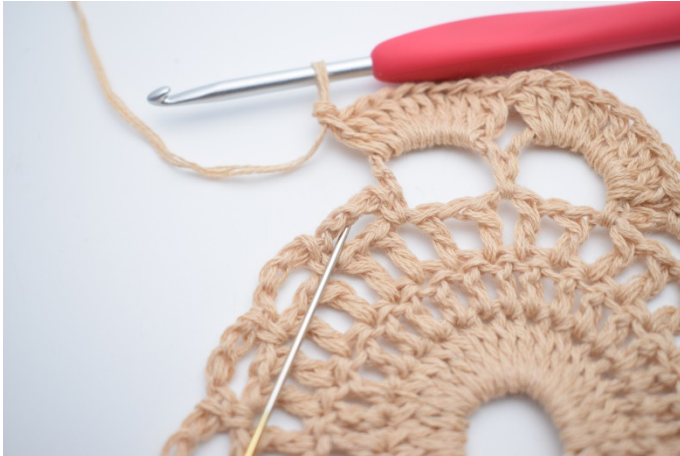
9. Lav 1 fm i lm-buen ved siden af. Nålen her markerer hvor din fm skal hækles.