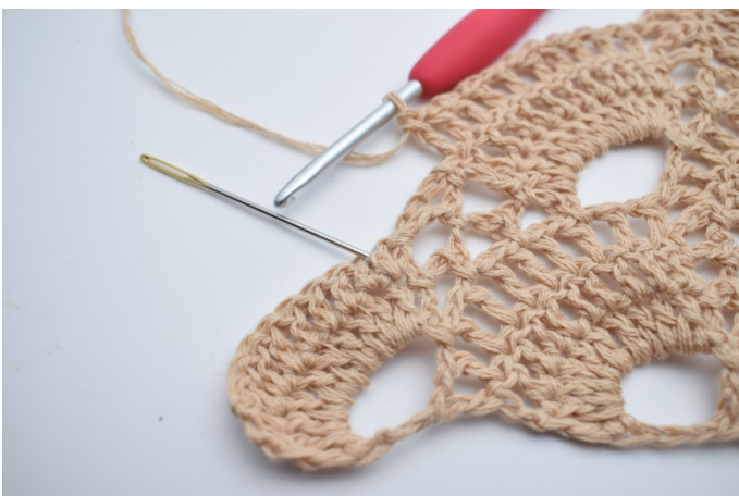
55. Spring den lille lm-bue over, og hækl 1 stgm i den første stgm omkring den næste store lm-bue. Nålen her markerer hvor din næste stgm skal hækles.