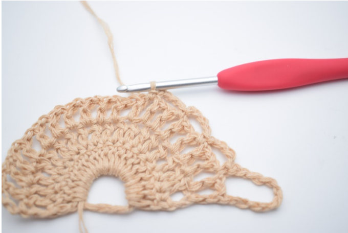
7. Gentag 1 gang mere så du har 3 små lm-buer.