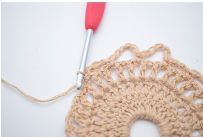
11. Lav 4 lm, spring 1 lm-mellemrum over og hækl 1 fm i næste lm-mellemrum.