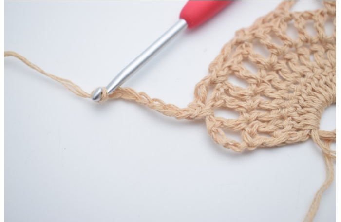
14. Lav 7 lm.