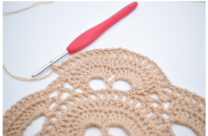
Hækl "1 lm, 1 stgm" i alle masker rundt om de 2 store lm-buer. (20 stgm)