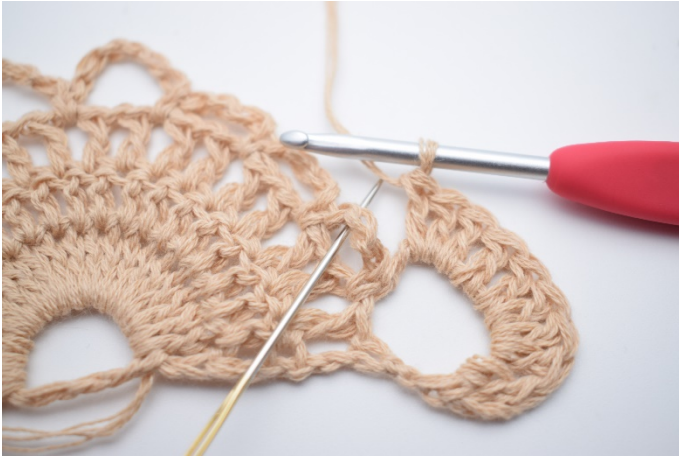
3. Hækl 1 fm i lm-buen ved siden af. Nålen her markerer hvor din fm skal hækles.