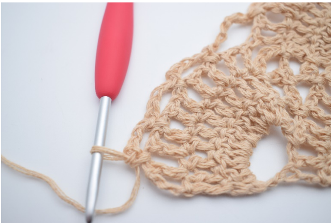
30. Lav 4 lm, spring 1 lm-mellemrum over og hækl 1 fm i næste lm-mellemrum. Gentag dette i alt 3 gange, og du har 3 små lm-buer.