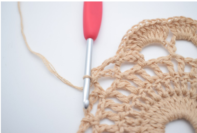
11. Lav 4 lm, og hækkl 1 fm i næste lm-bue.