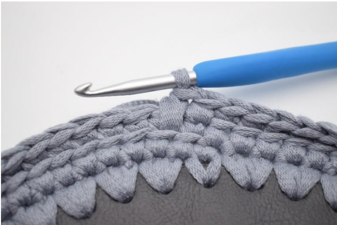
9. Sådan. Der er nu hæklet 1 fm og 1 dfm.