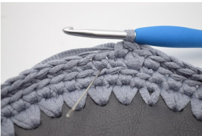
11. Hækl 1 dfm i næste m. Nålen markerer hvor din dfm skal hækles.