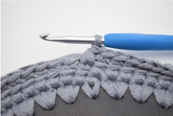
7. Nu hækles der skiftevis fm og dfm. Start med en fm.