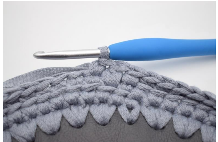
10. Hækl 1 fm i næste m.