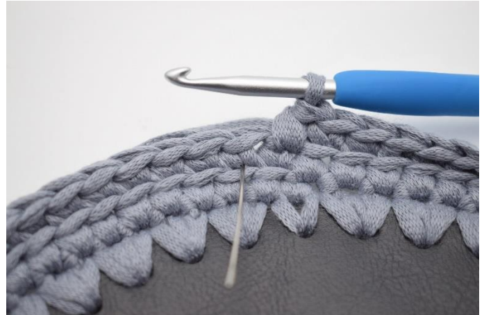
8. Hækl 1 dfm i næste m. Nålen her markerer hvor din dfm skal hækles.