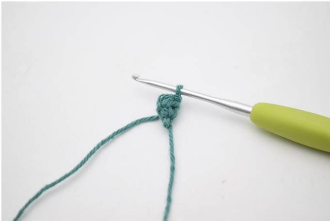
3. Vend med 1 lm.