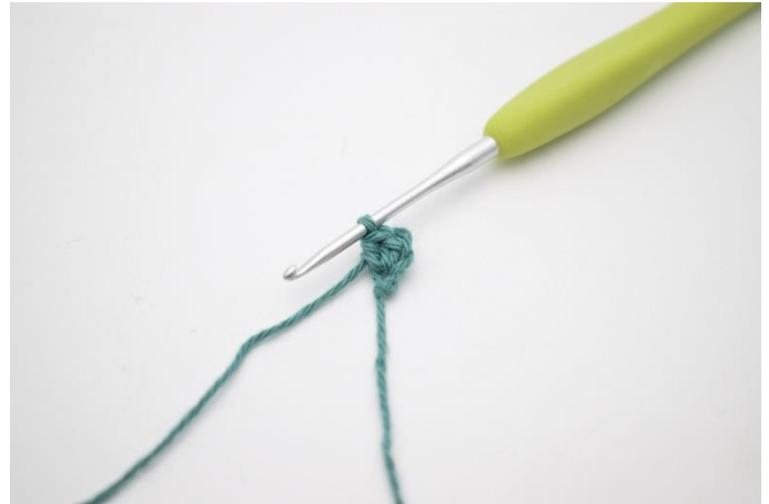
2. Hækl 2 hstm i 2.lm.