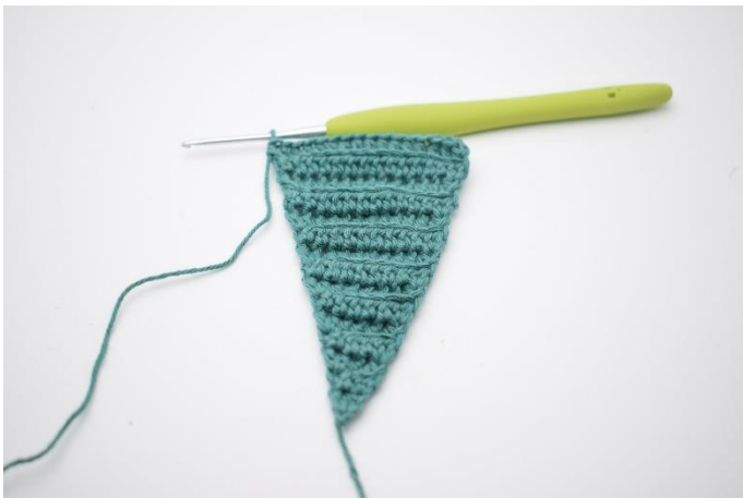
9. Gentag rækkerne til du har 16 hstm.