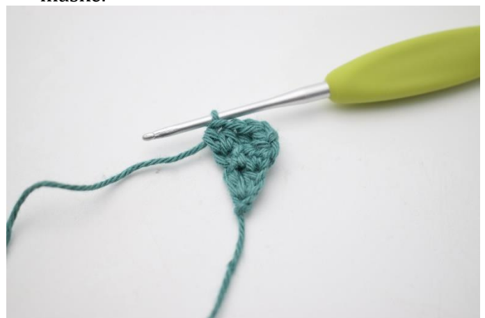
6. Hækl 1 hstm i de næste 2 m, og 2 hstm i sidste maske.