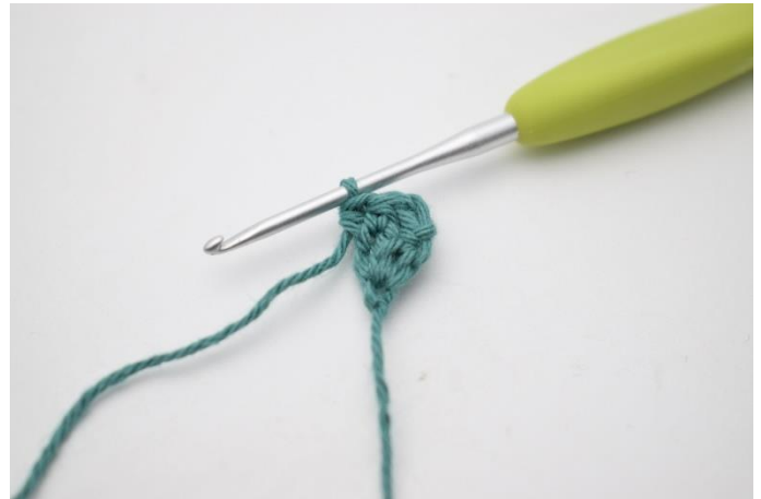
4. Nu hækles alle rækker i bagerste maskeled. Hækl 1 hstm i første maske, og 2 hstm i sidste maske.