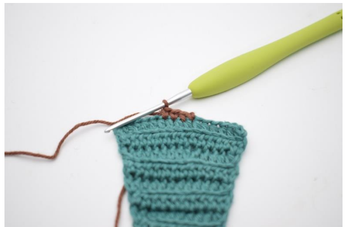
12. Hækl 4 fm.