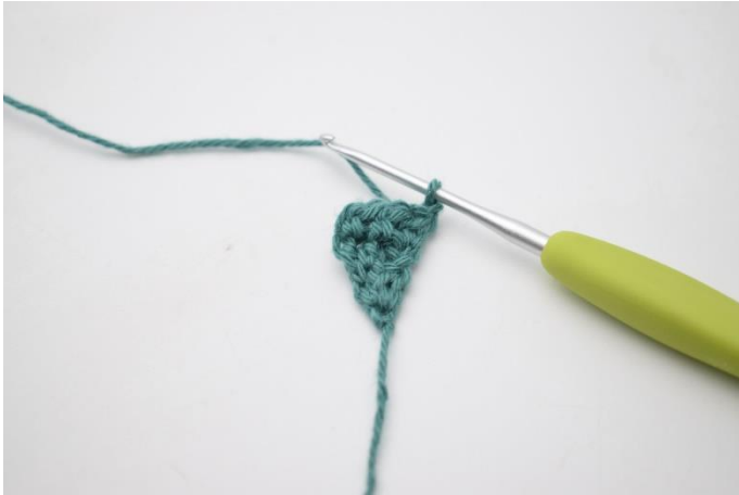
7. Vend med 1 lm.