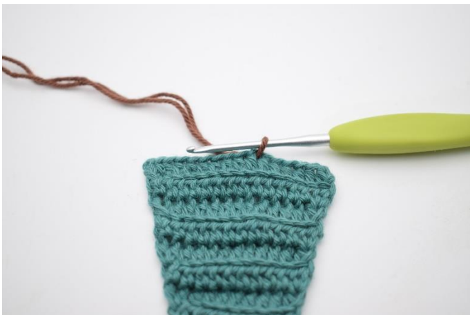
11. Spring 6 masker over og indsæt farven til "stammen".