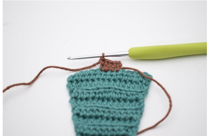
14. Hækl 1 fm i de 4 m.