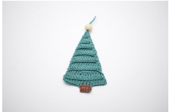
16. Sæt evt. en træperle i toppen.