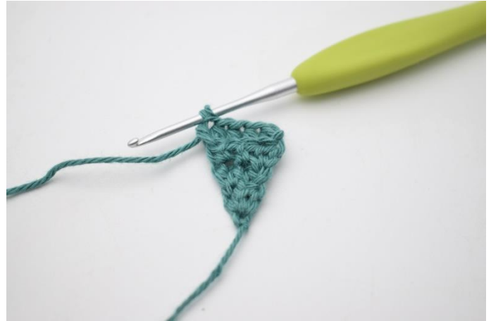
8. Hækl 1 hstm i de næste 3 m, og 2 hstm i sidste maske.