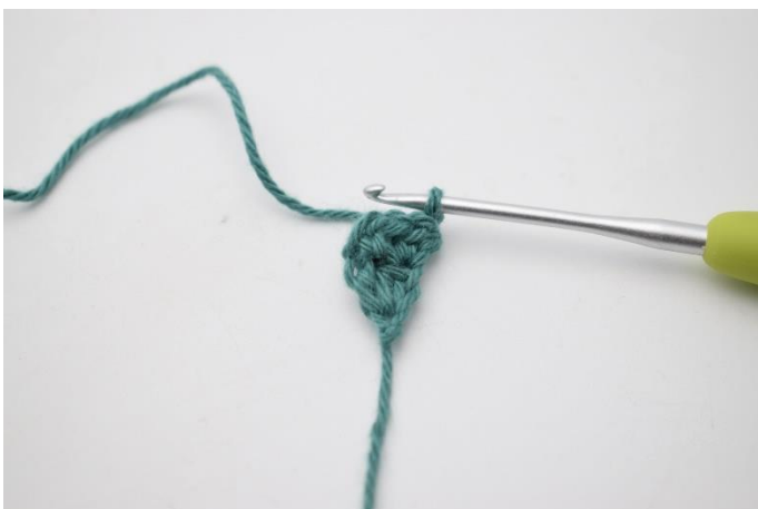
5. Vend med 1 lm.