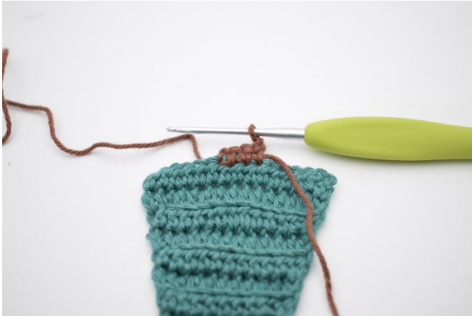
13. Vend med 1 lm.