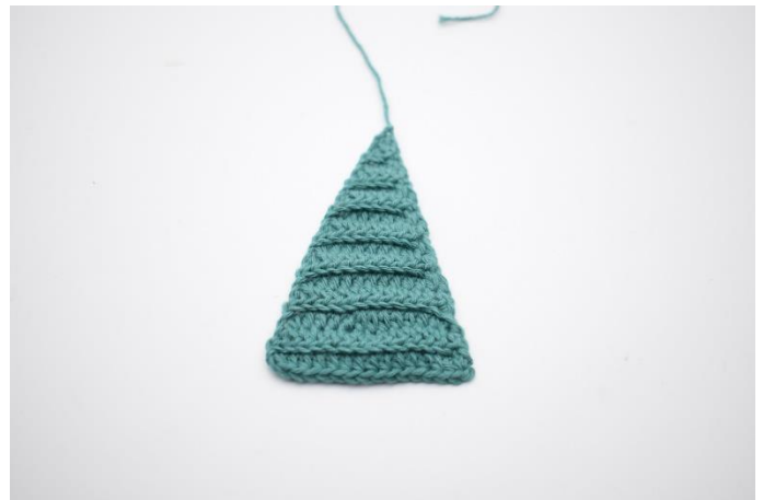
10. Hæft enden.