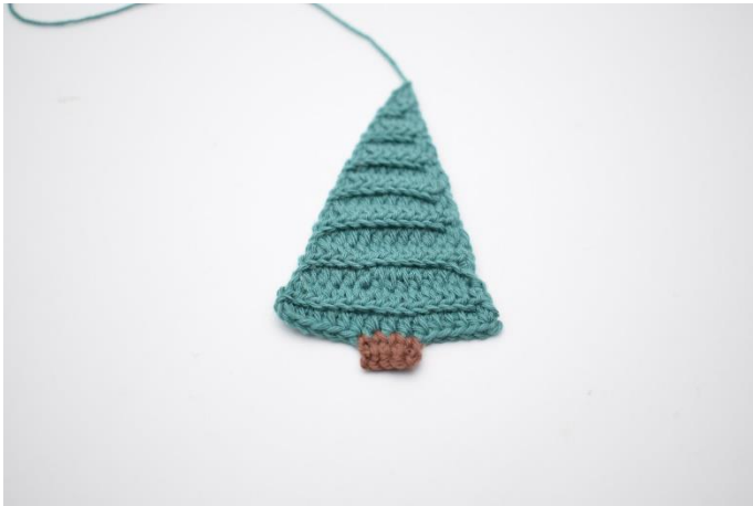
15. Klip garnet og hæft ender.