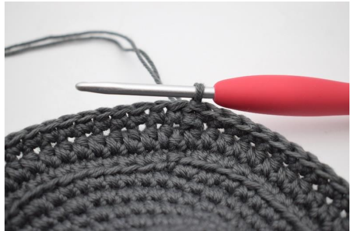
8. Hækl 1 omgang fm og afslut med 1 km.