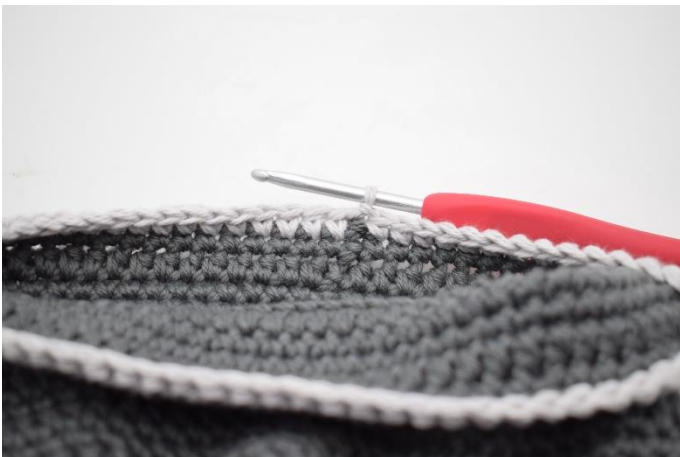
13. Hækl kant/fold som beskrevet i opskriften. Skift til en kontrastfarve. Lav 1 lm og hækl fm omgangen rundt. Afslut med 1 km. Klip garnet og hæft ender.