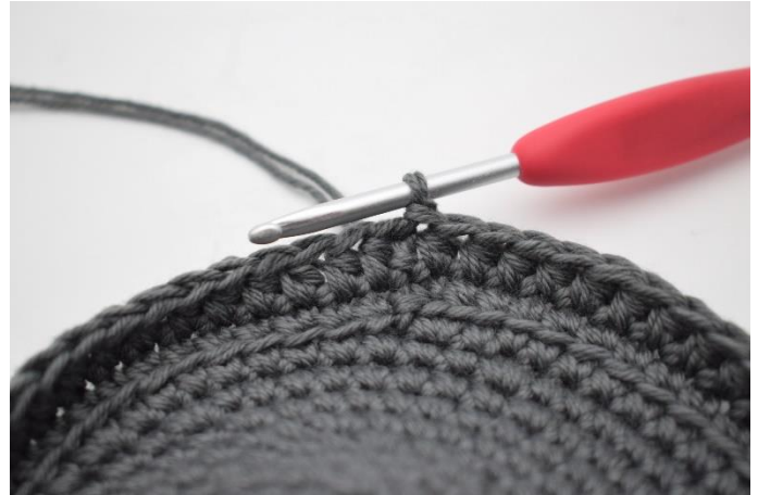
6. Hækl hstm omgangen rundt og afslut med 1 km.