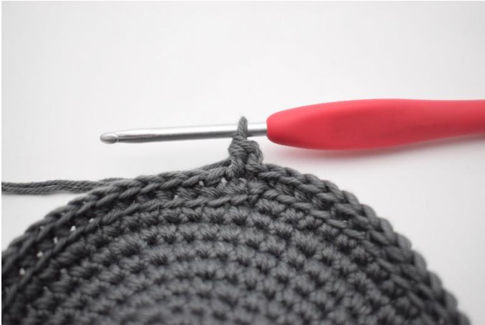
5. Hækl 1 hstm.