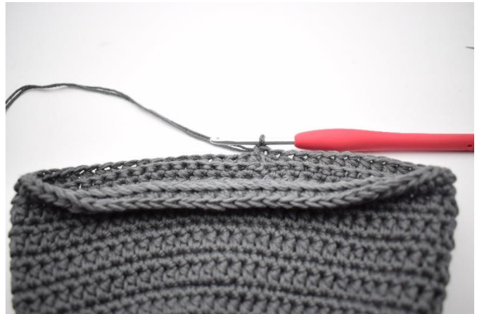
12. Afslut med 1 km.