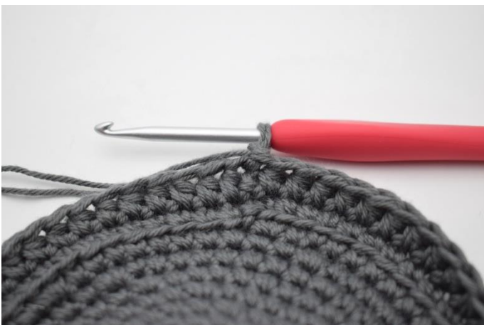
7. Lav 1 lm.