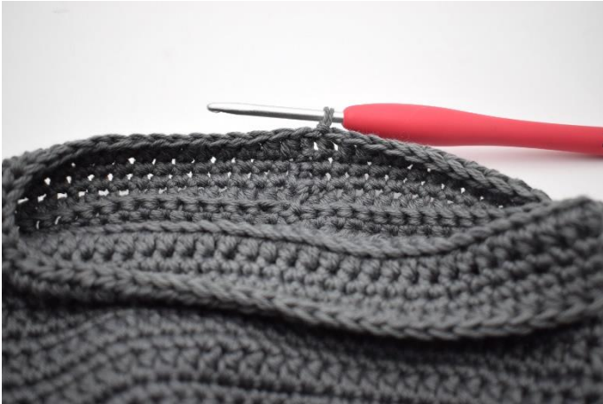
15. Lav 1 lm og hæk hstm omgangen rundt. Afslut med 1 km.