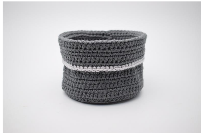
18. Fold nu kanten ned over kurven, og monter ophæng.