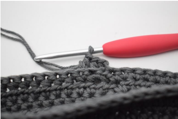
11. Lav 1 lm, og hækl hstm i bml omgangen rundt.