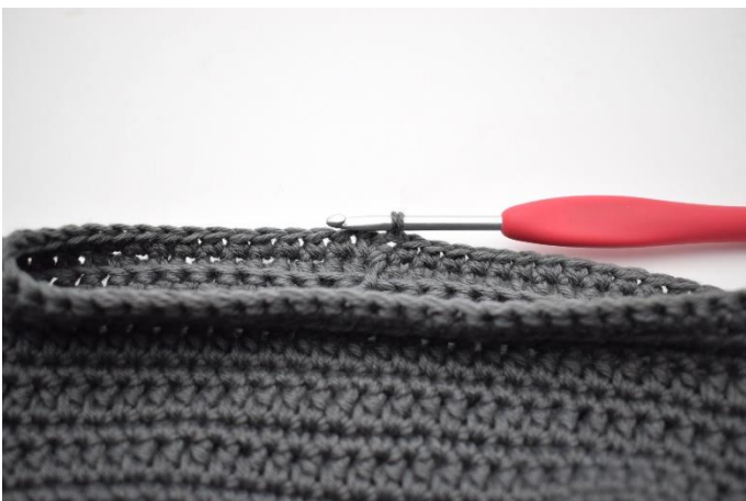
13. Lav 1 lm, og hækl fm omgangen rundt. Afslut med 1 km.