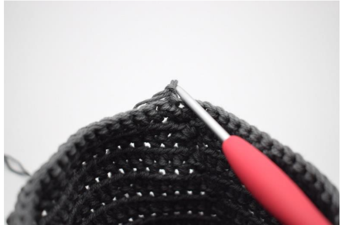
10. Vend/drej nu kurven, så du hæklér indefra kurven og ud.