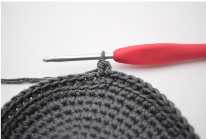
5. Hækl 1 hstm.