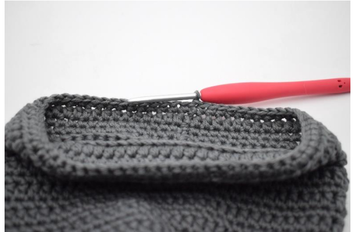
16. Lav 1 lm, og hæk fm omgangen rundt. Afslut med 1 km.