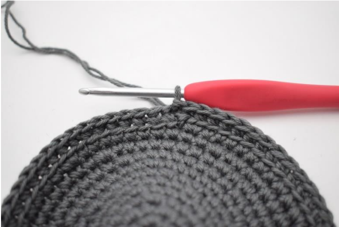
3. Hækl fm i bml omgangen rundt og afslut med 1 m.