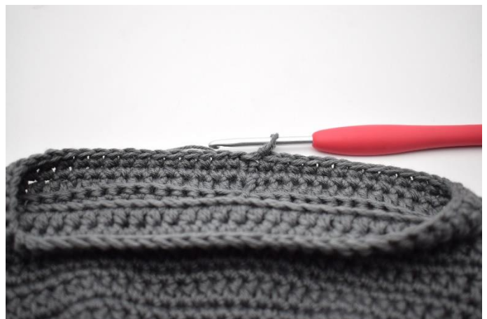
14. Lav 1 lm, og hækl fm omgangen rundt. Afslut med 1 km.