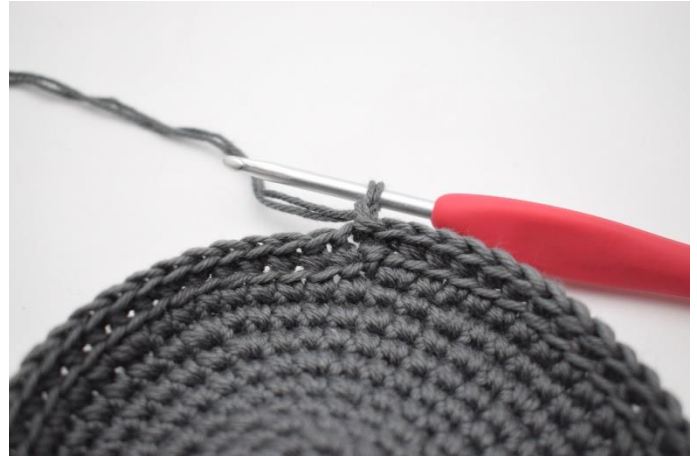
4. Lav 1 lm.