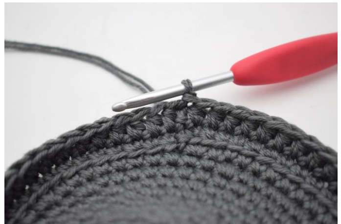
6. Hækl hstm omgangen rundt og afslut med 1 km.