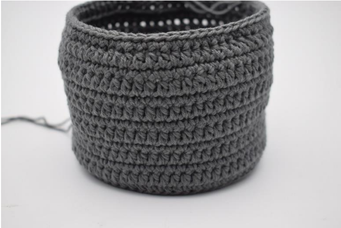
9. Gentag disse 2 omgange som beskrevet i opskriften.