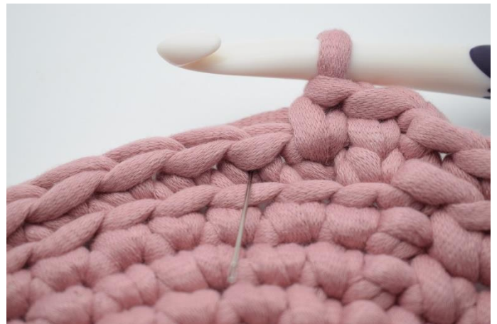
6. Næste maske hækles med fv. 2. Stik nålen ind i m. Nålen her markerer hvor din ks skal hækles.