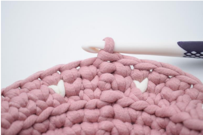
15. Lav 1 lm. Hækl 1 omgang ks med fv.1. Afslut med 1 km.