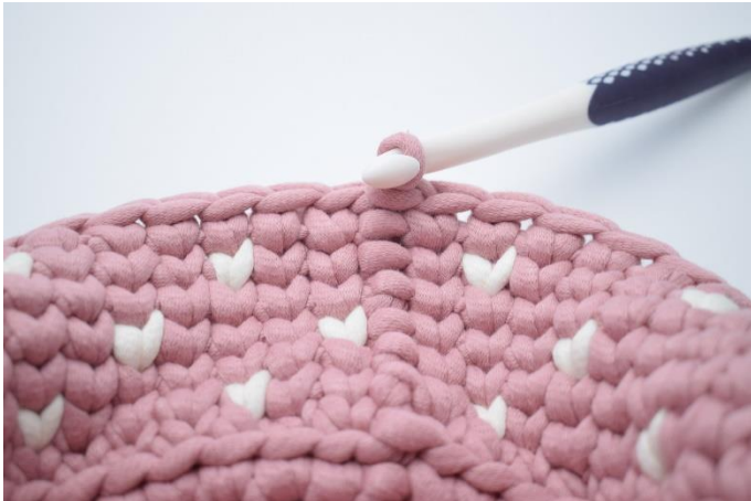
21. Lav 1 lm. Hækl 1 omgang ks med fv.1. Afslut med 1 km.