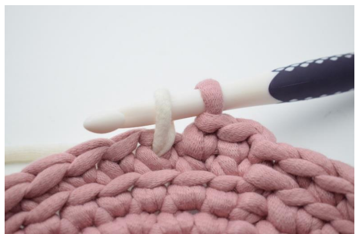
8. Træk garnet med tilbage gennem masken.