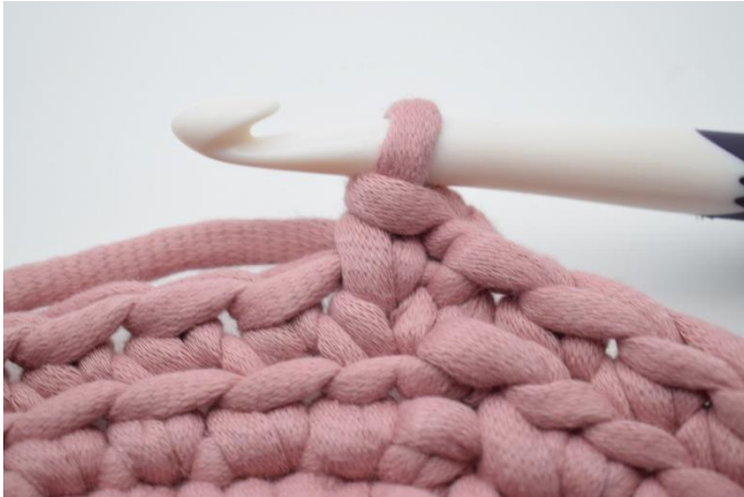
3. Sådan. Der er nu hækles 1 ks.