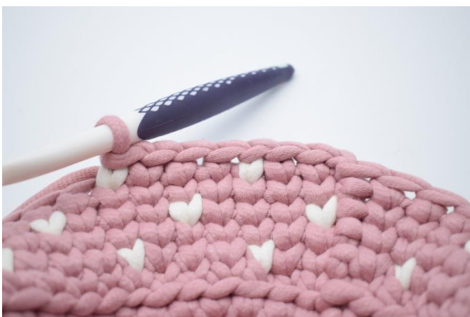
19. Lav 1 lm. Hækl 1 ks i de første 2 m i fv. 1. Næste ks hækles i fv. 2. " Hækl 1 ks i de næste 3 m i fv. 1, næste ks hækles i fv. 2. "