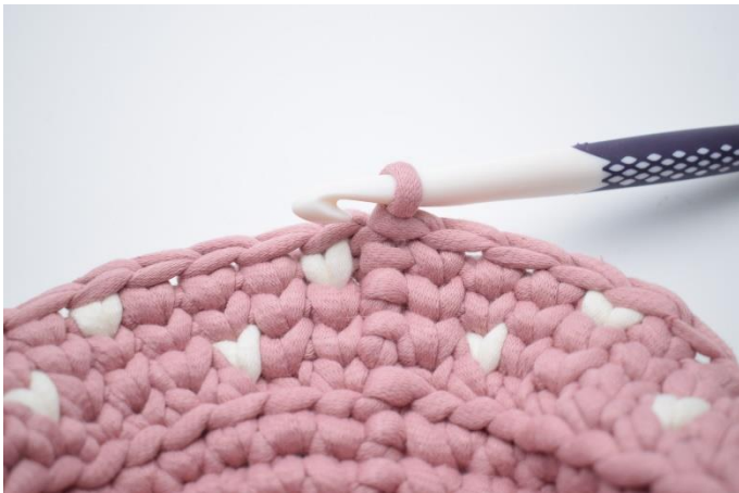
17. Gentag " til" omgangen rundt. Hækl 1 ks i fv. 1 i de sidste 2 m. Afslut med 1 km. (36)