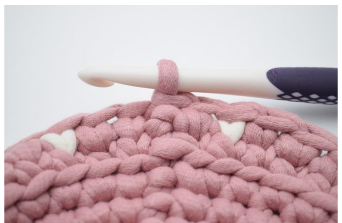
14. Gentag " Hækl 1 ks i de næste 3 m i fv. 1, 1 ks i næste m i fv. 2" omgangen rundt. Hækl 1 ks i sidste m i fv.1. Afslut med 1 km.