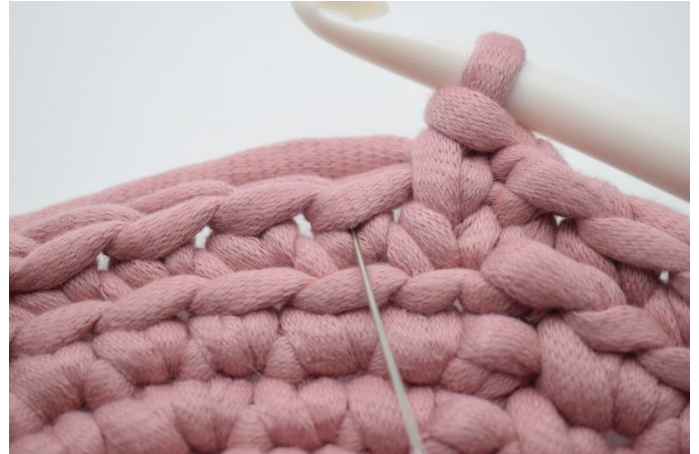
4. Hækl 1 ks i næste m. Nålen her markerer hvor din fm skal hækles for at blive til en ks.