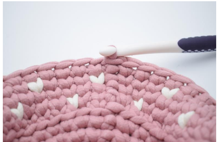
18. Lav 1 lm. Hækl 1 omgang ks med fv.1. Afslut med 1 km.