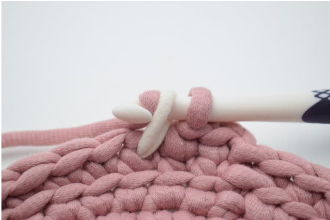
9. Slå nu fv. 1 om nålen og træk igennem begge løkker.