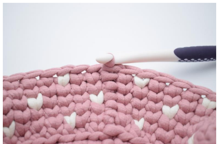
20. Gentag "til" omgangen rundt. Hækl 1 ks i sidste m i fv. 1. Afslut med 1 km. (36)