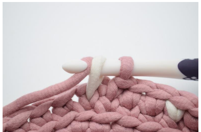
12. Hækl 1 ks i fv. 2 i næste m. Slå fv. 1 om nålen og lav sidste gennemtræk.