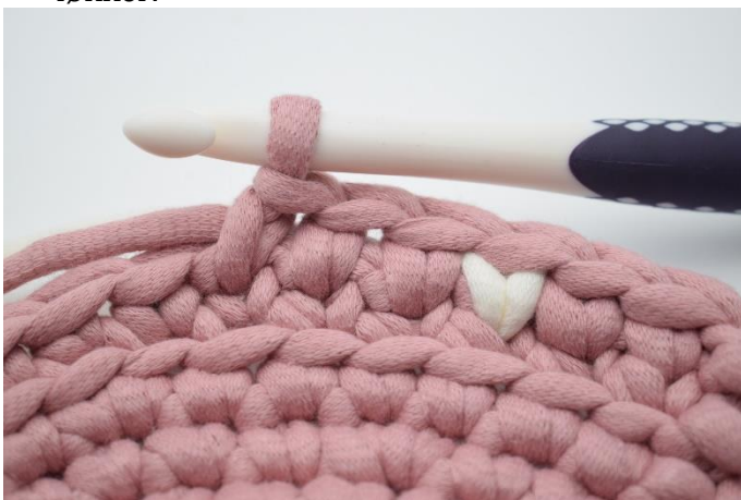
11. Hækl 1 ks i fv. 1 i de næste 3 m.