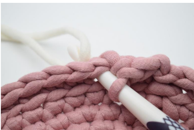
7. Slå fv. 2 om nålen.