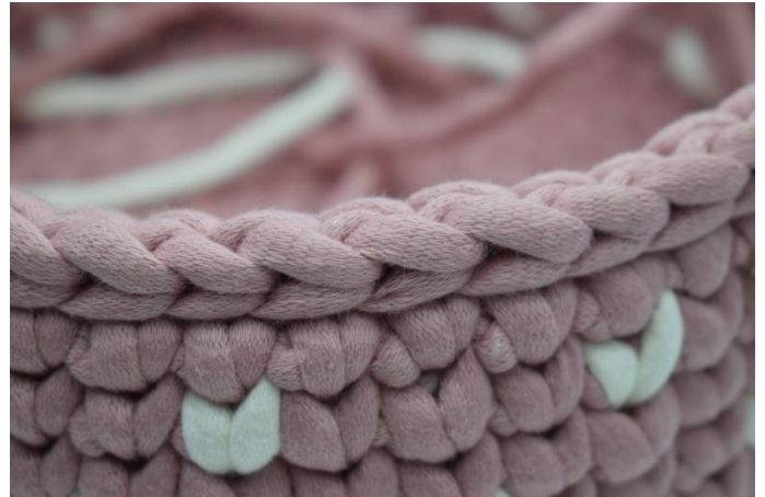
22. Hækl 1 omgang km. Klip garnet og hæft ender.