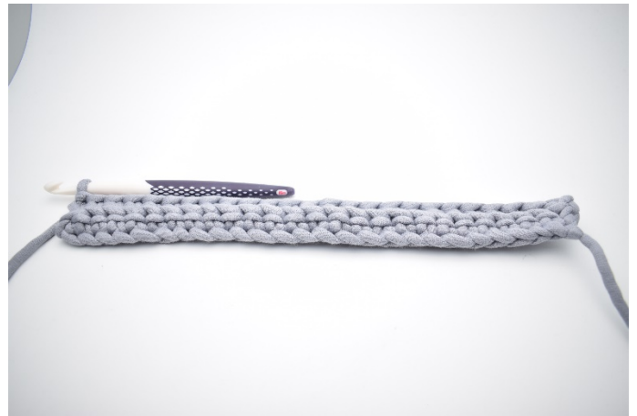
6. Gentag rækken ud.