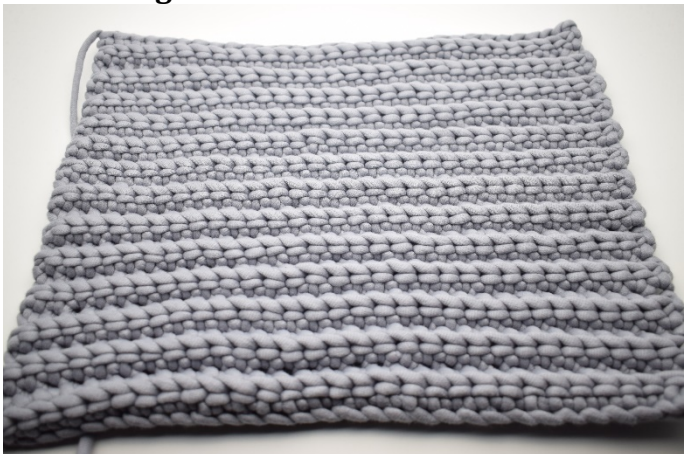
1. Gentag række 2 i alt 25 gange. Klip garnet og hæft ender. Hækl 1 stykke mere magen til.