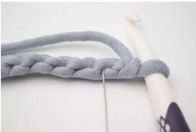
3. For at få en pænere kant kan man med fordel hækle fm i de vandrette lænker. Nålen her markerer den lænke din første fm skal hækles i.