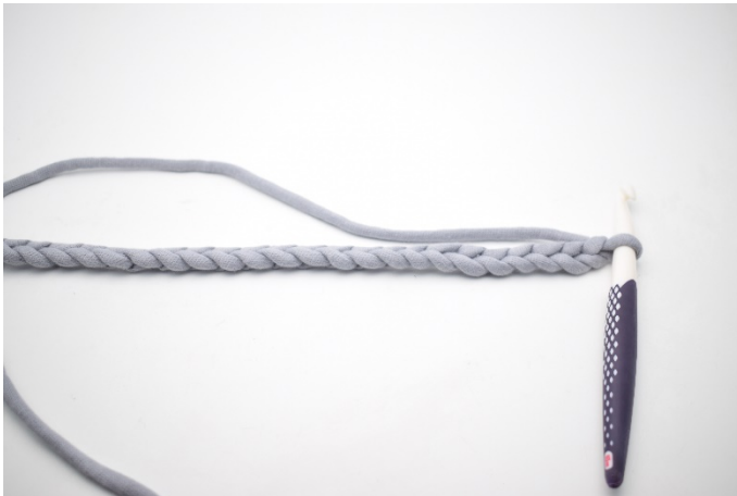
1. Slå dine lm op.