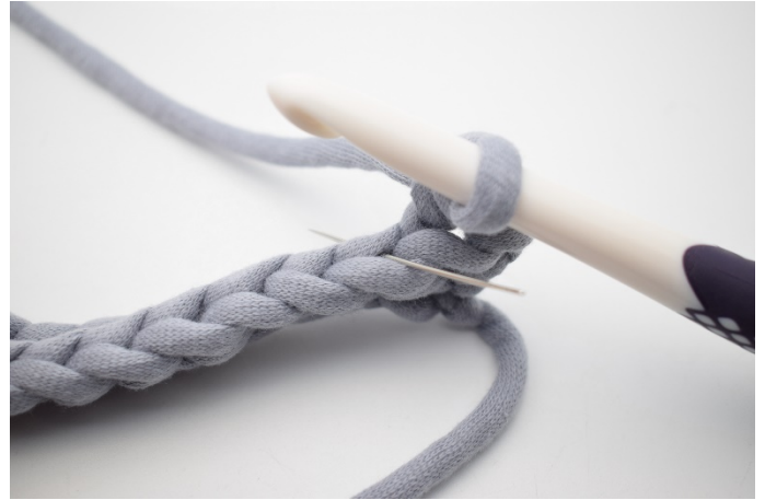
4. Hækl 1 fm i bml i næste m. Nålen her markerer den lænke din fm skal hækles i.