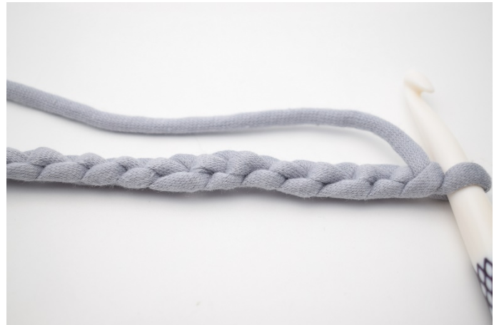
2. Drej din lm-række så "bagsiden" vender opad.